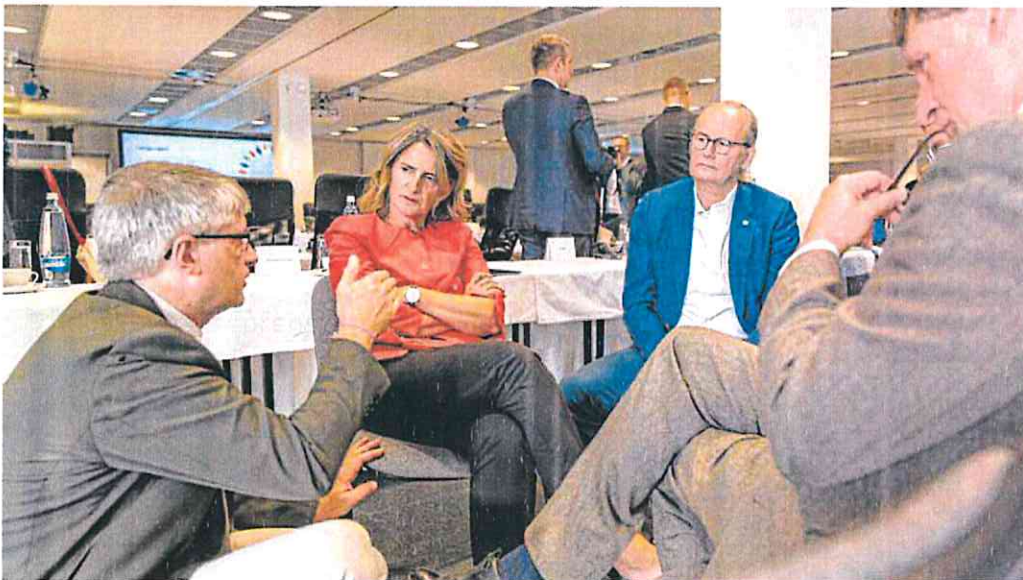
La ministra para la Transición Ecológica, Teresa Ribera, con otros ministros de Energía europeos en Praga.