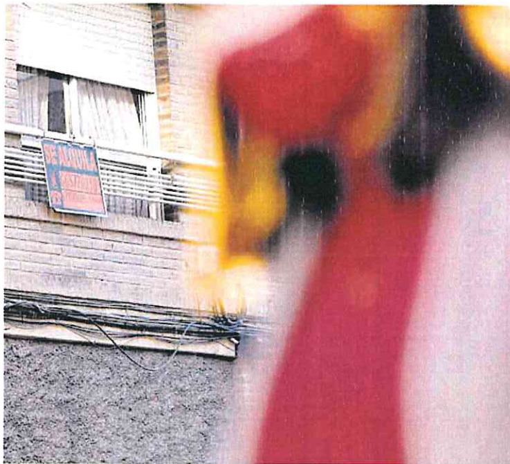
Una mujer pasa por delante de una vivienda con el cartel de 'Se alquila'.

La guerra en Ucrania y la inestabilidad internacional han servido de