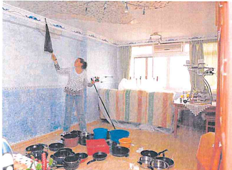
Una mujer ve afectada la sala de estar de su piso por goteras procedentes del vecino de arriba.

4 Televisores Nilait. La compañía alhameña PcComponentes ha lanzado su propia marca de televisores: Nilait. Esta nueva línea, ya disponible 'online', arranca con siete modelos, en un rango que va desde las 32 hasta las 55 pulgadas. Todos cuentan con pantalla LED bajo una resolución de hasta 4K Ultra HD. El funcionamiento está reforzado por el sistema operativo Android TV, que garantiza el acceso a los canales de 'streaming' más populares.