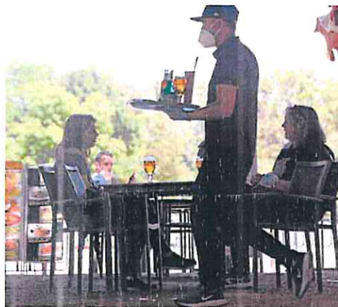
Un camarero atiende una terraza durante la pandemia.

La actividad inspectora del Ministerio de Trabajo se reorientará para hacer frente, según el Ejecutivo, al «debilitamiento de las condiciones de trabajo producido en los años precedentes, re-