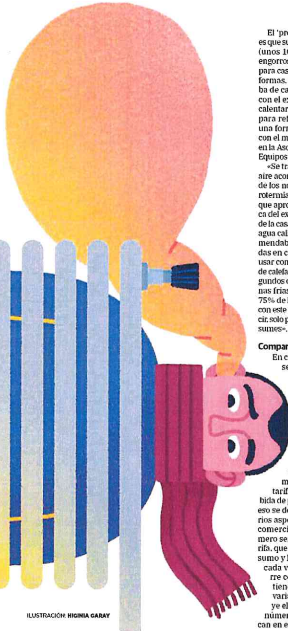
ILUSTRACIÓN: HIGINIA GARAY

formar la que ya tiene, el sistema de calefacción que gana por goleada es la aerotermia. «Hoy por hoy es la única alternativa al gas natural por precio, unos 200 euros al año de media», insisten en la OCU. De hecho, sus ventas se dispararon un 35% el año pasado, con más de 64.000 unidades instaladas. «En valores absolutos, todavía se trata de un mercado pequeño, pero está cada vez más presente en las viviendas de nueva construcción», aseguran en la Asociación de Fabricantes de Generadores y Emisores de Calor (Fegeca), un sector que no para de crecer y que solo el año pasado facturó cerca de 900 millones de euros.