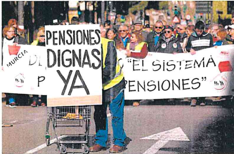
Imagen de archivo de una manifestación de pensionistas en Murcia.

Con la subida del 8,5%, los jubilados cobrarían de media 1.187 euros en 2023, una cifra lejos aún del salario medio en la Región, que por trabajador y mes alcanza en el segundo trimestre de 2022 los 1.884,43 euros, frente a los 2.153,88 en el conjunto de España, según revela la Encuesta Trimestral de Coste La-