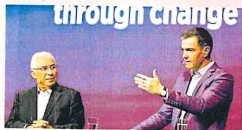
Sánchez ayer con con el portugués António Costa.

exiones energéticas entre la península y el resto de Europa, así como en gravar a las grandes empresas. «Tenemos que intervenir el mercado energético porque no está funcionando», dijo junto al primer ministro de Portugal, António Costa.