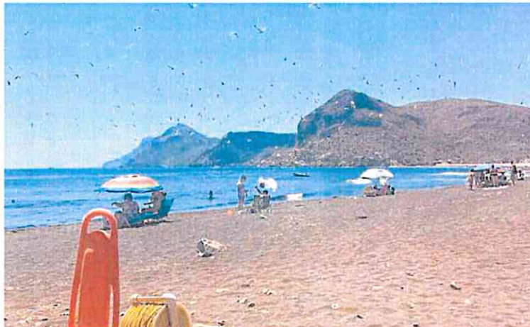
Bañistas en la playa de San Bruno de Portmán, el pasado mes de agosto.

—Como en España no se vive en ningún otro lado. En la playa se duerme de maravilla, con el aire que entra en casa limpio del mar. España, si no tuviéramos a ciertos políticos, sería el país más grande del mundo.