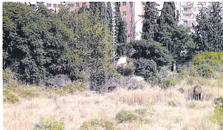
Lugar en Joven Futura donde las adolescentes denunciaron haber sufrido la agresión.

El fiscal Díaz Manzanera pidió a la Policía que mandasen los atestados referentes a menores solamente en 'analógico'