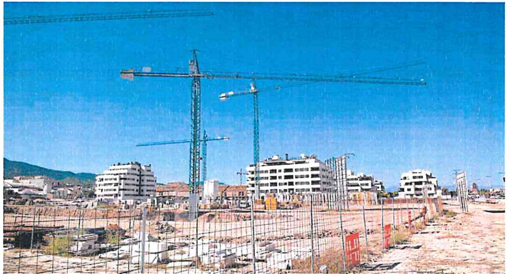
Nuevos desarrollos urbanísticos en la pedanía de Santo Ángel, junto a la Costera Sur.

El responsable de Urbanismo destacó que la cercanía del tranvía a los históricos núcleos de población de El Puntal, Churra, Cabezo de Torres y Espinardo (también en el norte del municipio) «ha fomentado el desarrollo de zonas de ensanche junto a estas poblaciones, así como nuevas áreas de