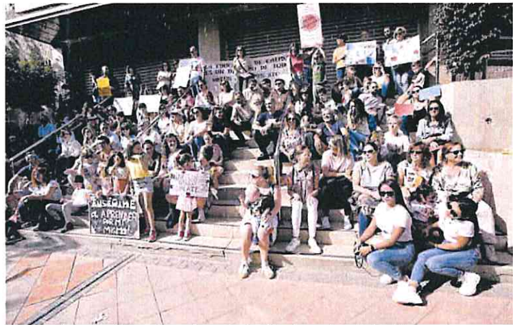
Madres, padres y alumnos, ayer frente a la Consejería exigiendo una educación de calidad.

Durante la concentración anunciaron que van a constituir una plataforma para reivindicar de forma urgente una formación específica para este personal que se encarga de atender a cerca de dos mil alumnos con necesidades educativas especiales que existen en los centros pú-