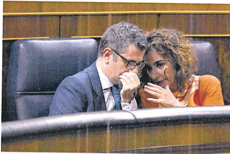
Montero departe con el Ministro de Presidencia, Félix Bolaños, esta semana en el Congreso. EUROPA PRESS/E. PARRA

Además, el nuevo documento presupuestario reconoce que el Gobierno había infrapresupuestado los ingresos tributarios de 2023 en unos 10.800 millones de euros. Esta sorpresa recaudatoria permitiría aplicar el año próximo medidas anticrisis por el lado del gasto por un importe similar a las ya adoptadas en 2022, que el documento cifra en 10.000 millones. En 2022 la mayor parte de las medidas anticrisis adop-