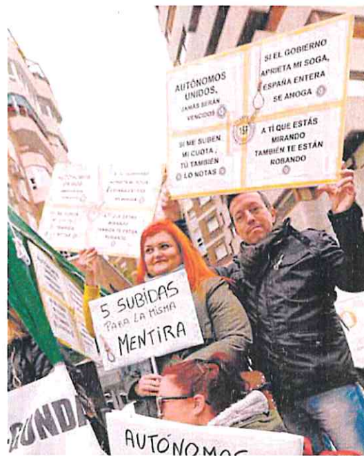
Protesta de autónomos en Murcia, en una foto de archivo.

Entre las debilidades detectadas entre el sector, la estrategia destaca que la mayoría de los autónomos cotizan por la base mínima, tienen una edad avanzada, es alto el porcentaje de quienes solo tienen estudios pri-