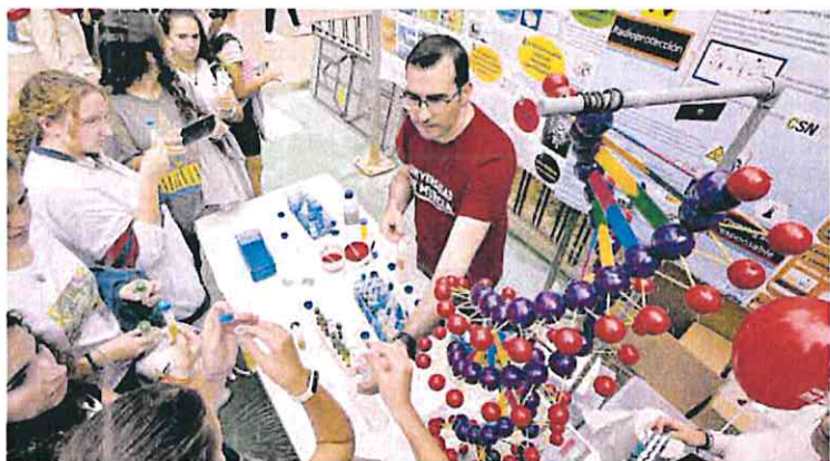
Muchos jóvenes se dieron cita en el primer día de la feria para visitar stand como este de la UMU.