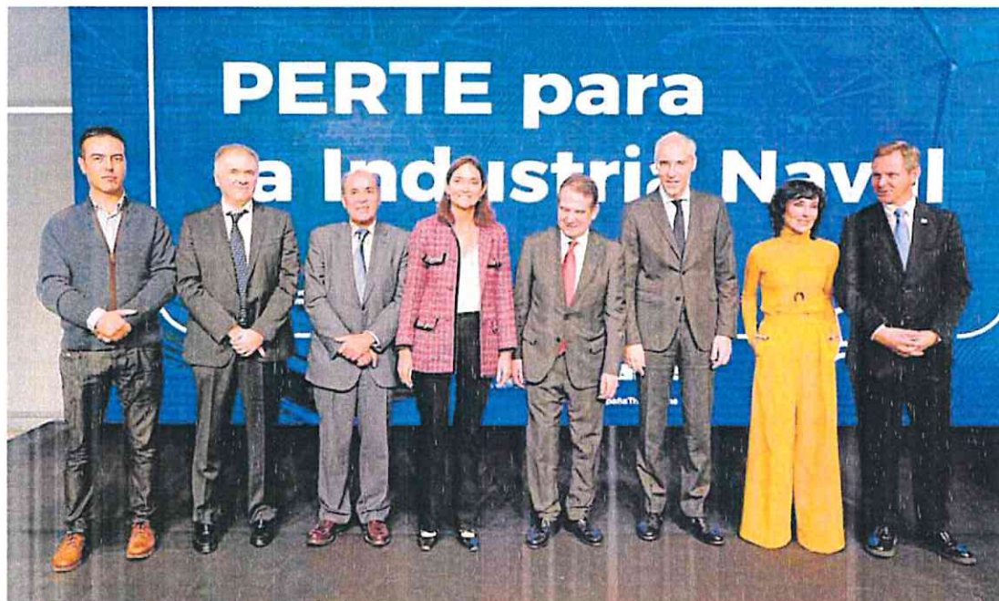
La ministra de Industria, Reyes Maroto, en la presentación del PERTE naval, ayer en Vigo.

millones de euros es la cuantía de las ayudas públicas que se detallarán en noviembre, vinculadas al PERTE naval. Este proyecto moverá en total unos 1.460 millones de euros.