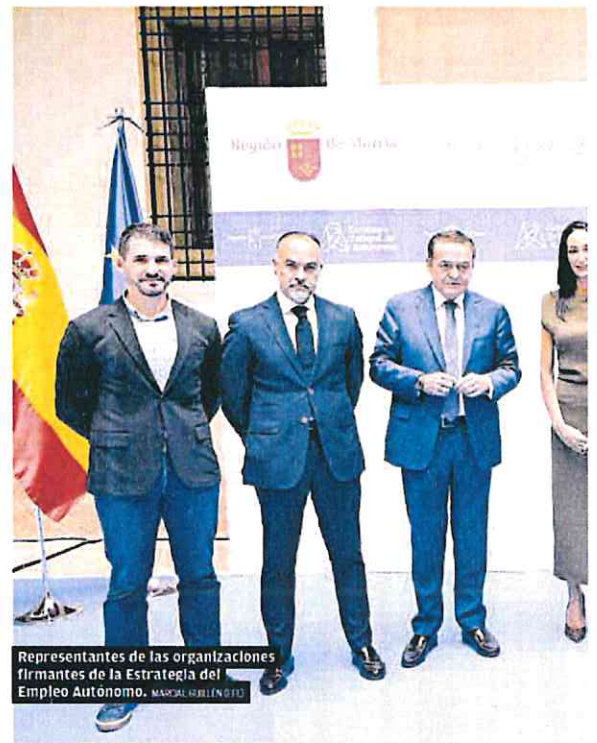
Representantes de las organizaciones firmantes de la Estrategia del Empleo Autónomo.

Destacó que el Gobierno regional «gestiona desde la colaboración y la concertación, aunando los intereses de todos». Además, elogió «la altura de miras» de todos los firmantes, y «el compromiso» mostrado durante un proceso marcado por «innumerables sesiones de trabajo» con la Consejería de Empresa, Empleo, Universidades y Portavocía.