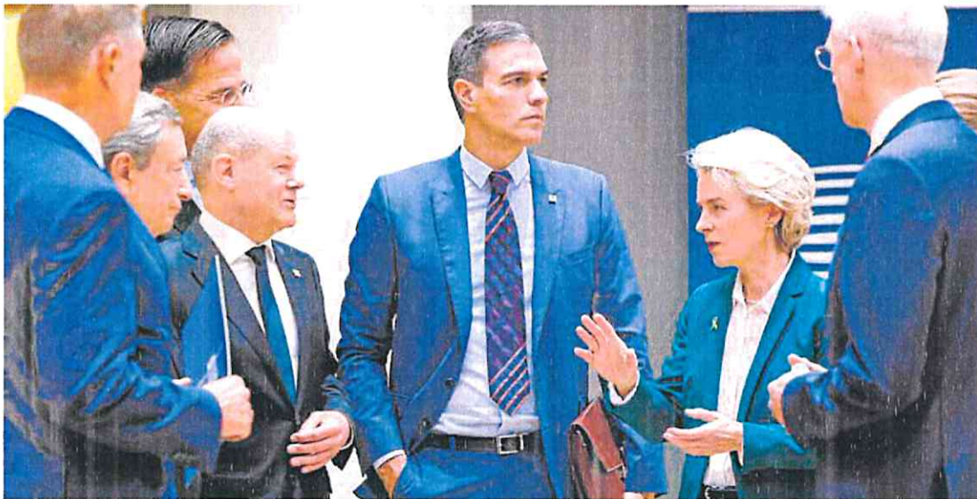
Pedro Sánchez (c), junto a la presidenta de la Comisión Europea, Ursula von der Leyen, y el canciller alemán, Olaf Scholz, ayer en Bruselas.

La relación con China marcó otro de los puntos del día. El bloque no está interesado en «una lógica de confrontación» con el gigante asiático y subrayó la necesidad de ganar «autonomía estratégica» en materia de semiconductores y materias raras, entre otros.