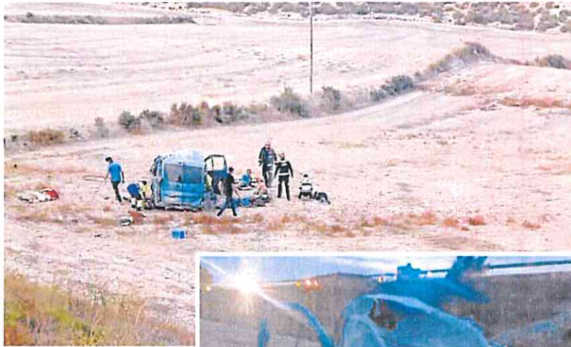
Arriba, efectivos de emergencias atienden a los heridos; a la izquierda, detalle de la furgoneta siniestrada.

El Centro de Coordinación de Emergencias 112 de la Región de Murcia recibió varias llamadas, a partir de las 18.55 horas, en las que se alertaba del accidente y se indicaba que una furgoneta se había despenado por un barranco en la pedanía caravaqueña de La Almudema, muy cerca de la Colonia de Santa Teresa, pertenecien-