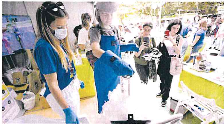
Los participantes pueden realizar todo tipo de experimentos asesorados por científicos.

Drones submarinos y de reconocimiento facial, juegos cuánticos y simuladores de terremotos y de mutación genética son algunos de los talleres que ofrece la Politécnica, mientras que la UCAM tiene al metaverso como uno de los protagonistas, permitiendo realizar un recorrido por el Museo del Cristo de la Sangre (Murcia) mediante gafas de realidad virtual, gracias a un desarrollo propio de la Católica.