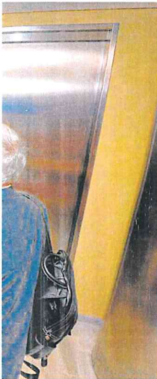
reunión.