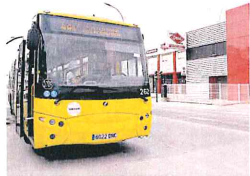
Autobús de la línea 44 en la carretera de Alcantarilla.

El Ayuntamiento de Murcia prepara un plan para reforzar las líneas de Los Ramos-Zeneta (30), El Raal y Alquerías (31), Barriomar y Puebla de Soto hasta Espinardo (44) y la nueva conexión con el Campus de la Salud (26C), que resulta insu-