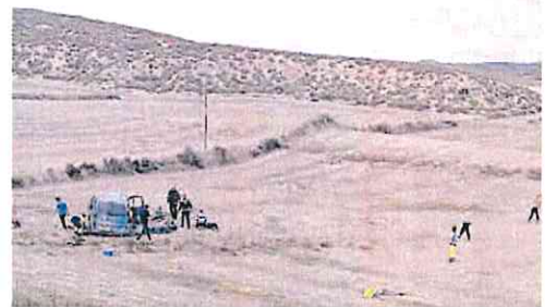
Accidente mortal de la furgoneta en Caravaca el viernes.