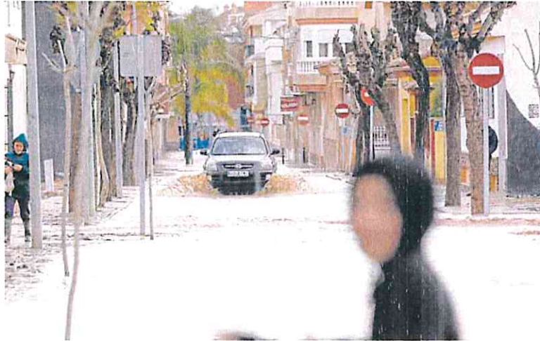
Una calle de Los Alcázares inundada tras un episodio reciente de lluvias torrenciales.

Los técnicos de la Consejería de Fomento indican que, durante el proceso, «se han utilizado equivocadamente modelos analíticos que fueron diseñados para cuencas pequeñas, para regímenes