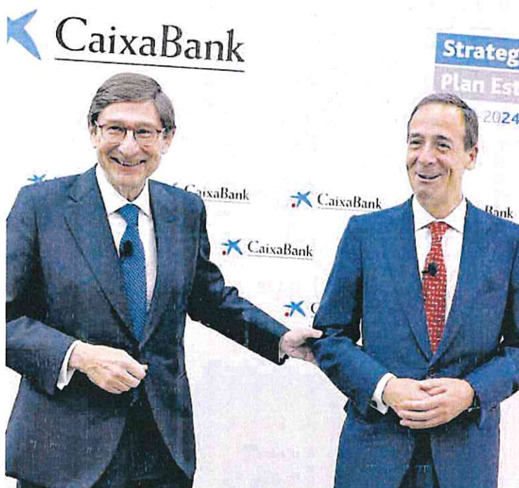
El presidente de CaixaBank, José Ignacio Goirigolzarri, y el consejero delegado, Gonzalo Gortázar.

Al ser el propietario de control tanto de BFA (matriz de Bankia) como de la filial (la propia Bankia), el FROB no contabilizaba su participación en ambas según su hipotético valor de mercado, sino en función del patrimonio neto de todo el grupo menos los intereses minoritarios (básicamente, la parte del patrimonio neto de Bankia que correspondía al resto de sus accionistas que no eran el Estado). En 2020, la inminente fusión del banco con CaixaBank obligó al grupo BFA a reclasificar su participación en Bankia como disponible para la venta y a recal-