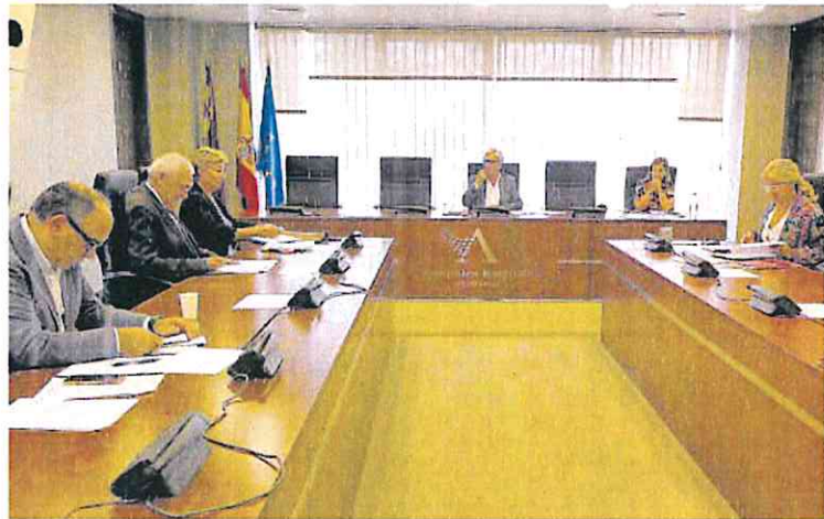
Reunión de la ponencia de la comisión de Sanidad y Política Social, ayer.

Según explicó, en torno al 8% de la población murciana, unas 120.000 personas, podrían beneficiarse de esta iniciativa, que consistiría en otorgar un carné de familia monoparental a estos núcleos familiares que les permitirá disfrutar de una reducción de tasas y precios públicos. Asimismo, los beneficiarios tendrán acceso gratuito o rebaja en las matrículas de la universidad, de las escuelas in-