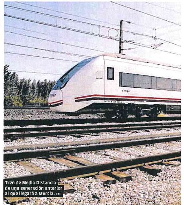
Tren de Media Distancia de una generación anterior al que llegará a Murcia. car

A partir de entonces podrán circular también trenes eléctricos de