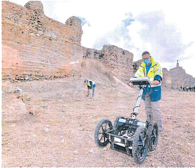
Dos operarios trabajando en el Castillejo con un georadar, en una foto de archivo.

La Concejalía de Mayores, Vivienda y Servicios Sociales ha logrado ejecutar casi 148.000 euros y tiene pendiente, según el informe, otros 3,5 millones de eu-