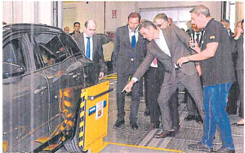
El presidente del Gobierno, Pedro Sánchez, ayer en la factoría de Renault en Valladolid.

La lista de espera no es baladí. Ahí junto al proyecto valenciano se encuentra otro gran punto de atracción, como la gigafactoría proyectada en Navalmodal de la Mata (Cáceres).