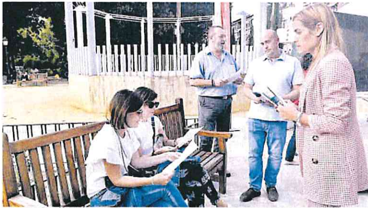
La carpa se instaló este lunes y volverá a instalarse mañana en el Jardín de Floridablanca.

La apertura de la nueva línea de Alta Velocidad permitirá establecer nuevos servicios entre Murcia y Alicante con trenes de Cercanías eléctricos, aunque seguirán en uso los vehículos diésel utilizados ahora en la línea.