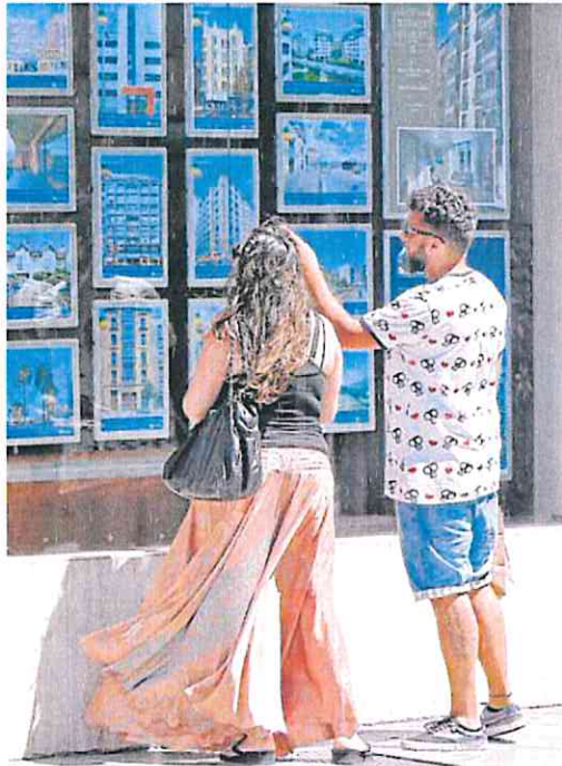
Una pareja consulta ofertas de una inmobiliaria murciana.

Lo que se está valorando es precisamente una modificación de la deuda hipotecaria permitiendo alargarla hasta cinco años más, para que los hipotecados puedan hacer frente ahora al repunte del euríbor —con unas cuotas que no se disparen— a cambio de que sus créditos duren más tiempo. Además, se valora otra idea, la propuesta por CaixaBank para congelar las cuotas hipotecarias de las familias con más problemas económicos durante 12 meses. Aunque en este caso no todas las entidades están de acuerdo.