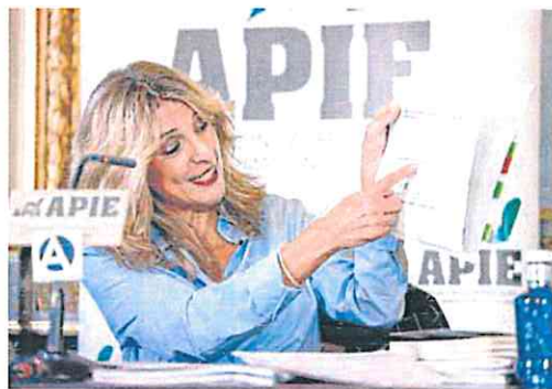
La vicepresidenta Yolanda Díaz, ayer en un encuentro de la APIE.

Pese a que la ministra sostuvo que será el «diálogo» el que deci-