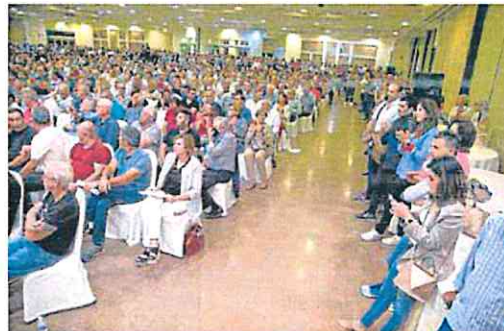
Asistieron muchas familias del Campo de Cartagena. A. GIL

zada ha supuesto un riesgo en sí mismo para el medio ambiente ni para la salud de las personas». En este punto, explica que no ha quedado acreditado que esta fuese «la causa exclusiva y directa de las inundaciones (...) ni de la situación en que desgraciadamente se ha visto envuelto el Mar Menor».