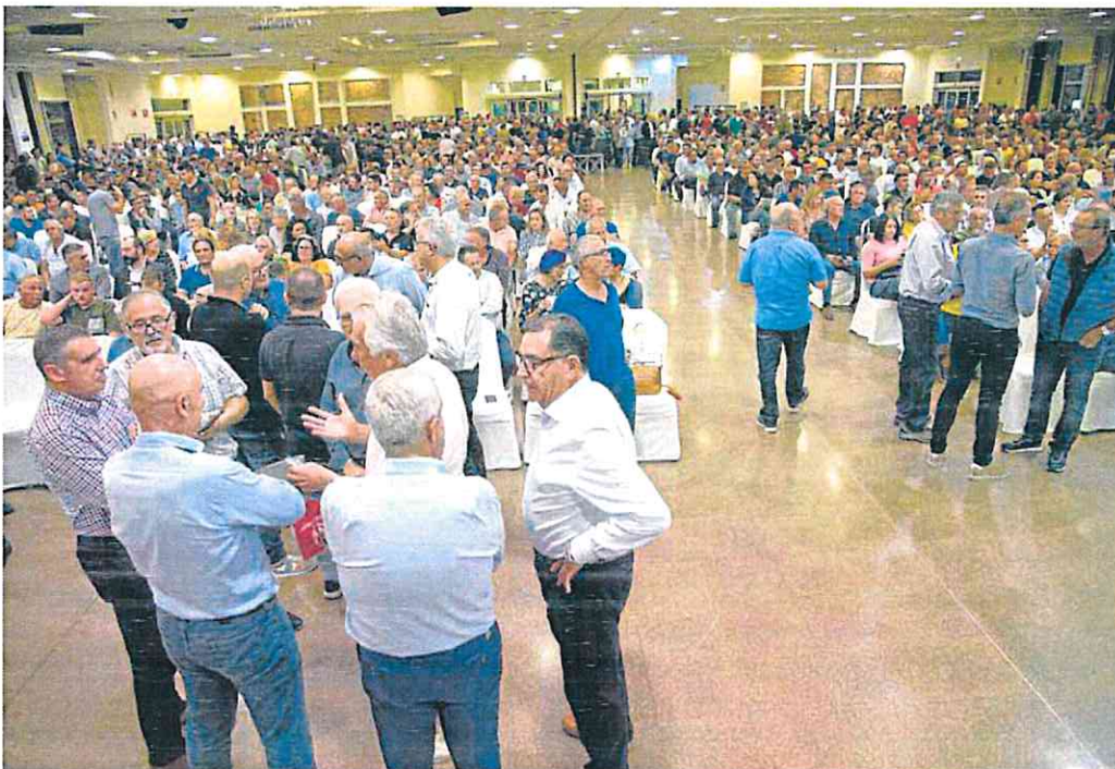
Unas 1.500 personas se dieron cita en la asamblea convocada anoche en Torre Pacheco.

La semana anterior, las mismas organizaciones solicitaron a la Junta de Gobierno de la Con-