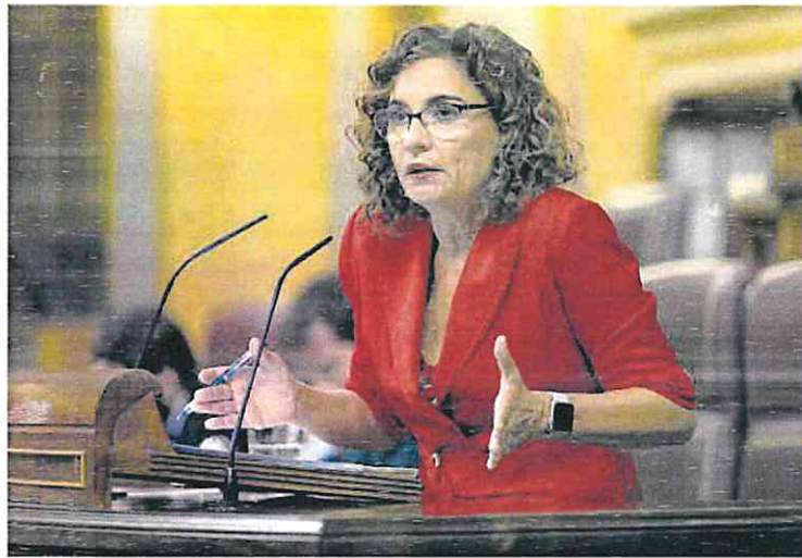
La ministra de Hacienda, María Jesús Montero, ayer, en el Congreso de los Diputados.

La ministra reconoció que «esperan meses difíciles» por delante a causa del «enfriamiento de la economía», pero defendió la vigencia del cuadro macroeconómico sobre el que se han construido las Cuentas públicas, a pesar de las correcciones a la baja del crecimiento formuladas por el