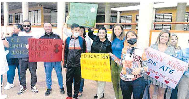
Imagen de una de las concentraciones realizadas ayer por padres y madres en varios centros