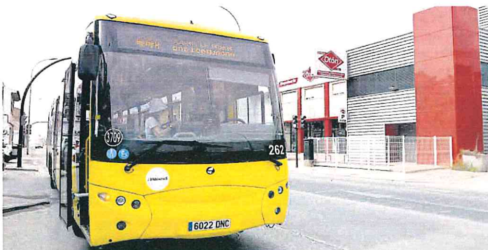
La línea 44 amplía su recorrido y ofrecerá servicios a todas las pedanías de la carretera de Alcantarilla.