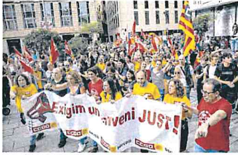
Protesta de trabajadores del sector servicios en Barcelona.

La renuncia de facto de la gran patronal CEOE a un gran pacto salarial y su estrategia de ir convenio a convenio amenazan con agrandar las desigualdades entre unos trabajadores y otros. El músculo sindical se nota en los acuerdos cerrados y, pese a que la pérdida de