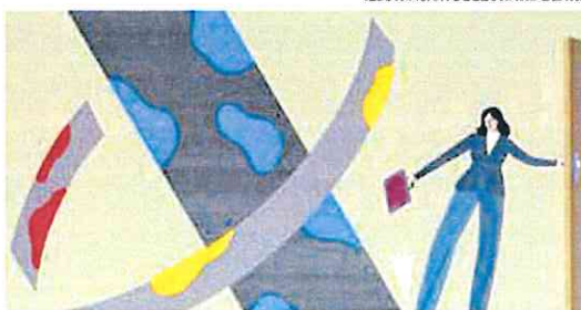
ILUSTRACIÓN DE LEONARD BEARD