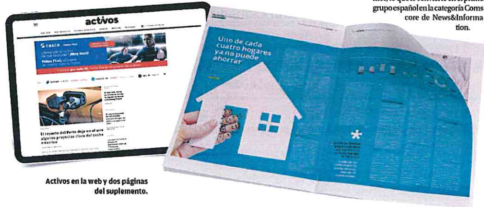
Activos en la web y dos páginas del suplemento.

Grupo líder de la información regional y local en España, Prensa Ibérica edita 25 periódicos impresos y digitales en doce comunidades autónomas y diversas revistas. Con 1,7 millones de lectores en prensa y revistas (EGM) y 250.000 ejemplares en doce comunidades autónomas (OJD), el grupo es líder en audiencia y difusión en diversas autonomías y cuenta con un creciente posicionamiento en soporte digital. En Internet, sus publicaciones alcanzan los 27 millones de visitantes únicos y los 620 millones de páginas vistas al mes, lo que le convierte en el primer grupo español en la categoría Commerce de News&Information.