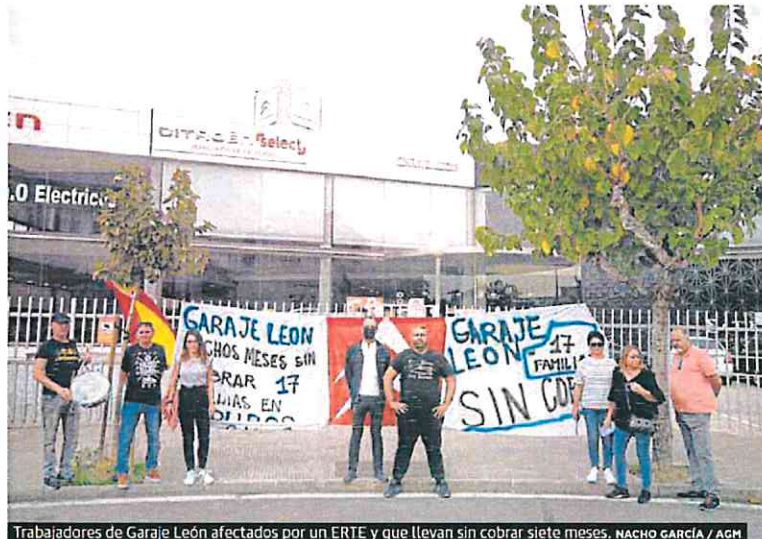
Trabajadores de Garaje León afectados por un ERTE y que llevan sin cobrar siete meses.

Serrano se refirió también a otras medidas, como la apuesta por la innovación en el medio rural (los grupos operativos); la transferencia y formación; la mujer en el medio rural; el mantenimiento de la población; y la modernización de los sistemas agrícolas «para la sostenibilidad medioambiental, económica y social del medio rural de la Región», explicó.