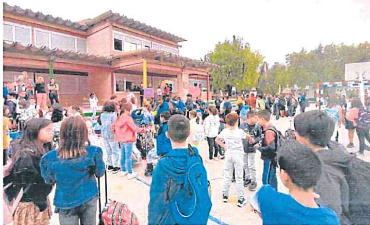
Concentración en el CEIP Artero, de Bullas. PLATAFORMA NINGÚN NIÑO SIN ATE

Debido al gran interés que han despertado estas propuestas, algunas se están repitiendo y hay programas que celebran ya su cuarta edición. Se han realizado 197 sesiones diferentes entre jornadas, talleres y mesas redondas, en colaboración con organismos europeos y de distintos países. Además, según fuentes del Info, se han puesto en marcha 28 'start-ups' innovadoras.