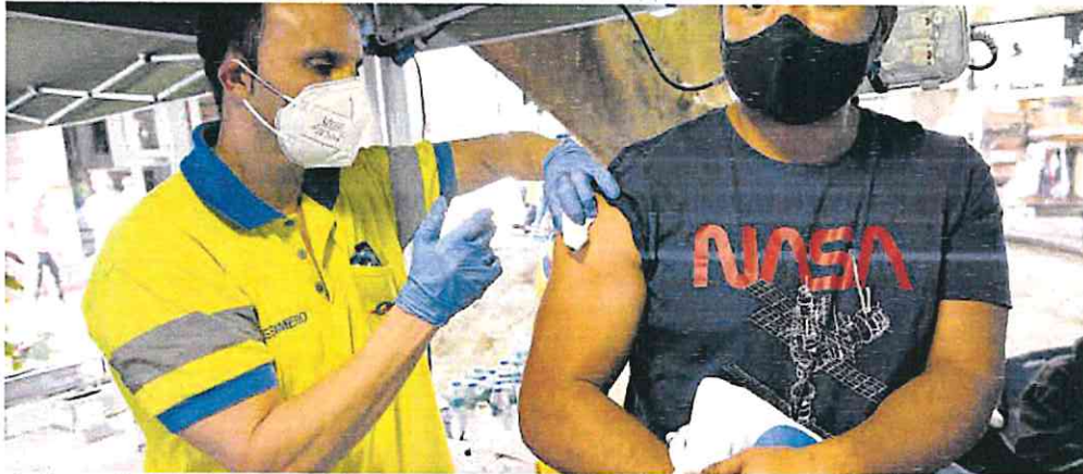
El Gobierno regional pide al Gobierno Central un envío suficiente de vacunas de covid y de la gripe.

El segundo de los frentes para lograr este objetivo es redefinir los criterios para poder ampliar la oferta de médicos residentes en todas las comunidades autónomas y adaptarnos a las demandas asistenciales que soportamos y a las que no podemos dar respuesta con el sistema actual», agregó el dirigente autonómico de la Consejería de Salud del Ejecutivo regional.