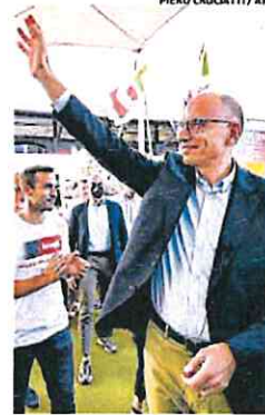
Enrico Letta, en un acto electoral.

Fue el punto de ruptura para Calenda, que anunció que retiraba su apoyo al PD, para aliarse con el partido Italia Viva de Matteo Renzi, otra formación centrista