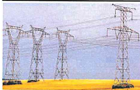
Torres de alta tensión cerca de Villers-La Montagne, en Francia.

Son ideas aglutinadas en un documento preliminar de trabajo que Bruselas ha puesto sobre la mesa de cara a la reunión de urgencia que los ministros de energía de la UE celebrarán el próximo viernes, tras un verano lleno de «episodios alarmantes». Como el que disparó el precio de la electricidad en los países bálticos el 16 de agosto a media tarde a 4.000 euros el megavatio hora. Fue algo puntual. Pero el temor ha llevado a Bruselas a diseñar, a marchas forzadas, una respuesta para reducir el consumo eléctrico de forma coordinada en la UE, particularmente en las horas pico del día en las que la electricidad es más cara, a través de fórmulas similares a las utilizadas para reducir la de-