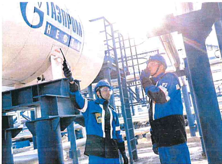
Dos técnicos de Gazprom en las instalaciones de suministro del gasoducto Nord Stream.

Al compás de que la cotización del gas en el mercado internacional se mantenga tan elevada como