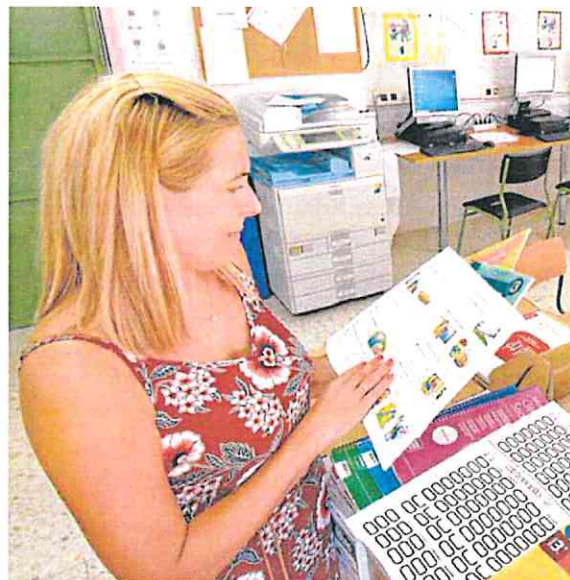
Profesores del colegio San Juan Bautista, ayer, preparan el material y los libros

A los docentes les inquietan también las altas temperaturas previstas esta semana, con máximas de 38 grados. «Supone un infierno a la hora de poder desarrollar las tareas docentes e influye, sin duda alguna, de forma muy negativa en el rendimiento escolar del alumnado de nuestra Región», denunciaron ayer desde CC OO y Anpe, que volvieron a criticar los retrasos en la publicación de los currículos definitivos de la Lomloe, que aún no tienen fecha.