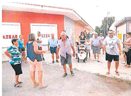
Vecinos de La Aljorra patrullan las calles, el viernes