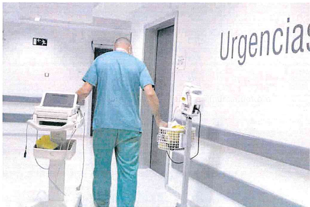
Los futuros residentes que logren plaza en alguna de las especialidades ofertadas se incorporarán a sus puestos en mayo.

► La Región de Murcia ha vuelto a reclamar en la reunión del Consejo Interterritorial del Sistema Nacional de Salud celebrada ayer que se desarrolle un plan de medidas urgentes para paliar el déficit de médicos en España. En concreto, el consejero de Salud, Juan José Pedreño, recordó que «se trata de un problema que se agrava en Atención Primaria». Desde la Comunidad se ha solicitado en diversas ocasiones al Ministerio que desarrolle un Plan de medidas urgentes a nivel estatal para solucionar la falta de médicos en España, que impide contar con un plan que garantice la cobertura de jubilaciones y bajas de los facultativos. La propuesta regional pasa por el aumento de las ratos necesarias en las facultades de Medicina, a fin de formar a los especialistas que demanda la sociedad. El segundo objetivo es redefinir los criterios para ampliar la oferta de plazas de residentes.