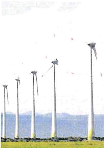
Molinos de energía eólica.

En un artículo reciente, resumía en unas frases la sinrazón actual del sector eléctrico europeo: «Las aspas de las turbinas eólicas en la cadena montañosa situada frente a mi ventana están girando con especial energía hoy. La tormenta de anoche ha amainado, pero los fuertes vientos continúan suministrando kilovatios adicionales a la red eléctrica a un costo adicional (o costo marginal, en el lenguaje de los economistas) precisamente cero. Pero las personas que luchan por llegar a fin de mes durante una terrible crisis del coste de vida deben pagar estos kilovatios como si fueran producidos por el gas natural licuado más caro transportado a las costas de Grecia desde Texas. Este absurdo, que prevalece mucho más allá de Grecia y Europa, debe terminar. El absurdo surge del engaño de que los estados pueden simular un mercado eléctrico competitivo y, por lo tanto, eficiente. Debido a que en nuestros hogares o negocios ingresa un único cable de electricidad, dejar las cosas en manos del mercado conduciría a un