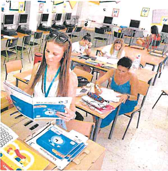
para hoy, día del regreso a las aulas.

La escasez de expectativas laborales que castiga a los vecinos de la zona desde entonces se deja sentir en el colegio, que este curso solo acogerá a doce alumnos nuevos de primero de Infantil. «Cada año hay menos niños, pero el colegio se mantiene y la situación tiene sus ventajas», cuenta la jefa de estudios, quien ayer, con sus 17 compañeros maestros, preparaba las aulas y el material para la bienvenida de los pequeños.