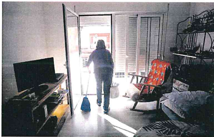
Una mujer realiza tareas domésticas en una vivienda.

El presidente del Gobierno, Pedro Sánchez, anunció ayer que el Consejo de Ministros aprobará este martes el subsidio para em-