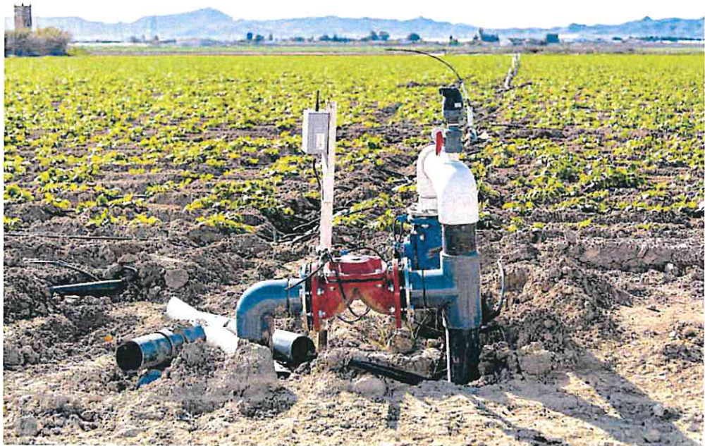
Una boca de riego, ubicada en una finca agrícola de Torre Pacheco.

de cuenca no quiere dar datos de cuántos expedientes ha tramitado ya.