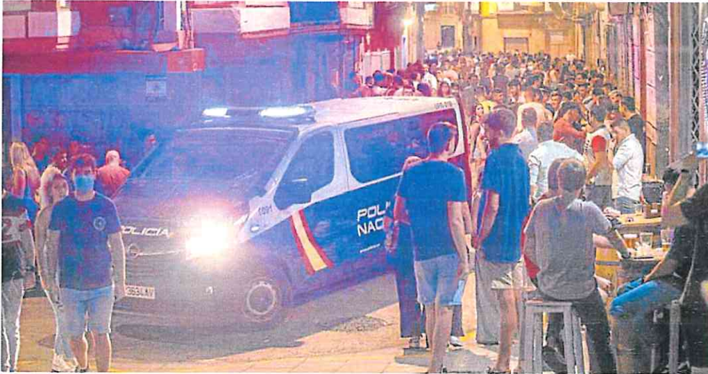
Una furgoneta pasa por la calle del Aire, en el primer día de fiestas del pasado año.