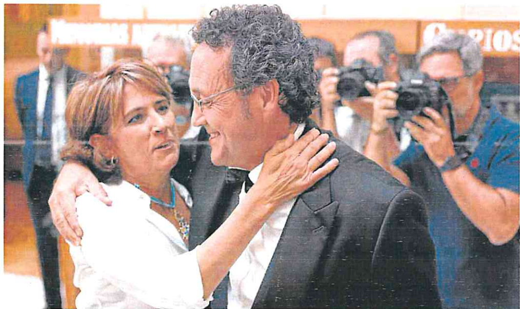
La fiscal Dolores Delgado saluda ayer con emoción contenida a su sustituto al frente de la Fiscalía General del Estado, Álvaro García Ortiz.

Desde Unidas Podemos exigieron a Feijóo que «cese su golpismo y cumpla» con la Constitución. «Nunca un Poder Judicial había estado secuestrado cuatro años contra el mandato de las urnas», criticó el diputado Jaume Asens.