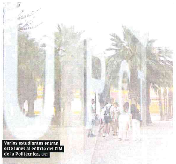
Varios estudiantes entran este lunes al edificio del CIM de la Politécnica. UPCT