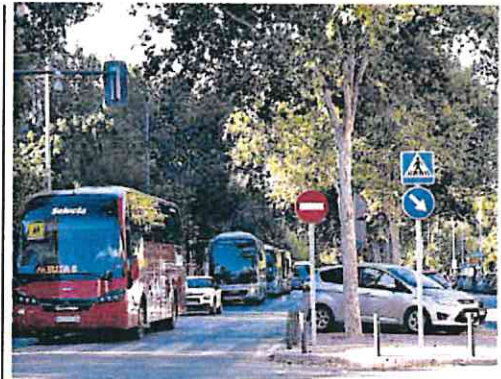
Protesta del transporte escolar el curso pasado.

UCAM A la espera de Veterinaria ► La privada espera todavía a conocer si podrá impartir el polémico grado de Veterinaria este curso.