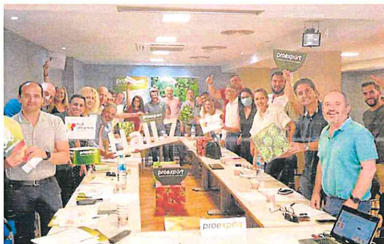
Reunión de socios de Proexport para repartirse los espacios de sus stands en la próxima feria.

MURCIA. El Ejecutivo regional ha pedido al Gobierno de la nación, en la reunión de la mesa de la sequía, que prepare todas las medidas y recursos posibles. El director general del Agua, José Sandoval, ha solicitado la inmediata activación, cuando llegue el momento, de todos los recursos adicionales posibles, con especial incidencia en las desaladoras, con un precio subvencionado, y la batería estratégica de pozos. La Federación Nacional de Comunidades de Regantes, por su parte, espera que el Gobierno recorra también sus propuestas. Criticó que no acudiesen los ministros Luis Planas y Teresa Ribera.