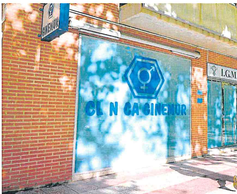
La clínica Ginemur de Murcia es uno de los centros sanitarios que ha resultado adjudicatario en el concurso público.

Salud mantiene en el nuevo contrato su modelo, pero con algunos cambios. Ninguna mujer tiene ya que salir de la Región, destaca la Consejería, gracias a que La Arrixaca asume ahora las intervenciones en las fases más avanzadas de la gestación. La derivación de estas pacientes a Madrid generaba fuertes polémicas y quejas de las afectadas. Además, «se