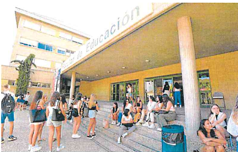
Alumnos de la Universidad de Murcia, en el Campus de Espinardo.

Las clases en la UMU arrancaron ayer para los 32.000 alumnos de la institución con tres nuevos grados en su catálogo de títulos: Terapia Ocupacional,