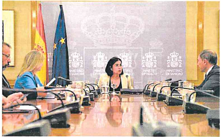
La ministra de Sanidad, Carolina Darias, ayer, durante la reunión del Consejo Interterritorial.

Durante años, el Servicio Murciano de Salud ha rechazado la práctica de abortos en la red pública, aduciendo que el 78% de ginecólogos eran objetores de conciencia. Sin embargo, una encuesta realizada en 2020 ofreció unos resultados muy diferentes: solo el 30% de los profesionales de La Arrixaca se mostraron contrarios a cualquier tipo de interrupción voluntaria del embarazo. Algunos ginecólogos denunciaron que nunca hasta entonces se había hecho una encuesta «seria» para determinar quién estaría dispuestos a practicar abortos.