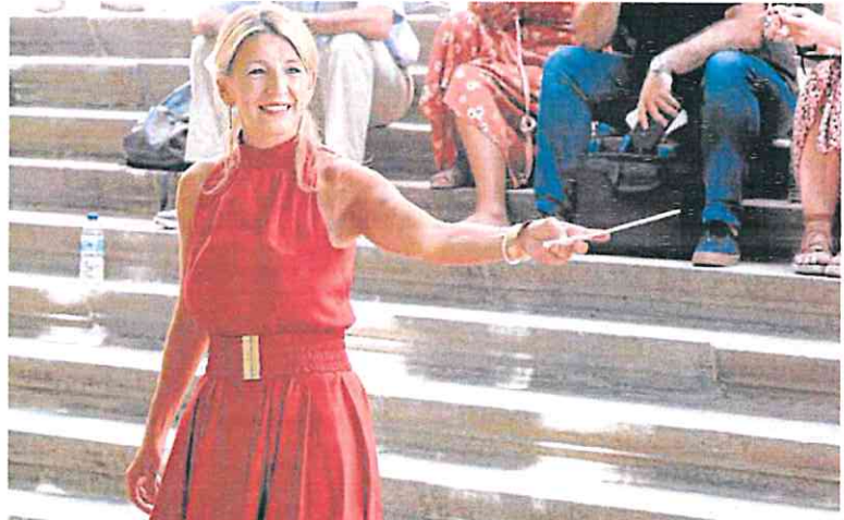
La vicepresidenta segunda y ministra de Trabajo, Yolanda Díaz, comparece ante la prensa después de una reunión con la Comisión Asesora para el Análisis del Salario Mínimo Interprofesional.

No obstante, para topar los alimentos tendrá antes que convenir a otros miembros de su propio Gobierno, puesto que el ministro de Agricultura, Luis Planas, ya se mostró este fin de semana contrario a esta propuesta, que además considera que no es posible legalmente, ni tampoco «deseable». De igual manera, Planas se manifestó también en contra de imponer un impuesto al sector de la distribución, una medida que reclama también Unidos Podemos.