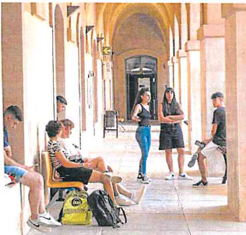
Estudiantes de la UPCT, ayer, el primer día de clase.

Por su parte, el precio de la vivienda en la Región de Murcia ha subido un 0,8% en agosto con respecto al mes anterior y un 3,8% en términos interanuales, hasta alcanzar un precio de 1.160 euros por metro cuadrado, según los datos de Fotocasa. En el conjunto del país, el precio de la vivienda de segunda mano subió un 1,4% en agosto respecto al mes anterior y un 5,2% en tasa interanual, el incremento más alto de los últimos tres años.