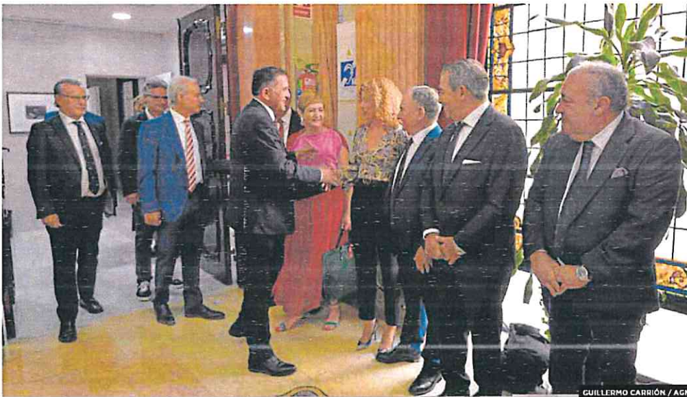
GUILLERMO CARRIÓN / AGN

► Paradas informativas accesibles para el transporte urbano municipal y digitalización. Inversión: 6 millones de euros.