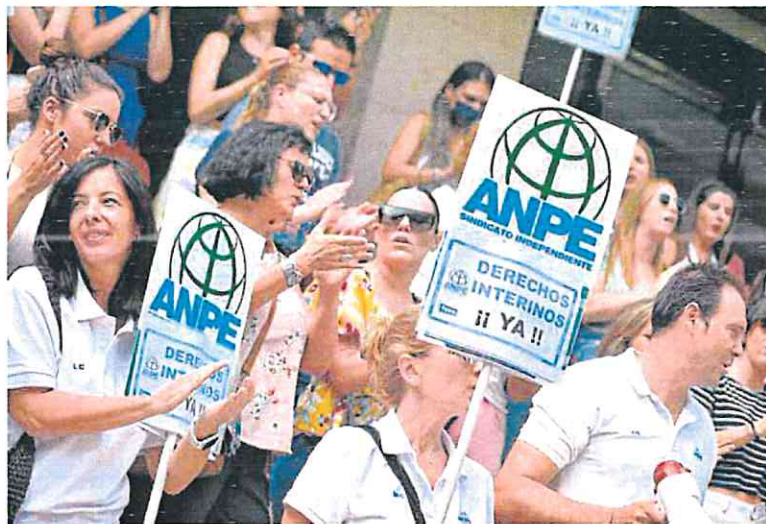
Participantes en la concentración de Anpe, ayer, ante la puerta de la Consejería de Educación.

Anpe denunció que «hay centros en diversas localidades que aún no tienen a todos los profesores en sus aulas desde que empezó el curso escolar, hace 17 días, lo que supone problemas organizativos en los centros, alumnos sin profesores, imposibilidad de poder avanzar en los contenidos del curso». Asegura que con ello la Consejería consigue ahorrar-se 270.000 euros, por lo que exige una mayor inversión en la escuela pública.