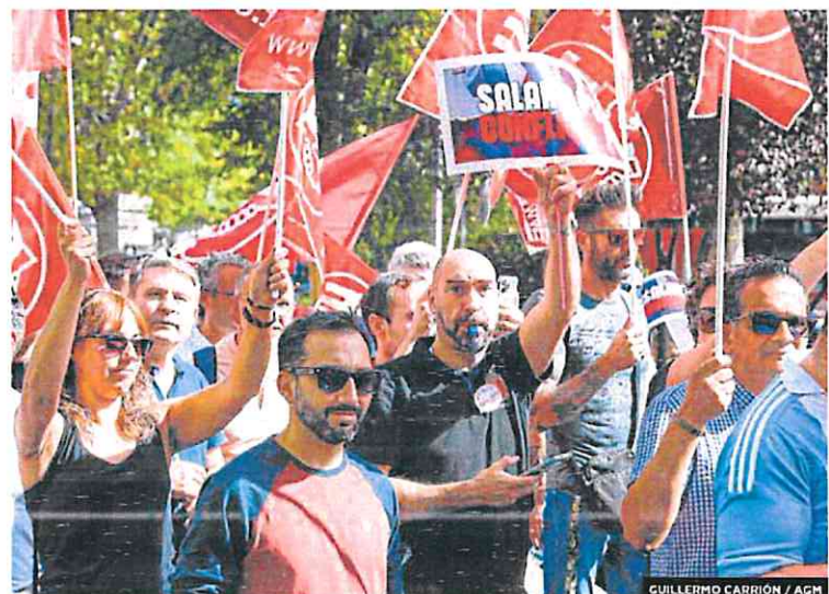
GUILLERMO CARRIÓN / AGN

La seguridad privada lleva sus protestas a la calle