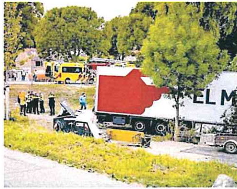
El accidente se cobró la vida de seis personas.