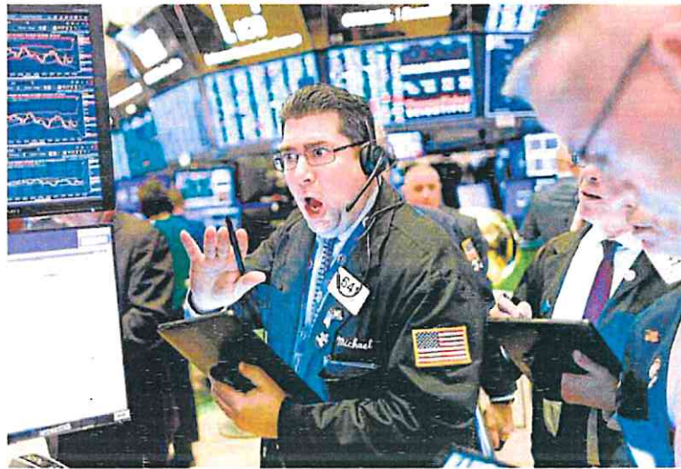
Un agente bursátil de Wall Street reacciona ante las cotizaciones del parque.

Hay que retroceder a noviembre de 2020 para ver mínimos de cierre similares. Por aquel entonces los mercados apenas habían empezado a curarse las duras heridas provocadas por la pandemia, justo antes de la remontada que llegó con el anuncio de la llegada