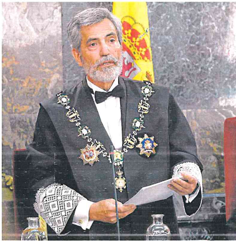
Carlos Lesmes, en su discurso de apertura del año judicial el 7 de septiembre.

Se trata de un documento elaborado por el Gabinete Técnico del Consejo que incide en las consecuencias de su salida por el fracaso en las negociaciones para renovar el órgano constitucional, en funciones desde diciembre de 2018. Esta situación supone una «anomalía democrática», según denunció el propio Lesmes en el acto de apertura del año judicial, que está teniendo «graves consecuencias» en el funcionamiento mismo del Tribunal Supremo, debido a la imposibilidad de cubrir las plazas vacantes (un 20% del total) por la ley impulsada por el