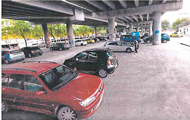
El aparcamiento debajo de la autovía en Barriomar desaparecerá a partir del lunes.

Pese a todo, Hernández explicó que el Consistorio murciano había seguido una estrategia a la hora de presentarla que podía ayudar a entrar: «Hemos optado por proyectos que convergen con los que ya están en curso, que obtienen más puntuación; espere-mos que cuente».