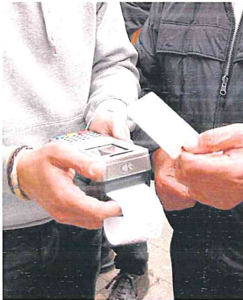
Un cliente paga con una tarjeta de crédito. JESÚS ANDRADE

cos suelen elevar los costes de financiación aprovechando la campaña de compras de verano.