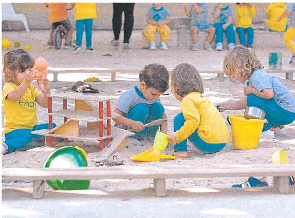
Un grupo de niños de una escuela infantil de Murcia, en una imagen de archivo.

Esta tercera línea, la que transforma las plazas de los CAI y PAI gestionados por empresas concesionarias en públicas y gratuitas, debe ser la que empiece a ofrecer puestos este curso (unos 800 este año académico), pero hasta la fecha no ha terminado de arrancar en ningún municipio de la Región. Las plazas ya están en marcha, pero las gestionan en su mayoría empresas adjudicatarias y, aunque en algunos casos las familias reciben ayudas municipales, no se trata de plazas públicas. La reconversión implica que los puestos