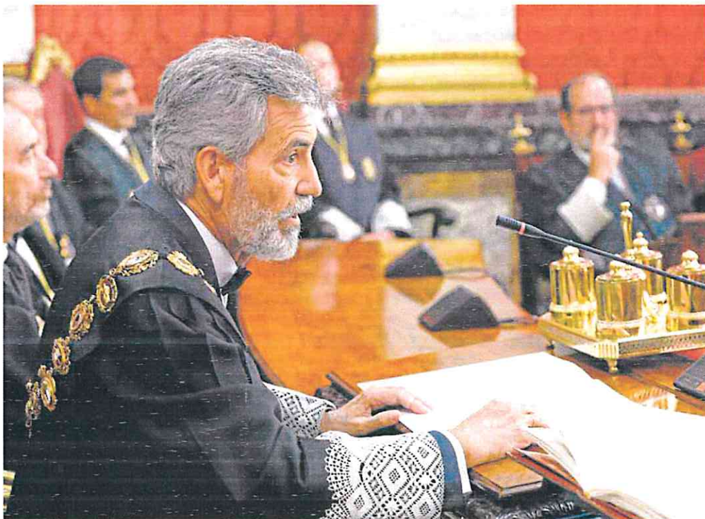
Carlos Lesmes, a principios de mes, en la toma de posesión del nuevo fiscal general del Estado, Álvaro García Ortiz.

Pero antes de resolver esta discrepancia el próximo jueves, fecha prevista para celebrarse el Pleno del CGPJ, en el que Lesmes escuchará también las quejas de vo-