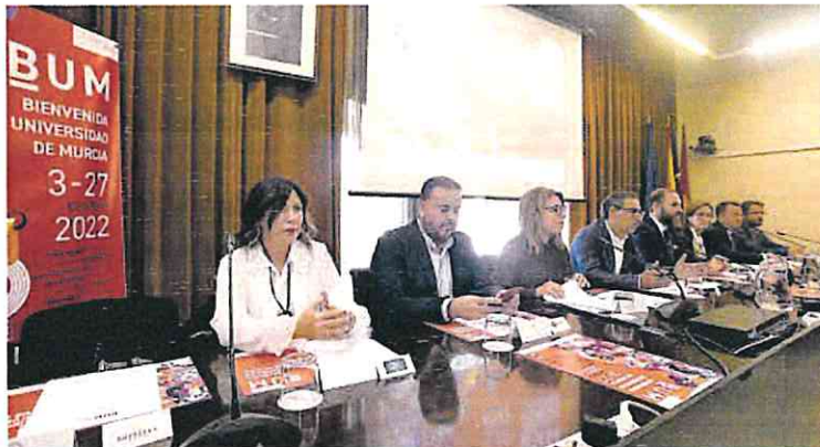
La UMU, junto con los patrocinadores, presentaron ayer las actividades organizadas.