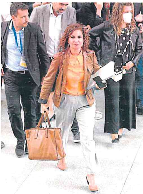
La ministra María Jesús Montero, ayer, a su salida del Congreso.

En la actualidad, solo las comunidades que mantienen una au-