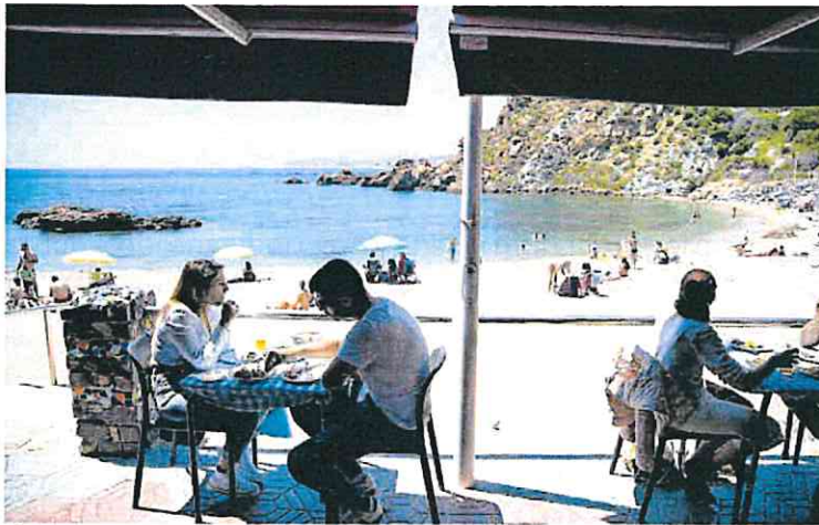
Clientes de un chiringuito en una playa de Cartagena.