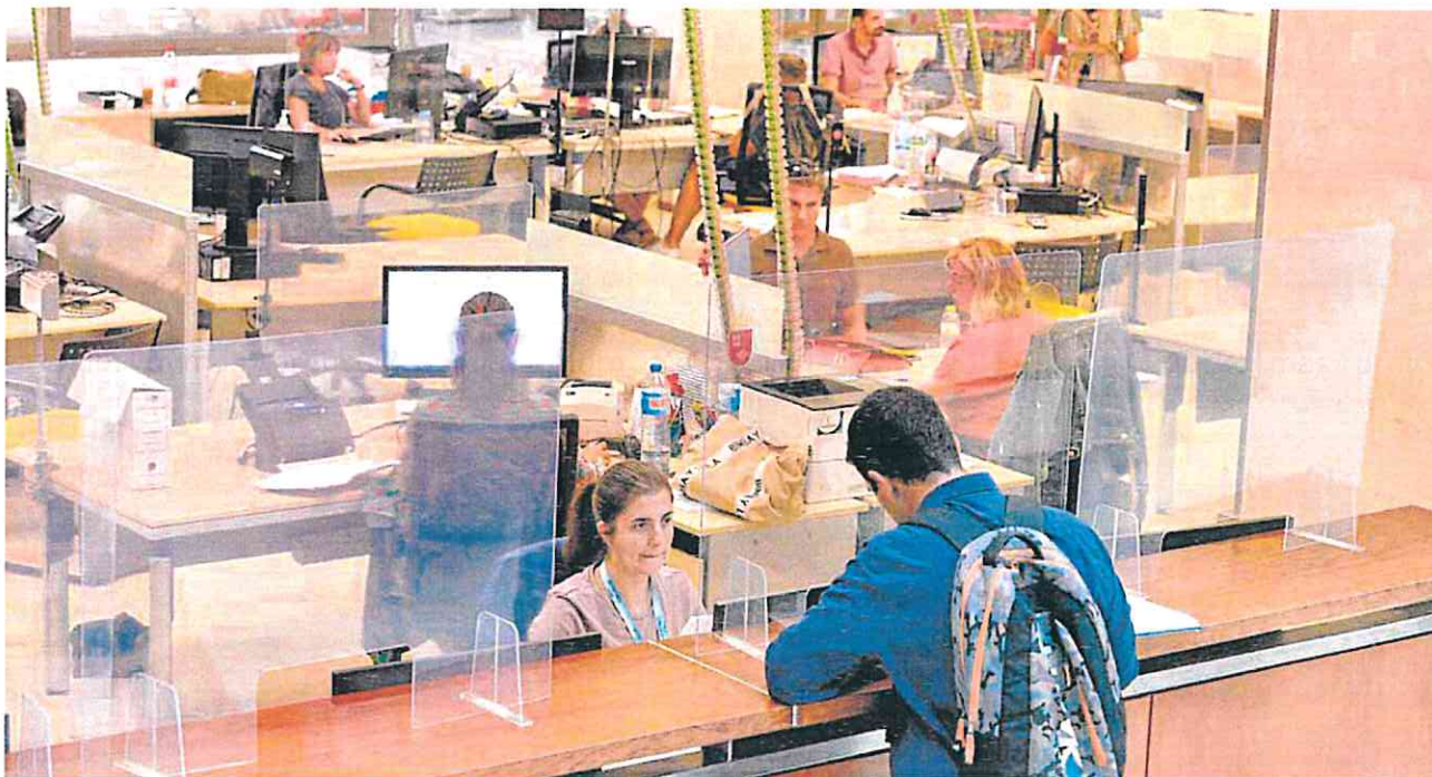
Empleados de la Agencia Tributaria de la Región, ayer, en la sede de la Consejería de Economía y Hacienda.