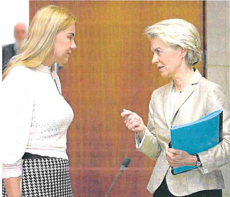
La comisaria de Energía, Kadri Simson, charla ayer con la presidenta de la CE, Ursula von der Leyen.

El debate de los ministros de Energía europeos se centrará también en el límite a los beneficios de las energías inframarginales (la nuclear y el gas) y en el 'impuesto de solidaridad' a las compañías de combustibles fósiles. La idea es que esos ingresos se utilicen para proteger a los consumidores y a las empresas más vulnerables ante la crisis energética. La propuesta de Bruselas deberá contar con el visto bueno de los Veintisiete para poder aplicarse.