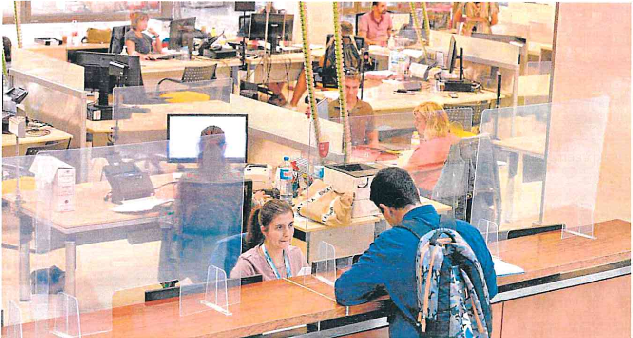
Empleados de la Agencia Tributaria de la Región, ayer, en la sede de la Consejería de Economía y Hacienda. VICENTE VICENS / AGM