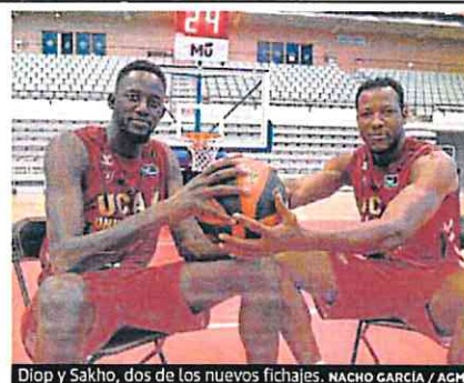
Diop y Sakho, dos de los nuevos fichajes.

Los murcianos, con ocho caras nuevas, reciben al Breogán (21.30 horas) en un inicio de temporada con tres partidos en solo cinco días P38-39