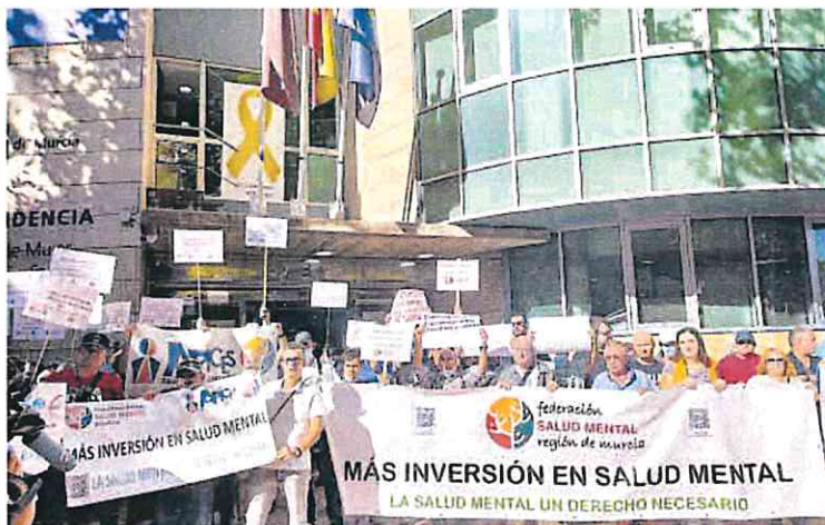
Concentración ayer a las puertas de la Consejería de Política Social, en Murcia.

Además, indican que en otro encuentro celebrado en mayo la Consejería acordó con la Federación de Salud Mental aumentar el