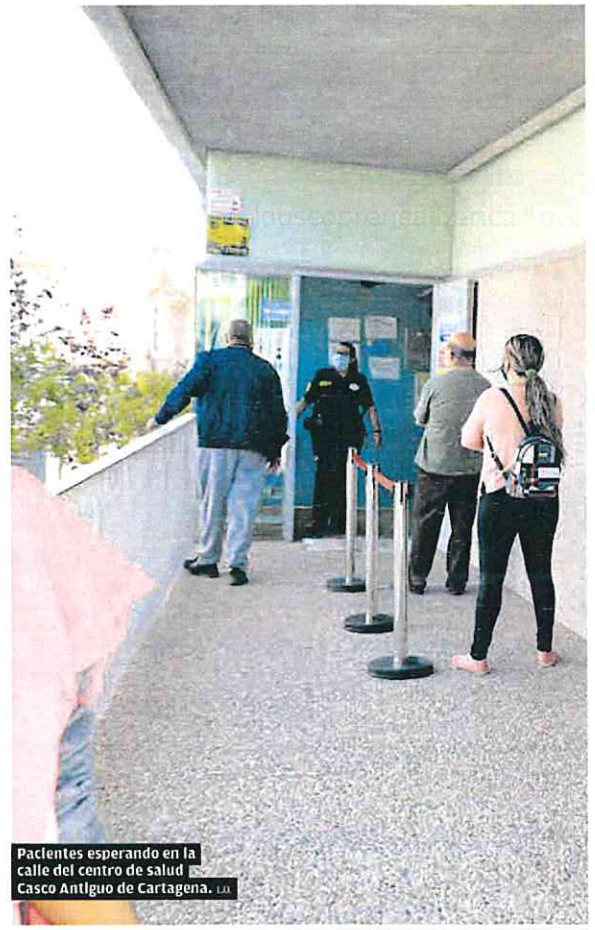
Pacientes esperando en la calle del centro de salud del Casco Antiguo de Cartagena.