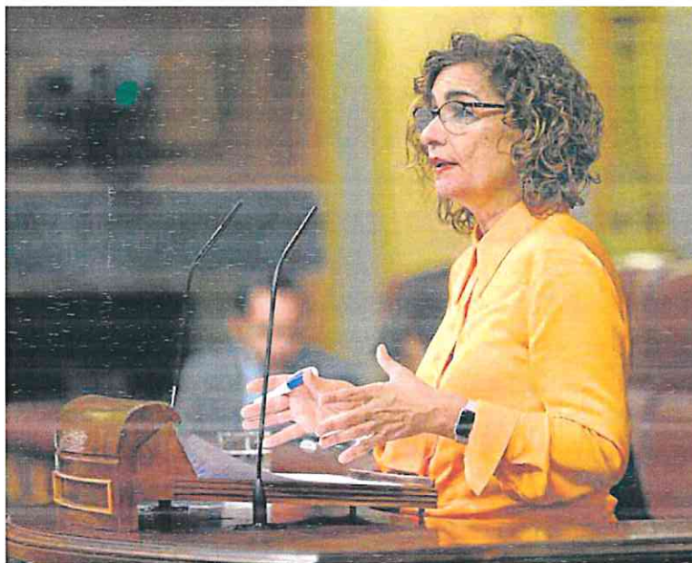
La ministra de Hacienda, María Jesús Montero, ayer en el Congreso.

OCDE, el BCE y el Fondo Monetario. «Se desaconsejan bajadas masivas de impuestos, se aconseja que sean quirúrgicas, que se proteja a la población más vulnerable y que los que más tienen aporten más», remarcó Montero. La deflacción del IRPF no encajaría, admiten sin ambages fuentes gubernamentales, en ese criterio por más que la Generalitat valenciana insista en que su medida solo afectará a las rentas por debajo de 60.000 euros.