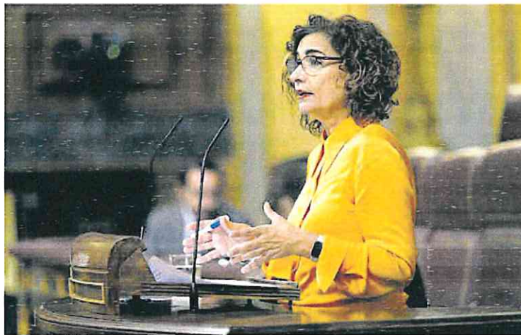
La ministra de Hacienda, María Jesús Montero, interviene en el Congreso este miércoles.

Las organizaciones representadas en la mesa de negociación habían planteado subidas de entre el 4,5% y del 5,5% para el próximo año, aunque daban por hecho que la oferta del Ministerio se quedaría por debajo. Tal y como adelantó La