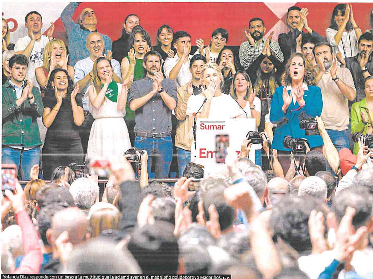
Yolanda Díaz responde con un beso a la multitud que la aclamó ayer en el madrileño polideportivo Magariños.