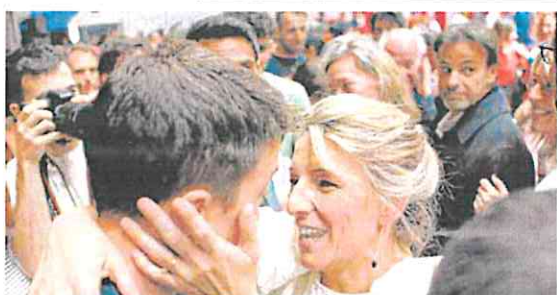
La promotora de Sumar abraza al líder de Más País, Íñigo Errejón.