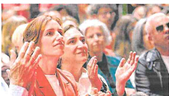
Mónica García y Ada Colau, junto al televisivo Jorge Javier Vázquez.