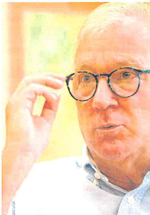
El expresidente Ramón Luis Valcárcel.

«Nunca llegó ningún informe desfavorable al seno del Consejo de Gobierno hasta noviembre de 2015, es decir cuando hacía año y medio que yo estaba en Bruselas y en el Parlamento Europeo». Valcárcel insiste en varios momentos de la conversación en este dato porque entiende que difícilmente pudo ser receptor de informe desfavorable alguno mientras ejerció la presidencia de la Comunidad Autónoma. Es más, vuelve a incidir al respecto en la normativa vigente, por la que los servicios jurídicos son los encargados de alertar sobre cualquier irregularidad que se detecte en cualquier expediente ad-