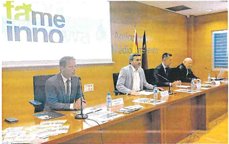
Presentación del encuentro Fame Innova de este año 2023.

El titular de Agricultura recordó que recientemente el Gobierno regional ha lanzado diversas líneas de ayudas como la de 15 millones para impulsar la innovación en el sector agroalimentario, los 1,1 millones destinados a aplicación de agricultura de precisión y tecnología 4.0 en los sectores agrícolas y ganaderos, los 6,6 millones para modernización de invernaderos, así como los 5,6 millones de euros para los próximos cuatro años destinadas a impulsar la innovación en el sector a través de los Grupos Operativos.