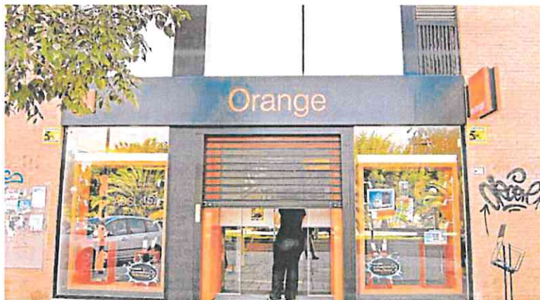
Una tienda de telefonía de Orange.

Orange y MásMóvil anunciaron sus planes de fusión en julio de 2022. Lo hicieron a través de una 'joint venture' al 50%, valorada en 18.600 millones de euros y se lo notificaron oficialmente a Bruselas el pasado 13 de febrero.