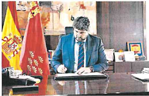
▶ 28M. Fernando López Miras firmó ayer el decreto de convocatoria de elecciones autonómicas, que se celebrarán el 28 de mayo. La campaña electoral comenzará a las 0 horas del 12 de mayo y acabará a las 24 horas del 26 de mayo. La sesión constitutiva de la Asamblea electa tendrá lugar el 14 de junio.