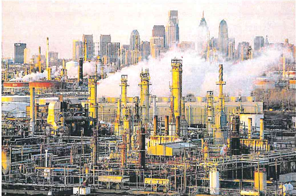
Una refinería de petróleo propiedad de The Carlyle Group, en Filadelfia (EE UU).