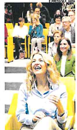
Yolanda Díaz, el domingo pasado.

Ya con los resultados electorales de las elecciones autonómicas y municipales del 28 de mayo sobre la mesa, será el momento de empezar las negociaciones serias de cara a los comicios nacionales. Este será el verdadero reto de la política gallega. Podemos ya ha dejado claro que creen merecer un puesto privilegiado y que, ante aquellos que dudan de esto, lo mejor es celebrar unas primarias abierta a toda la ciudadanía. Díaz se ha negado a pactar con ellos este punto. Pero el resto de formaciones también querrán tener un espacio propio y la líder de Sumar tendrá que hacer encaje de bolillos para contentar a 15 partidos distintos.