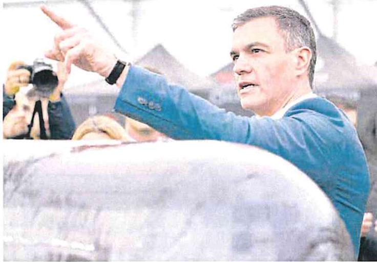
El presidente del Gobierno, ayer en el aeropuerto de Albacete.

Pero en la Moncloa intentan rebajar el choque. Los colaboradores del presidente admiten, por ejemplo, sus profundas discrepancias con el real decreto que Meloni im-