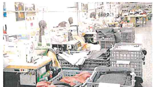
Empleados trabajan en una fábrica del mueble. A. A.

«Este acuerdo es el resultado de un gran esfuerzo por ambas partes», aseguran sindicatos y patronal. Durante muchas horas, los representantes de los traba-