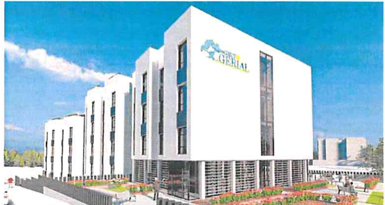
Recreación digital de la futura residencia de mayores de Águilas.