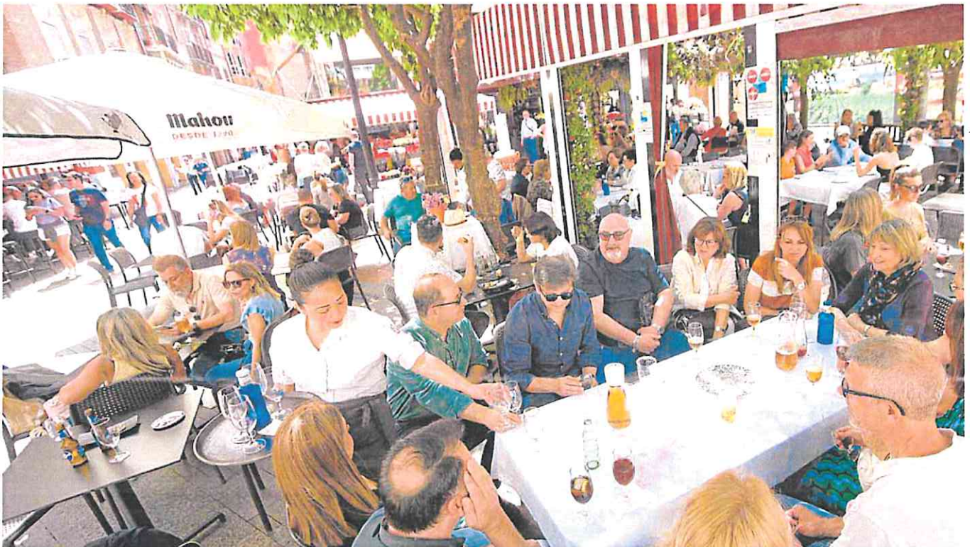
Terrazas repletas de clientes, ayer, en una céntrica plaza de Murcia.