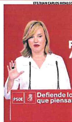
La portavoz del PSOE, Pilar Alegría.

«No evita los efectos indeseados», recaló Alegría sobre las enmiendas de sus socios en el Gobierno y en el Congreso, algo que los socialistas sí creen que hace su proposición de ley. La también ministra de Educación negó incluso que la postura de Podemos, ERC o Bildu, que ellos mismos definen como de una mayoría feminista, esté defen-