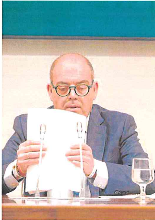
El presidente de ATA, Lorenzo Amor.

El 60,3% de los autónomos afirman que no han comunicado su previsión de ingresos y otro 22,5%, uno de cada cinco autónomos, aún anda muy desconcertado con la nueva cotización