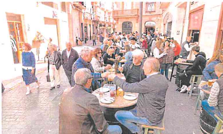
Aspecto que presentaban el Viernes Santo dos bares del casco antiguo de Cartagena.

El regidor destacó que el servicio municipal de Emergencias realizó 47 intervenciones, y añadió que se ha experimentado un incremento del 40% en el número de atenciones sanitarias con respecto al año anterior y que ninguna de ellas fue de gravedad.