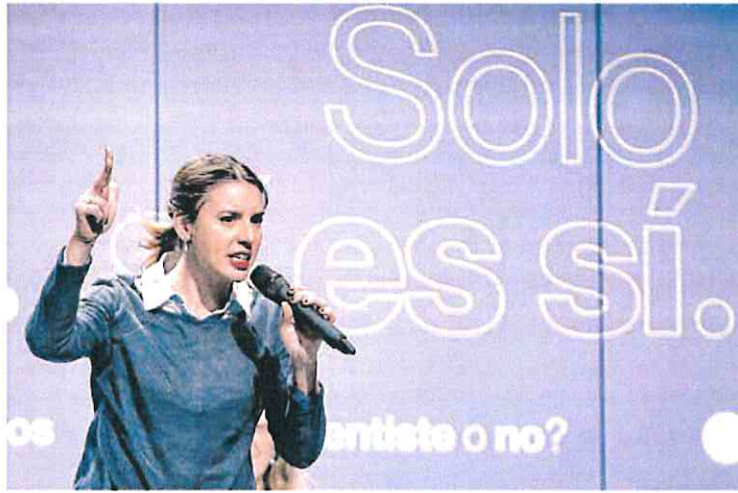
La ministra de Igualdad, Irene Montero.

La número tres del Ministerio de Igualdad reconoció que las diferencias «técnicas» con el PSOE «no son de gran calado pero sí tienen mucha incidencia en el sistema» porque, a juicio de Podemos, la reforma planteada por el PSOE supone volver al «Código Penal de La Manada», con dos tipos de delitos sexuales en función