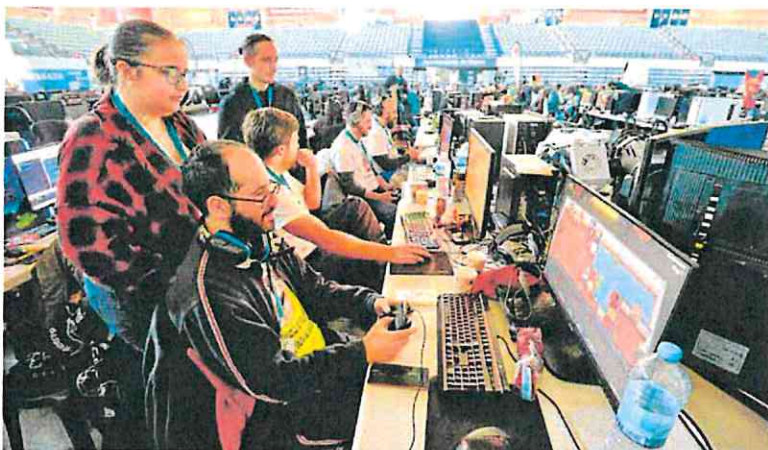
Participantes en la concentración, en el Palacio de Deportes de la capital.

La UMU ha captado algo más de 1,5 millones, según la institución docente. El proyecto que ha recibido la mayor financiación, casi 400.000 euros, se refiere al secado de productos vegetales mediante energías renovables. Otras de las acciones tienen que ver con la óptica, la ganadería y la biotecnología.