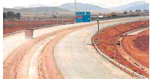
Estado que presenta un tramo en obras de la autovía.

La respuesta del Ministerio de Transportes y Movilidad Sostenible a la consulta de LA VERDAD es que las obras «avanzan a rit-