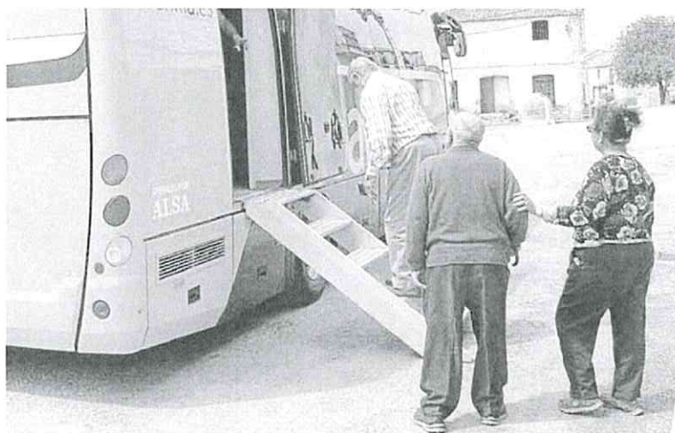
Varios usuarios de banca utilizan un 'ofibús' en un pueblo de Castilla y León, r. c.

«Comisiones Obreras y UGT han rechazado estas modificaciones, ya que el mantenimiento de las garantías y derechos es una línea roja para nuestras organizaciones (...) La empresa dispone de mecanismos suficientes para garantizar la empleabilidad en las provincias. Por ello, se debe apostar por mecanismos como las nuevas formas de trabajo o la deslocalización de actividad frente a los movimientos forzados anteriormente mencionados», argumentan ambas centrales sindicales.