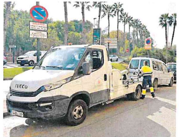
La grúa, ayer, interviniendo en la zona de zona de carga y descarga ubicada en