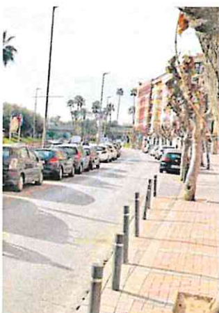
la calle Pintor Sobejano.

«Ni la Consejería ni el Ayuntamiento han llevado a cabo la más mínima acción para asegurar la conservación de este patrimonio de la huerta, pese a las denuncias interpuestas en 2016 y 2020», concluyeron.