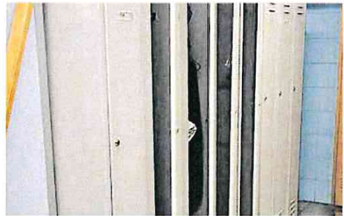
Taquillas forzadas de uno de los vestuarios del hospital.

Sin embargo, en la mayoría de casos, el responsable de los robos ha actuado sin ser visto. En