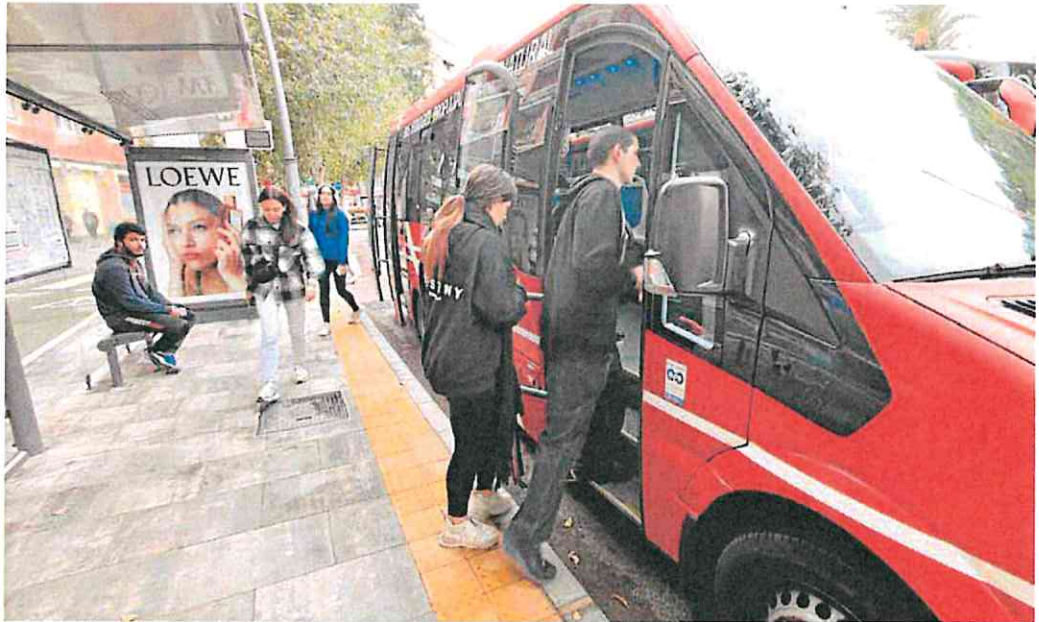
Varios jóvenes hacen uso del transporte público durante el periodo de gratuidad, tomando un autobús urbano en la plaza Circular.

Precisa, además, el concejal que en estos primeros días de funcionamiento de la medida se han dispensado 5.500 nuevas tarjetas del bono tricolor, sumando ya la colocación en la calle de una cifra superior a las 240.000 desde su implantación, aunque se aspira a que este incremento de movimientos lleven la cifra total