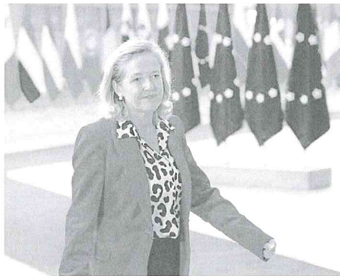
La vicepresidenta económica, Nadia Calviño, a su llegada ayer a la reunión del Eurogrupo.

Los ministros son conscientes de la urgencia por lograr un acuerdo en torno a las reglas fiscales que volverán a aplicarse en 2024 tras dos años suspendidas por la pandemia y la guerra en Ucrania. Tanto la Comisión Europea como el Banco Central Europeo (BCE) han llamado en numerosas ocasiones a cerrar un pacto «cuanto antes» para dar certidumbre y garantizar una senda de reducción de la deuda y el déficit públicos tras varios años de gasto récord en los estados por las medidas anticrisis.