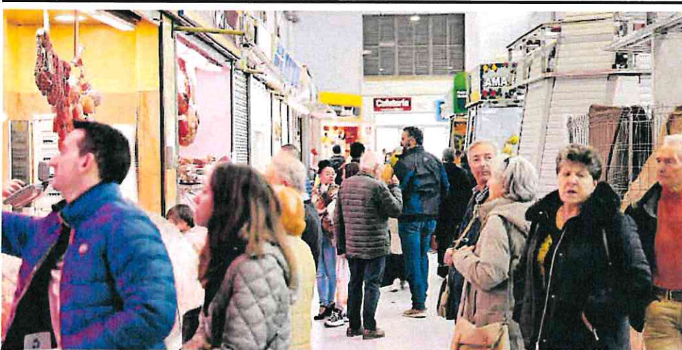
El Mercado de Santa Florentina estaba ayer lleno de vida.

Sin embargo, desde la Autoridad Portuaria no solo niegan que exista ninguna ralentización, sino que afirman que los proyectos siguen adelante y se están «cumpliendo plazos». Fuentes de la APC afirman desconocer «en qué se basan» desde el Partido Cantonal para hacer estas afirmaciones.