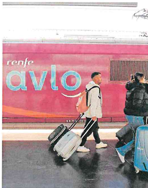
Un tren de Avlo, en la estación de Alicante.

La hora de salida desde la estación de Murcia se producirá diariamente a las 10.32 horas.