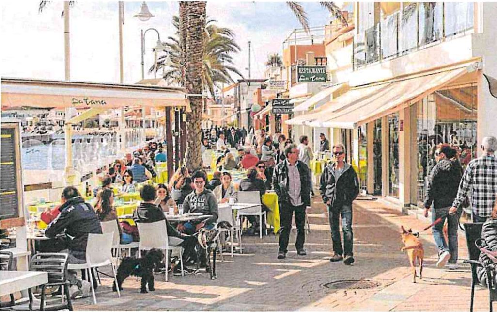
Ambiente, sol y numerosos clientes, ayer, en terrazas de restaurantes de Cabo de Palos.