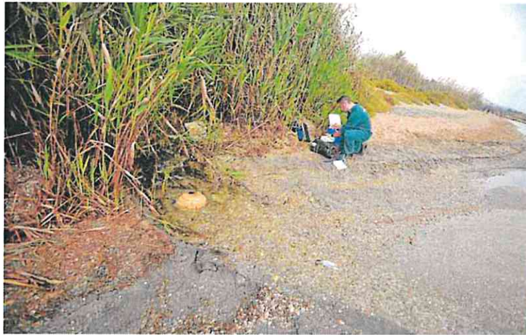
Un agente del Seprona toma muestras de vertidos junto a la rambla del Albuñón.

ción de los daños causados a la laguna ha resultado ser complejo. La Consejería de Medio Ambiente ha optado por aplicar «una medida teórica de reparación», según los informes internos que justifican las sanciones. La multa se