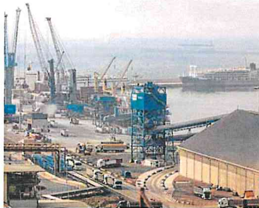
Camiones trabajando en la descarga de un buque y, al fondo, el muelle suroeste de Escombreras, que será ampliado.