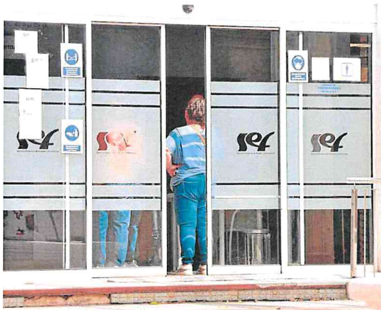
Ciudadanos en la oficina del SEPE de Barrionar, en Murcia.

Si se eleva la cuantía hasta los 570 euros al mes y se extiende a tres nuevos colectivos, al mismo tiempo que se mantiene la duración actual de un máximo de 30 meses. El problema es que esta mejora económica, que puede implicar hasta 900 euros más que