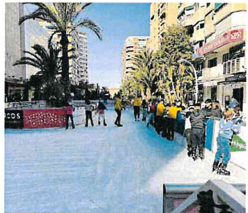
Pista de hielo en la avenida de la Libertad de Murcia.