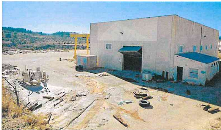
Nave alquilada por los supuestos narcos para almacenar la cocaína, en Cehegín.

Una semana después del registro —la operación explotó el pasado día 11— en la nave aún se observa cómo los guardias civiles accedieron a las instalaciones. Primero rompieron el candado de la puerta corredera de la entrada; reventaron otro candado del portón de acceso al almacén, y arrancaron una verja que da acceso a las oficinas. En el suelo se aprecian, además, restos del mármol que transportaron hasta una empresa especializada del sector de la piedra cercana, donde sus empleados ayudaron a los guardias civiles a extraer la droga de los tres bloques de mármol.