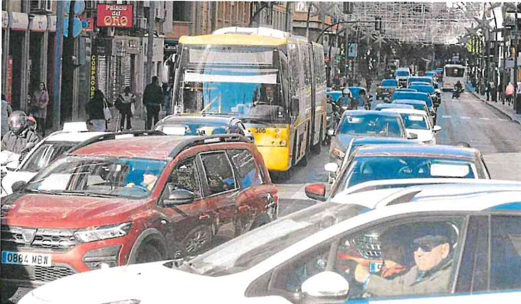
Colas de vehículos en la Gran Vía, donde el carril Bus-VAO ya se ha habilitado también para el tráfico privado.