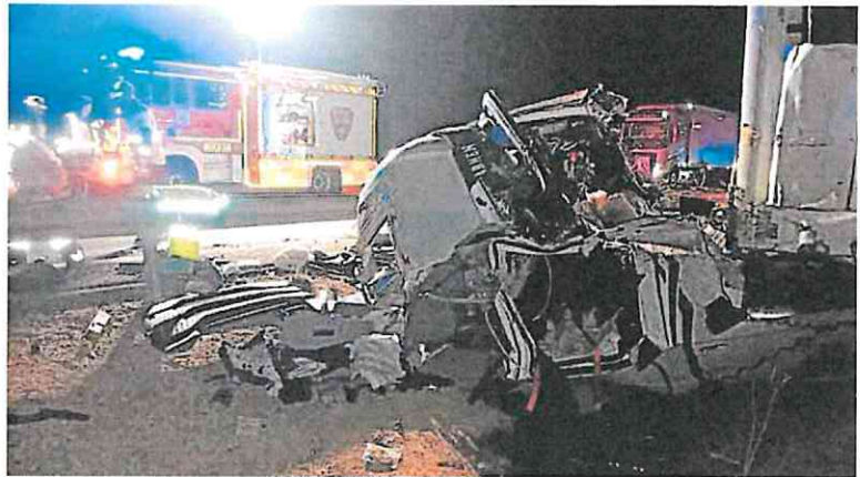
Estado en que quedó el vehículo en el que viajaba el camionero fallecido.

La Policía Nacional comprobó que la puerta de acceso al establecimiento estaba forzada, tenía el marco apalancado y el bulón de la cerradura fuera de la ranura. Al inspeccionar el vehículo en el que tenían intención de escapar, encontraron diversas herramientas que podrían ser utilizadas para la comisión de estos delitos y tres dispositivos electrónicos que no pudieron justificar su origen.