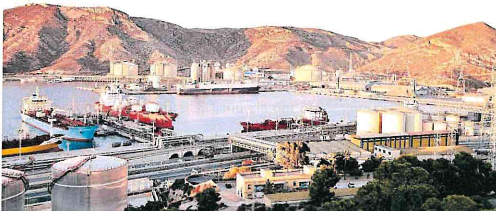
La nueva terminal para el embarque de ganado vivo estará ubicada en el puerto de Escombreras.