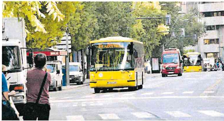
Autobús de pedanías circulando por la Gran Vía de Murcia.

Según ha podido saber esta Redacción, antes de que se formalice la huelga, los representantes laborales de los conductores acudirán el próximo viernes a la Oficina de Mediación y Arbitraje Laboral (OMAL)