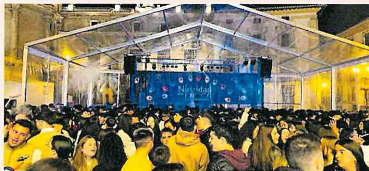
Aspecto que presentaba la plaza de España en Nochebuena.