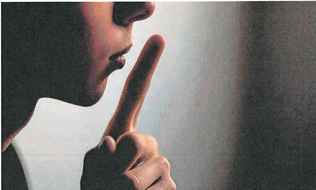
Un adolescente amenaza a su pareja con un gesto habitual en violencia machista de control. P. V.

El resultado del paso atrás, al que no son ajenos el miedo, el desamparo, la dependencia o la falta de apoyo familiar que sufren las víctimas, permitió que el 85% de los procesos de los que se retiró la maltratada terminasen sobreesfuerzos, con el agresor libre de cargos y sin control alguno.