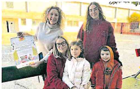
La edil de Mujer visita uno de los talleres en el colegio de San Fernando.

En concreto, 'Divirtiéndose en Igualdad' se desarrolla en centros educativos y otros espacios del municipio entre las siete y cuarto de la mañana y las tres y cuarto de