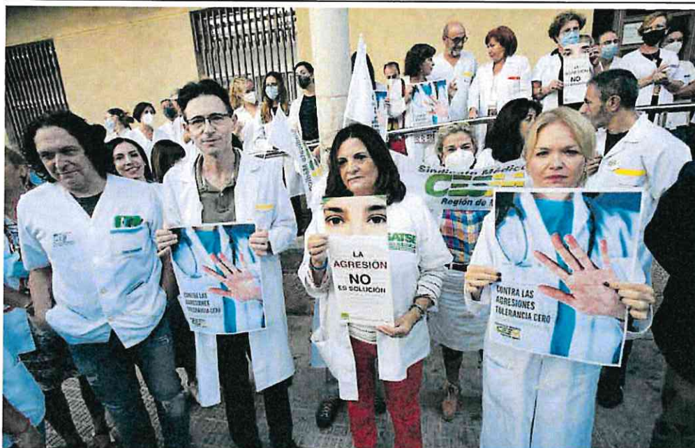
Protesta de personal sanitario a las puertas del centro de salud de San Andrés de Murcia ante una agresión, el pasado año.