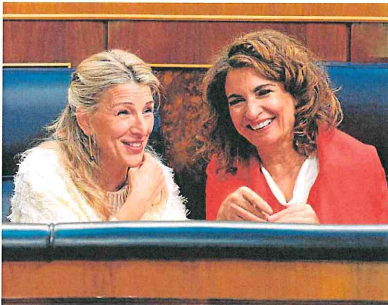
Las vicepresidentas Yolanda Díaz y María Jesús Montero, en el Congreso de los Diputados.

Actualmente, los hogares españoles se benefician de la bajada del IVA al 5% en sus recibos. Y al menos hasta el 31 de diciembre se aplica también la rebaja del Impuesto Especial sobre la Electricidad al 0,5%, así como la suspensión del impuesto sobre el valor de la producción de la electricidad. El Banco de España calcula que esas rebajas implican una pérdida recaudatoria de unos 3.000 millones de euros anuales. Pero, al mismo tiempo, devolver los impuestos a su tarifa normal (21% de IVA y 6,18% el tipo real del Impuesto Especial de la Electricidad) tendría un impacto negativo en la inflación, aunque facilitaría la reducción del déficit público con el regreso de las re-