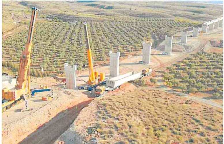
Montaje del viaducto sobre la rambla del Maltés, en el término de Nijar, en la línea de AVE Murcia-Almería. R. I.

El contrato, que incluye el mantenimiento de los sistemas y equipos durante cuatro años,