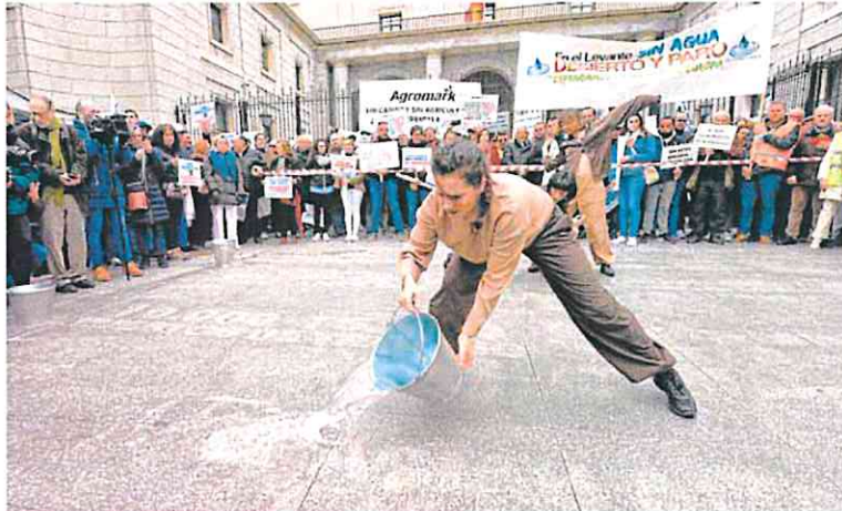
La 'performance' sobre la escasez de agua en el Levante realizada por la consultora BIA3.