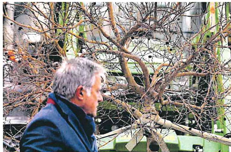
Un limonero seco, símbolo de un Levante sin trasvase, en la concentración. DAVID CASTRO