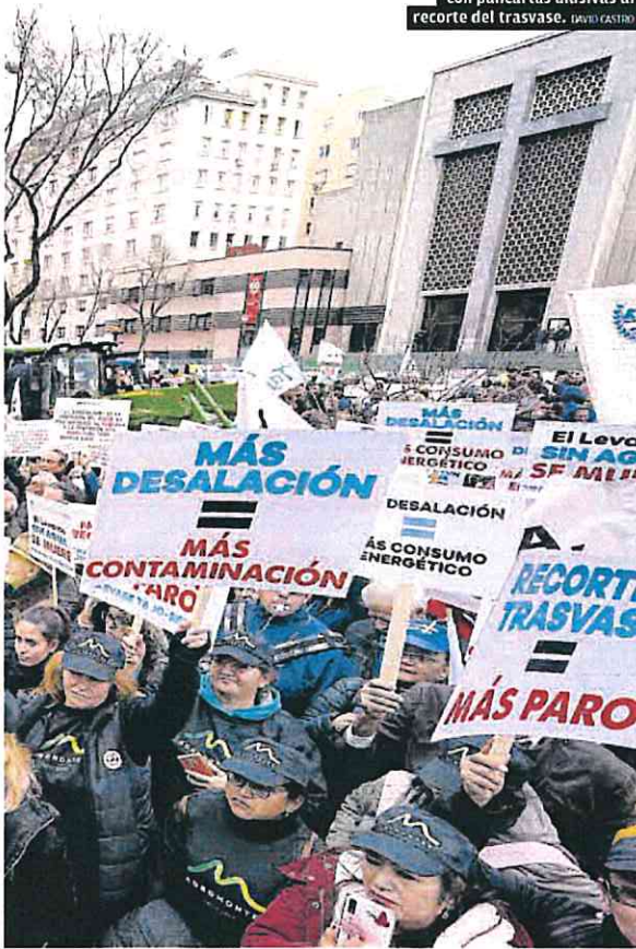
Miles de regantes protestaron con pancartas alusivas al recorte del trasvase. DAVID CASTRO