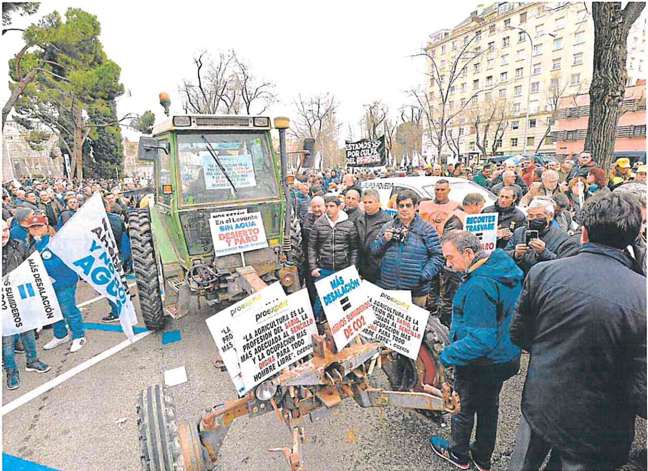
Miembros de las comunidades de regantes del Trasvase despliegan las pancartas durante la manifestación de ayer ante el Ministerio para la Transición Ecológica.