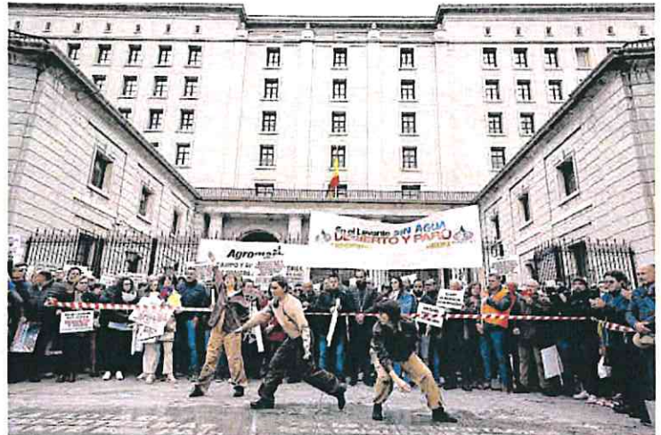
Tres artistas realizaron una performance ante las puertas del Ministerio. DAVID CASTRO