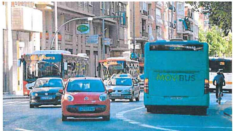
Autobuses a su paso por la Gran Vía de Murcia.