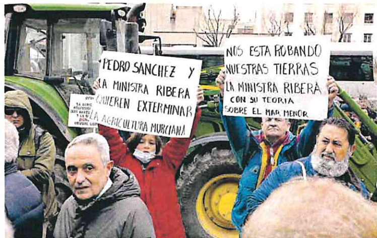
Los regantes exigieron la dimisión de la ministra Teresa Ribera.

Los regantes advierten de que, por cada metro cúbico que se suba el Alto Tajo, se recortarán 32 hm 3 al año al Segura