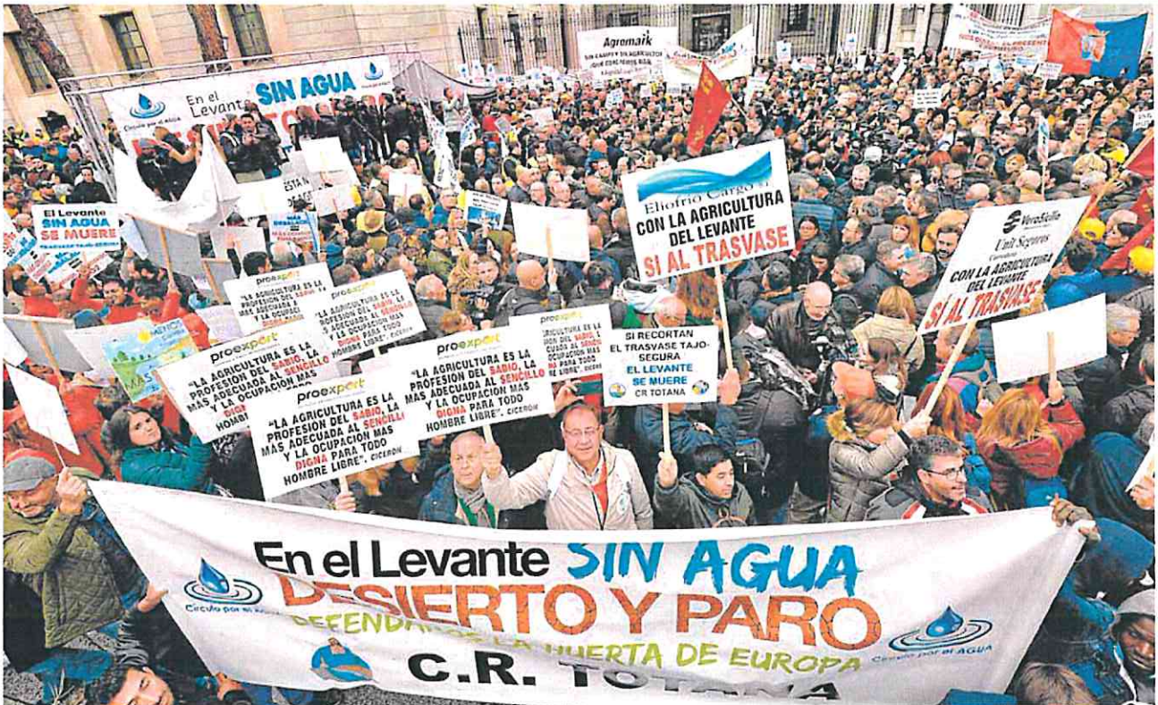
Numerosas pancartas en contra del recorte del Trasvase y a favor de la Huerta de Europa, ante las puertas del Ministerio.