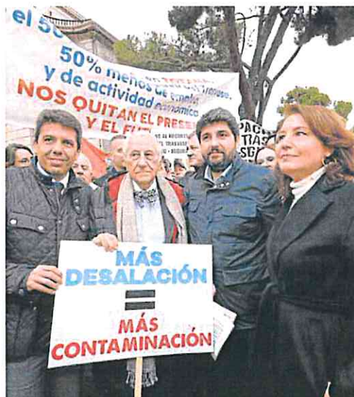
Carlos Mazón, Inocencio Arias, López Miras y Carmen Crespo. v. v.

3 Un año electoral. Con las citas electorales como telón de fondo, hubo una elevada presencia de políticos de las tres comunidades autónomas receptoras del Trasvase, pertenecientes a casi todos los partidos políticos, además del líder nacional de Vox, Santiago Abascal. El rechazo al recorte del Trasvase los unió ayer ante el Ministerio.