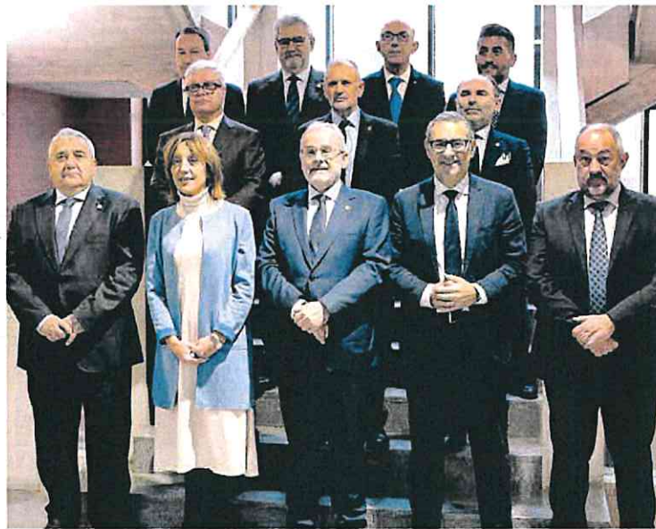
Foto de familia con los rectores de las universidades que conforman el G-9 en España.

Además, el G9 ha aprobado un convenio para que los cursos de extensión universitaria que se realicen en una universidad sean reconocidas por las demás del grupo y ha avanzado en un borrador para la movilidad del personal de administración y servicios. Por último, el rector de la Universidad de Extremadura se ha despedido de sus compañeros tras desear al grupo «todos los parabienes».