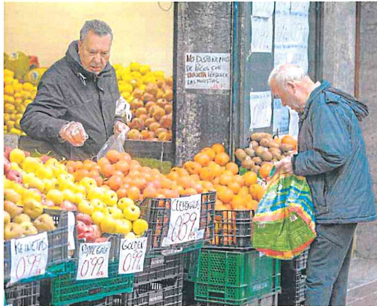
Un hombre hace la compra en una frutería.

En términos absolutos, los hogares pasaron de contar con 1.899 billones de euros a finales de junio a 1.858 billones a cierre de septiembre. Esta vez el ritmo de caída es mucho más abultado que el registrado en periodos anteriores. Y también engorda ese descenso en el acumulado