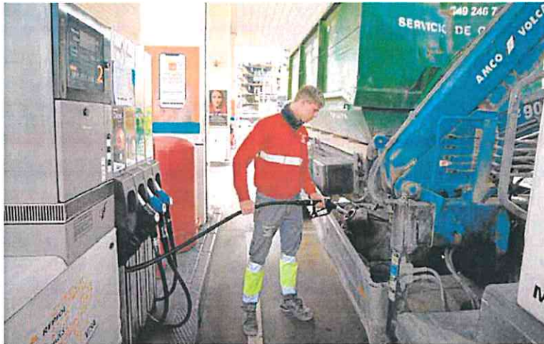
Un transportista reposta en su camión ayer en una estación de servicio de Murcia.

Un ahorro nada nimio, máximo cuando, advierte Baños, los vientos que corren no prevén bajadas de precios. Más bien todo lo contrario. Un diagnóstico que achaca a dos factores: el incremento del componente 'bio' en