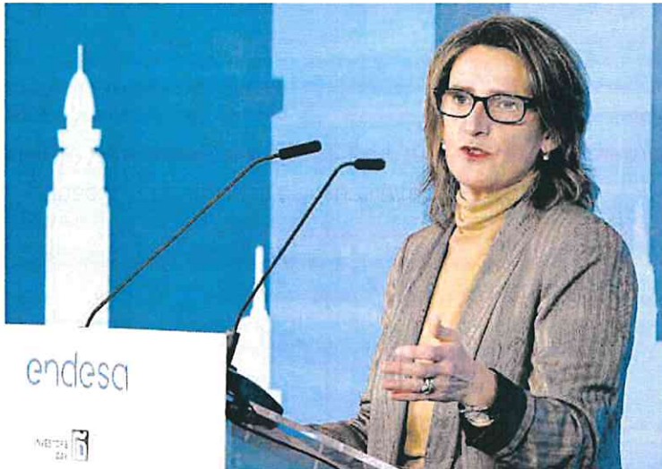
La ministra Teresa Ribera, ayer durante su intervención en la XII edición del Foro Spain Investors Day.