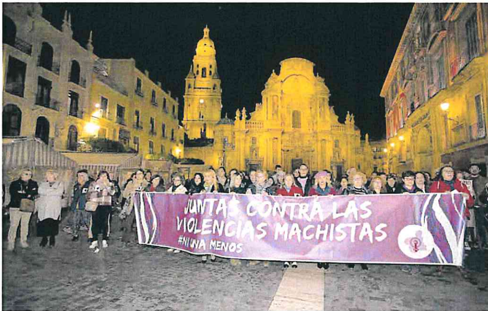
La Asamblea Feminista organiza una concentración de repulsa por los últimos crímenes