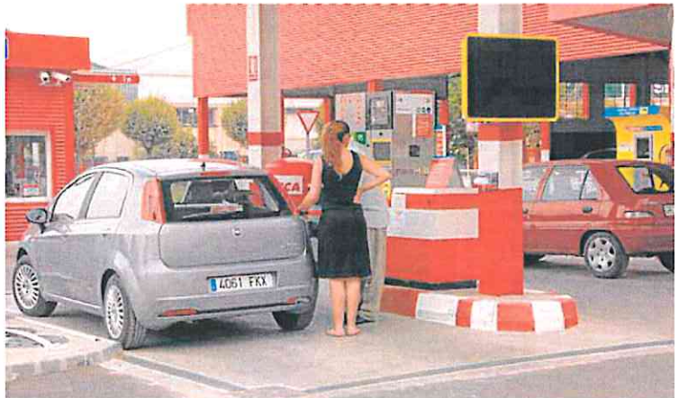
Una conductora reposta en una estación de servicio. JUAN ORTIZ

De igual manera, el secretario general de CC OO ve «prácticamente imposible» que el Gobierno llegue a un acuerdo en materia de pensiones con la CEOE, ya que los empresarios se niegan a cualquier incremento de sus costes laborales. Por el contrario, si tiene más fe en alcanzar un acuerdo Gobierno-sindicatos «en un tiempo no muy remoto», ya que desveló que está habiendo conversaciones informales y se han logrado «avances» en algunas materias, como lagunas, bases máximas, extensión del mecanismo de igualdad, aunque se niegan a negociar el periodo de cómputo.