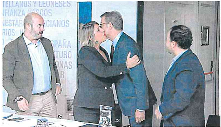
La alcaldesa de Cartagena saluda al presidente del PP al inicio de la reunión del comité de campaña. PP

José Ángel Antelo acusa a todos los partidos, excepto el suyo, de haber caído «bajo los tentáculos de la extrema izquierda»