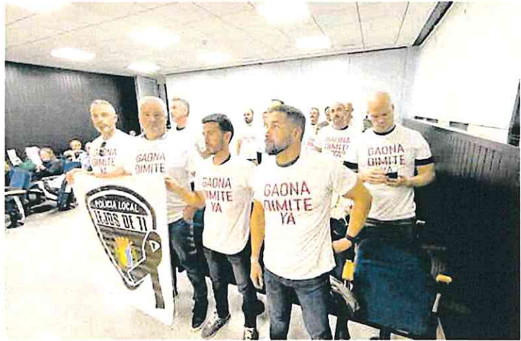
Varios agentes de Policía Local exhibieron en el pleno camisetas de 'Gaona, dímite ya'.

de la Policía ha sido vergonzosa», al llevar los agentes «prendas de vestir rotas o deterioradas». También denuncian «el abandono» de instalaciones policiales.