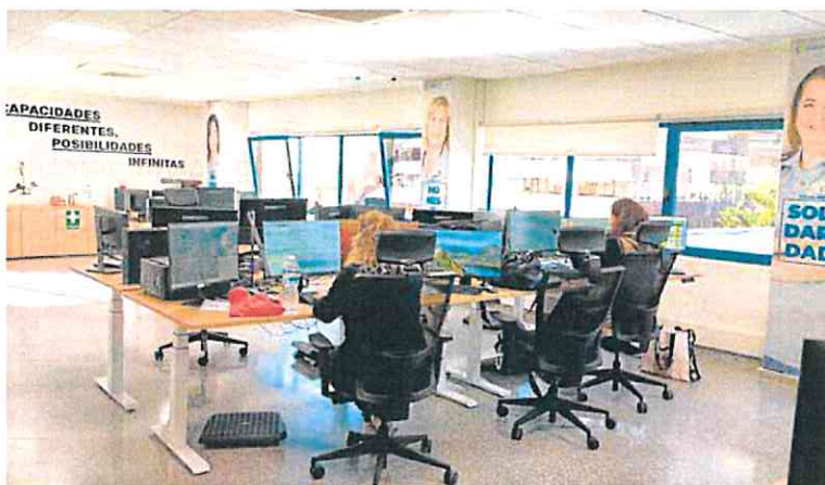
Trabajadores del 112 en las nuevas instalaciones ubicadas fuera del Centro de Coordinación de Emergencias. 112

Esta se hizo cargo de la atención telefónica del 112 en diciem-