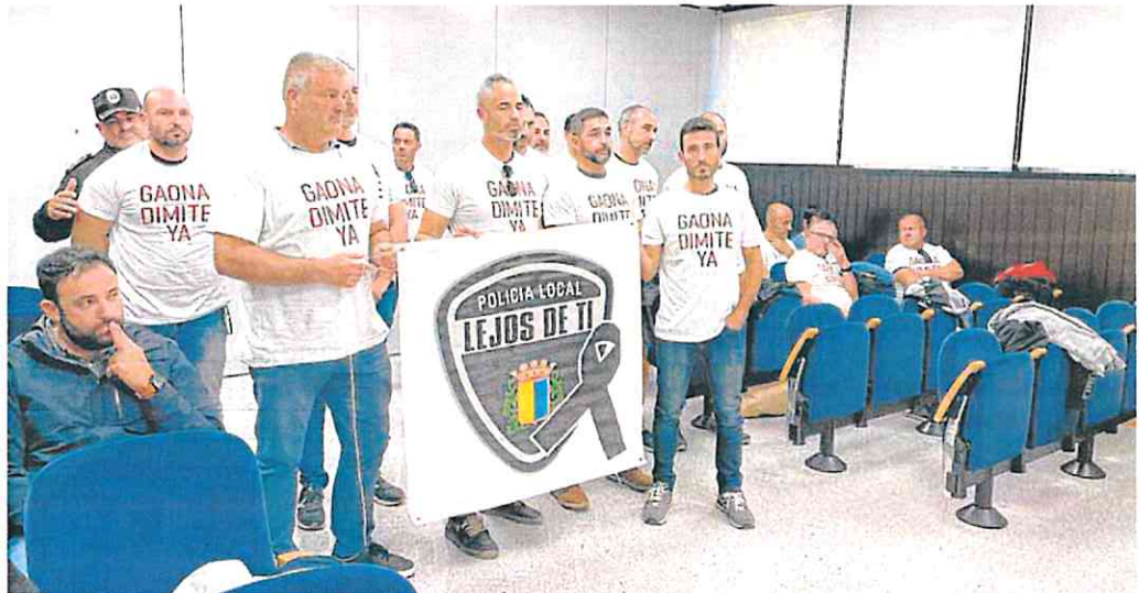
Los agentes con una pancarta reivindicativa de protesta en el Pleno municipal de San Pedro del Pinatar, ayer.

Algunas referencias históricas apuntan a que la Posada del Duque, llamada así porque se construyó a instancias de José María Álvarez de Toledo y Gonzaga, duque de Alba, se levantó en el último tercio del siglo XVIII. Con una superficie de 3.000 metros cuadrados, esta antigua casa de postas presenta una zona reservada para el alojamiento y la recepción de viajeros y otra ocupada por dependencias auxiliares. Como publicó LA VERDAD, el Ayuntamiento ha iniciado las gestiones para la municipalización del edificio, en manos privadas, con el fin ponerlo en valor.