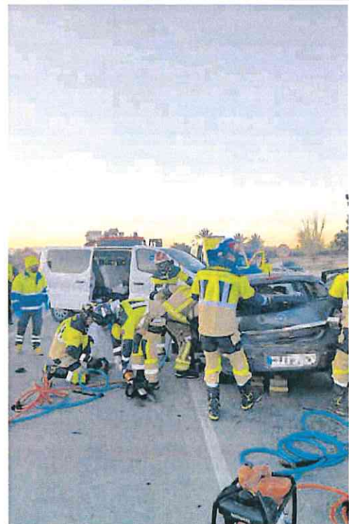
Bomberos trabajan en el lugar del accidente de Lorca.

El 112 indicó que el conductor perdió el control del automóvil, se estrelló y lo dejó ruedas arriba. Un vigilante de la zona llamó a Emergencias. El conductor estaba consciente y logró salir por sus propios medios del vehículo.