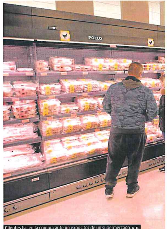
Clientes hacen la compra ante un expositor de un supermercado.

En este mismo periodo, los informes de coyuntura de precios de los alimentos elaborados por el Ministerio de Agricultura reflejan una gran fluctuación de costes, al alza en la primera quincena de enero y más a la baja en el segundo tramo del mes. Aunque esas cotizaciones no van directamente a la cesta de la compra.