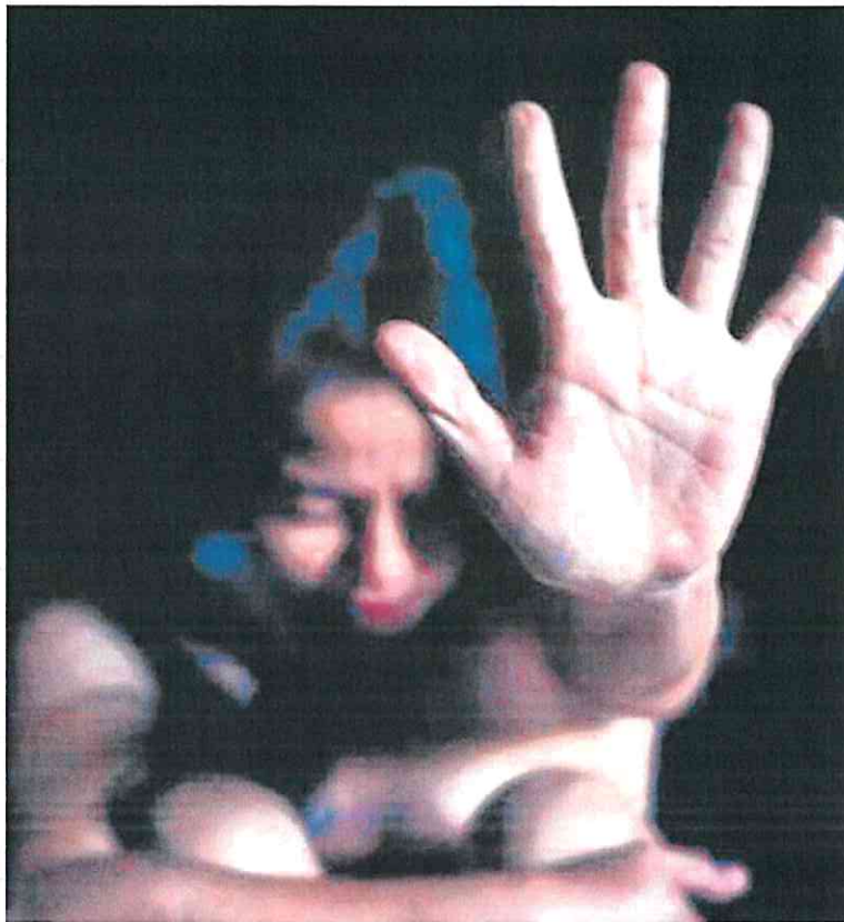
Nueve víctimas han visto cómo sus agresores veían rebajadas sus penas o peticiones de condenas.

Un suceso similar corrió un año después cuando un hombre de 35 años fue condenado a seis años y un día de cárcel por abusar de una menor de 15 años en un municipio de la Región, en marzo de 2019, aprovechando una obra que realizaba en su domicilio, a la que realizó tocamientos e intentó penetrar. Finalmente, la pena se quedó en su caso en cuatro años, seis meses y un día, tras la emisión de un auto el 19 de diciembre de 2022.