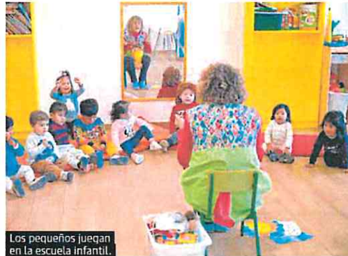
Los pequeños juegan en la escuela infantil.