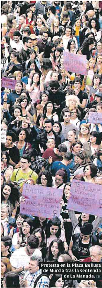
Protesta en la Plaza Belluga de Murcia tras la sentencia de La Manada.