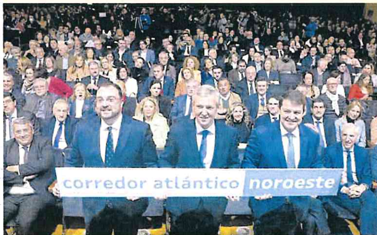
Los presidentes de Asturias, Galicia y Castilla y León, en la cumbre de Santiago.

El apoyo del presidente andaluz a la ruta ferroviaria de Algeciras a Zaragoza por Madrid, que refuerza de paso las aspiraciones de las comunidades del norte, contrasta claramente con el desinterés que muestra por completar el Eje Mediterráneo, que debe continuar desde Almería hasta Algeciras.