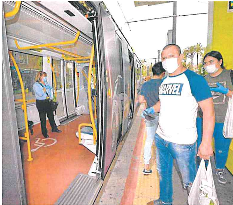
Pasajeros con mascarilla se disponen a entrar al tranvía, en Murcia, en una imagen de archivo.