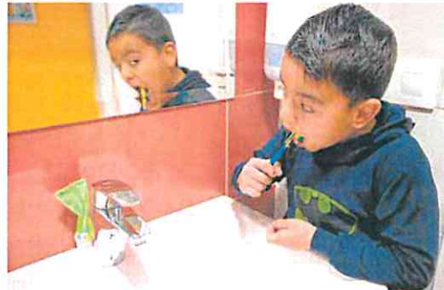
Hora de lavarse los dientes antes de ir al cole