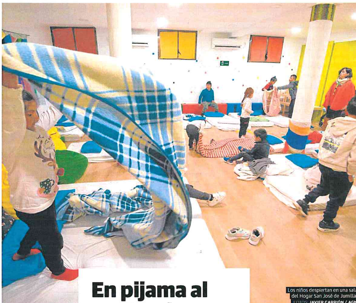
Los niños despiertan en una sala del Hogar San José de Jumilla.