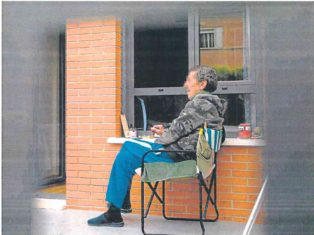
Un residente de Caser, en Murcia, toma el aire junto a su habitación, en una imagen de archivo. EDU BOTELLA

Y todo ello a pesar de la buena tendencia que, 'a priori', se observa en la evolución de los datos recogidos en el último informe de la Asociación de Directoras y Gerentes de Servicios Sociales, publicado en enero. Según este documento, la Región tiene un déficit de 1.925 plazas residenciales para alcanzar la ratio que establece la Organización Mundial de la Salud (OMS), de cinco plazas por cada cien personas mayores de 65 años. La cifra puede parecer elevada, pero es que hace solo un año era tres veces mayor, con un déficit que ascendía a 6.749 plazas.