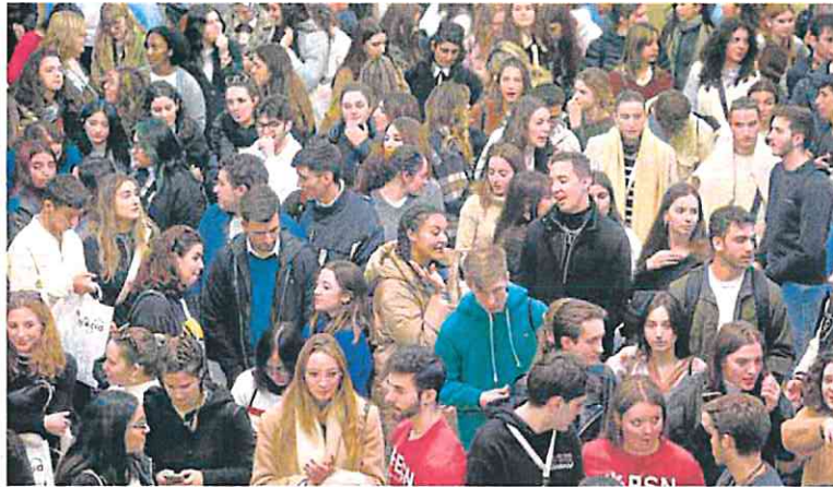
Acto de bienvenida a los alumnos universitarios internacionales el pasado 30 de enero.

En la UPCT, esperarán a que la Losu entre en vigor para aplicar la rebaja horaria, que no implicará la contratación de nuevos docentes por los ajustes de las plantillas. En los dos casos, los profesores que acumulan sexenios de investigación y otros mé-