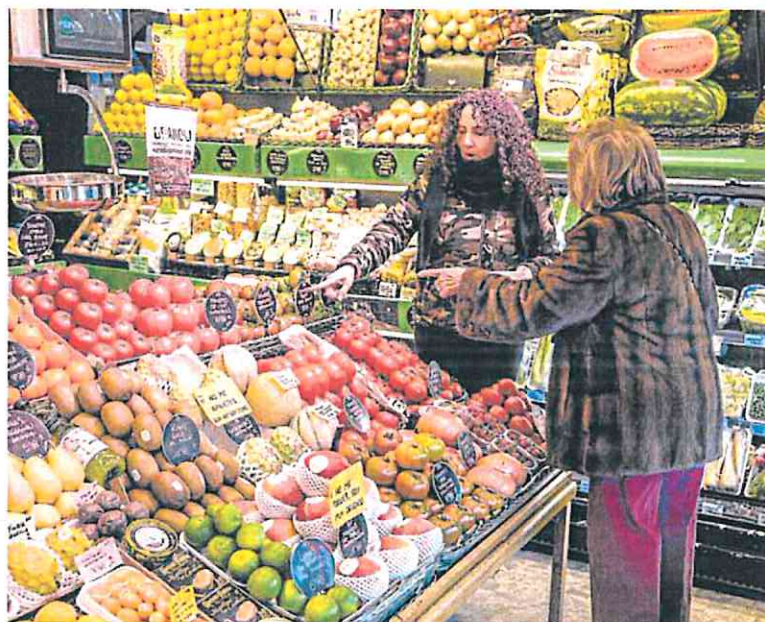
Das mujeres compran fruta y verdura en un supermercado.

De ocho cadenas analizadas, la asociación encuentra más irregularidades en Hipercoor, donde el 26% de los productos se han encarecido respecto al que tenían antes de la rebaja fiscal. Casos alarmantes son el arroz redondo, cuyo precio ha subido un 53% del 30 de diciembre al 7 de febrero, según los datos de Facua, y el kilo de calabacín, que se ha encarecido en estos establecimientos un 35%. Le sigue Aldi, donde el 18% de los productos analizados han subido de precio, el mismo porcentaje que en Eroski. Por detrás se sitúan Lidl (14%), Dia (12%), Mercadona (7%) y Alcampo (6%).