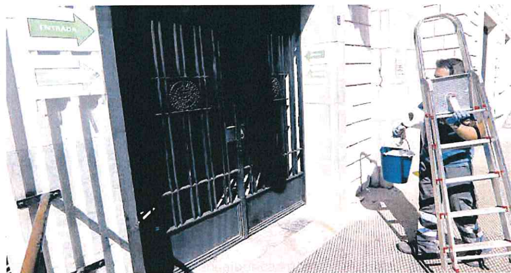
Los institutos podrán realizar contratos menores para obras y agilizar así el funcionamiento de los centros.

► La Consejería de Educación adelantó a las organizaciones sindicales que para acelerar las demandas estructurales de los centros se revisarán y se trabajarán los expedientes uno a uno. Otra de las opciones es realizar un análisis exhaustivo de todos los centros de la Región de Murcia para conocer sus necesidades, pero esta línea retrasaría los posibles trabajos y sería más cara. Se revisarán criterios como la renovación de instalaciones eléctricas, los problemas de accesibilidad a los centros o la ampliación de las unidades de escolarización.