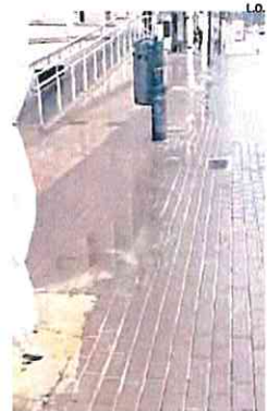
Nueva acera con charcos.

A través de redes sociales y grupos de Whatsapp se está compar-