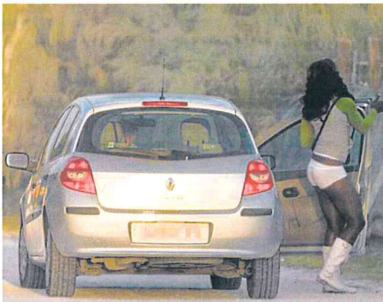
Una prostituta desciende del automóvil de un cliente junto al arcén de una carretera. a. c.

Esta replicó que su departamento no puede tener acceso a esos datos, con los que Igualdad pretende demostrar, tras haber acusado de machistas a los jueces. Ahora asume ese recuento el órgano gubernativo de la Judicatura, que en su día alertó sobre los riesgos que comportaba tocar las horquillas penales al unificarse en la ley los delitos antes de abuso y de violación.