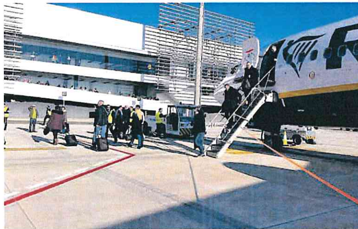
Desembarco de pasajeros en el aeropuerto de Corvera.

La Comunidad negocia abrir nuevas conexiones aéreas con Reino Unido, Francia e Italia, además de con Madrid y Barcelona