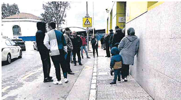
Personas hacen cola para hacerse el DNI, ayer en la Comisaría de Cartagena.

Algunos organismos de la Administración del Estado mantienen el trabajo a distancia para ahorrar energía