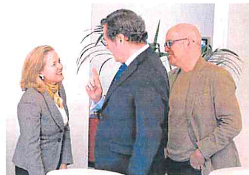
Nadia Calviño, junto a Antonio Garamendi, presidente de la CEOE, y Unai Sordo, secretario general de CC OO, ayer en Madrid.

El consejo de administración acordó ayer proponer a la junta de accionistas un dividendo complementario con cargo a 2022 de 8,5 céntimos de euro brutos por acción. De este modo, el dividendo total asciende a 14,5 céntimos de euro brutos por acción, lo que supone un 'payout' del 69,5%.