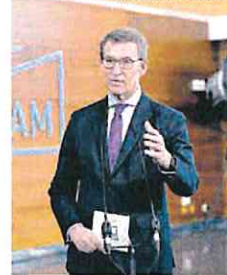
Alberto Núñez Feijóo.

siempre comprometido para la formación conservadora: Mariano Rajoy no derogó la ley del aborto de Zapatero pese a poder