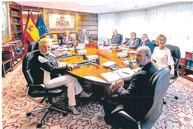
Pleno del Tribunal Constitucional, el pasado 24 de enero.

El TC comenzó el miércoles a deliberar un asunto que ya había pasado por tres ponentes (Elisa Pérez Vera y Andrés Ollero lo fueron mientras estuvieron en el órgano) y ahora lo verá una cuarta. A diferencia de otras ocasiones el pleno adelantó el resultado de la votación sobre el recurso contra la ley del aborto nada más concluir la deliberación de la ponencia presentada por el magistrado Enrique Arnaldo, que fue el primero en exponer su punto de vista jurídico. Así, los otros 10 jueces que componen el pleno verbalizaron su parecer sobre el recurso de inconstitucionalidad promovido por el PP contra diversos preceptos de la Ley Orgánica 2/2010, de 3 de marzo, de salud sexual y reproductiva y de la interrupción voluntaria del embarazo.