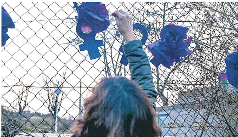
Una mujer coloca adornos antes de una manifestación feminista.

En el Reino Unido las leyes consideran delito muchas formas de violencia contra las mujeres, ya sean casos