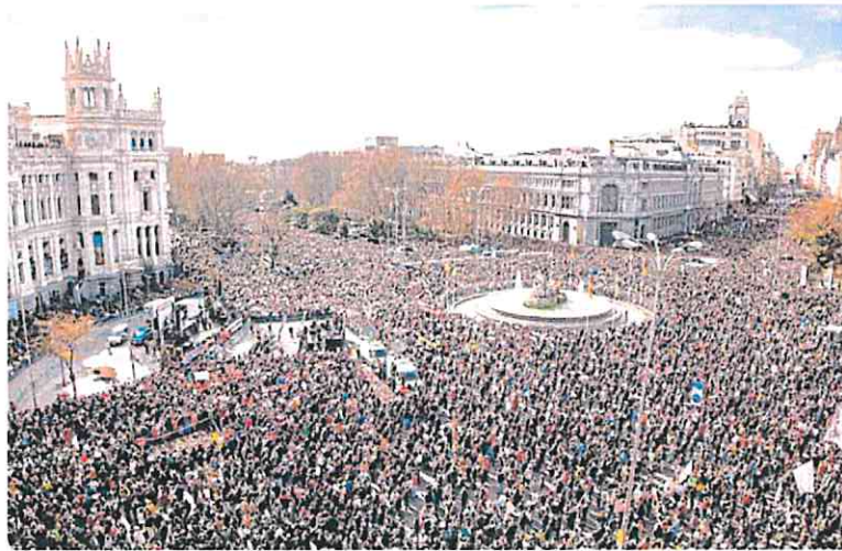
Vista aérea de la Plaza de Cibeles, en el centro de Madrid, ayer.

estar más pendiente de su «vanidad» y por «hacer todo lo contrario a lo que se comprometió en campaña». Una falta de palabra que, afirmó, le va a suponer un «castigo en las urnas» en las generales. Pero fue más allá en sus embestidas contra el jefe del Ejecutivo, al que acusó de inexperiencia y soberbia. «Una falta de preparación – insistió –, que ha llevado a España a la catástrofe», como con la ley del 'solo sí es sí', a la que calificó de «la chapuza legislativa más intensa del país».