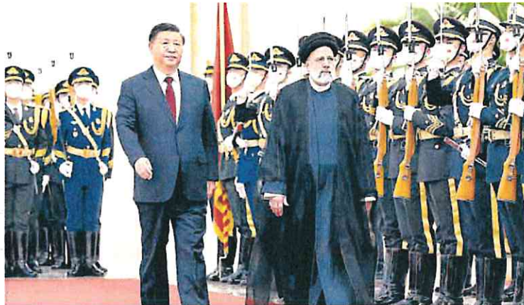
El presidente chino, Xi Jinping, junto con su homólogo iraní, Ebrahim Raisi, en Pekín.

Un par de artículos publicados en la prensa china en las vísperas de la visita anticipaban la sintonía. El que firmó Raisi en el 'Diario del Pueblo' hablaba de China como un «viejo amigo» y subrayaba que ambos países veían el unilateralismo y las «injustas» sanciones como la causa de la inseguridad y las crisis en el mundo. El editorial del 'Global Times', recordaba que las relaciones bilaterales se habían reforzado a pesar de «las interferencias y sabotajes» de EE UU y apuntaba a su salud como la prueba de que fuera del