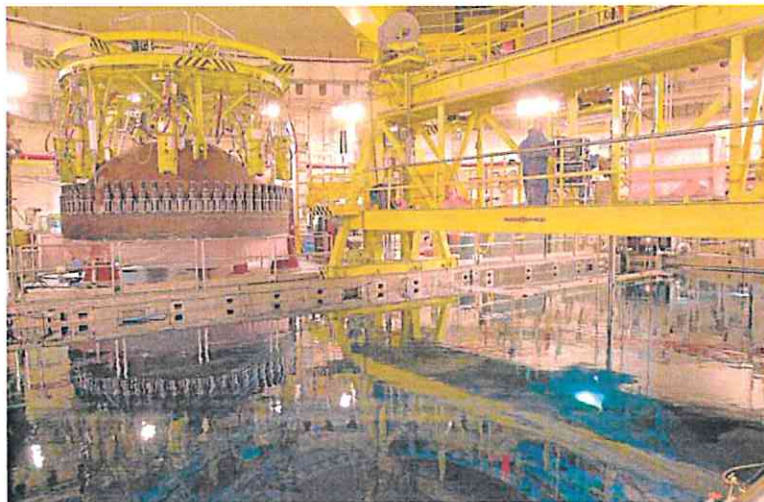
Reactor nuclear de Cofrentes, que cubre parte de la demanda energética de la Región de Murcia.

Detrás de este aumento está la 'excepción ibérica', que ha logrado reducir el precio del gas que España exporta a los países, haciendo más atractivas las compras. Aún así, España importó el doble de energía en 2022 que el año anterior. En total, compramos productos energéticos por 90.880 millones de euros, un 95% más, por el aumento de los precios internacionales de la energía, pero también por la reactivación de la economía y el transporte tras la pandemia.