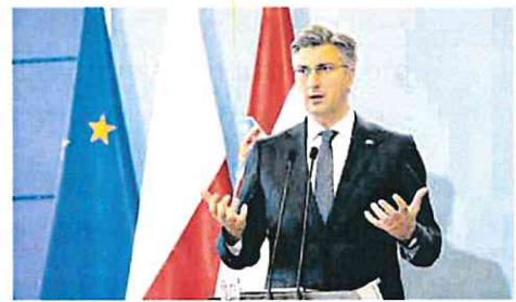
El primer ministro croata, Andrej Plenkovic, ayer.

El compromiso europeo es que el Pacto sobre Migración y Asilo se logre antes de las elecciones europeas, en mayo de 2024, pero las posiciones actuales dificultan hacerlo posible.