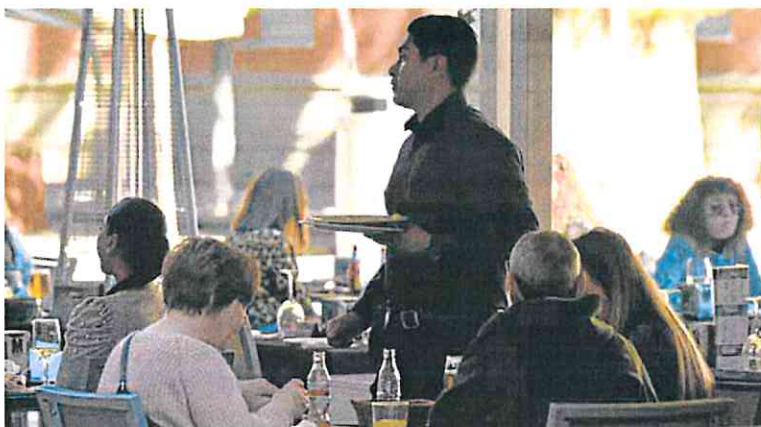
Un camarero atiende varias mesas de una terraza de Murcia, en una imagen de archivo.

El problema es que a esta última reunión, en la oficina de mediación y arbitraje laboral (OMAL), vuelven a llegar con las posiciones enconadas, más allá de algunos avances en las citas anteriores. Para salvar la situación, es necesario que todos acudan con el