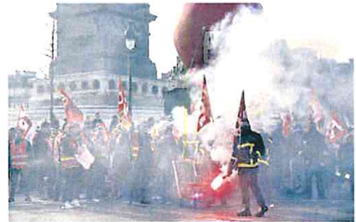
Quinto día de manifestaciones, ayer en París.

Por consiguiente, los sindicatos han advertido que a partir del 7 de marzo intentarán «paralizar Francia», si el Gobierno mantiene la impopular medida, rechazada por el 67 % de los franceses, según el último sondeo del instituto CSA. Quieren que ese día empleen huelgas ilimitadas en sectores clave de la economía y la vida colectiva, como los transportes o la recogida de basuras. Como sus esfuerzos están puestos en endurecer los paros laborales a partir del mes que viene, las movili-