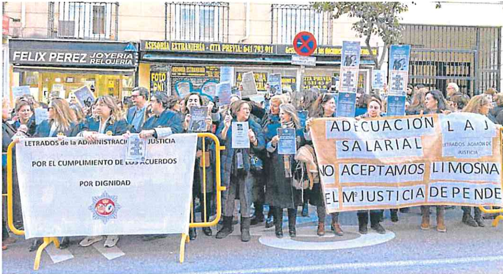
Letrados de la Administración de Justicia se manifiestan durante la reunión con el Ministerio, ayer tarde ante el Palacio de Sonora, en Madrid.