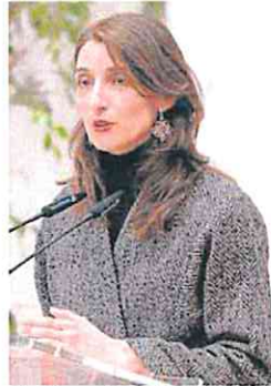
Pilar Llop, ministra de Justicia.

Casi el 90% de los procesos penales de la Región se han visto frenados por el paro y 380 subastas judiciales