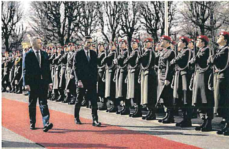
El presidente del Gobierno, Pedro Sánchez, y el canciller Karl Nehammer, ayer.

«Si algo hemos aprendido de esta guerra, de esta maldita guerra, es la necesidad de apostar por la autonomía estratégica abierta, que