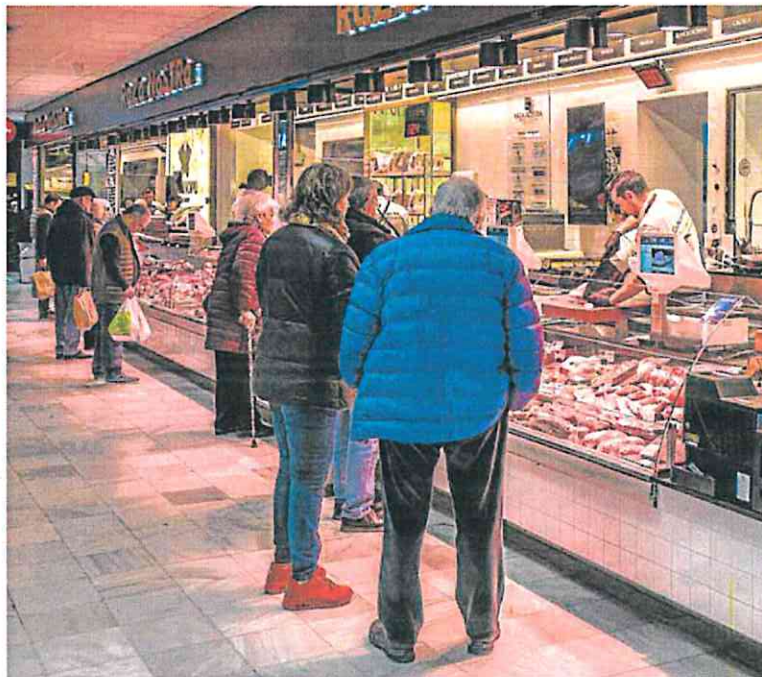
Clientes en la carnicería de un mercado de abastos, en Madrid. PABLO COBOS

Los ministros socialistas quieren evitar acciones «contraproducentes» y la formación morada insiste en actuar con valentía