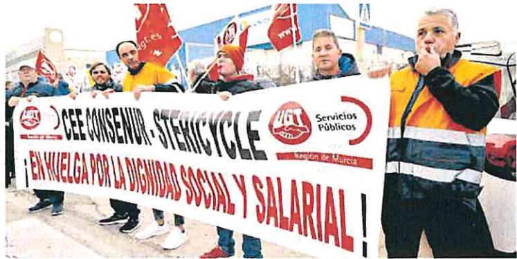
Unos 50 trabajadores se concentraron ayer a las puertas de la empresa.

Sin embargo, a no es un problema generalizado en la Comunidad Plena Inclusión, federación que engloba a la mayoría de asociaciones de personas con discapacidad intelectual y del desarrollo de la Región, actualmente cuenta con 26 entidades bajo su paraguas, de las que cinco cuentan con Centros Especiales de Empleo adheridos. «En todos ellos, los trabajadores reciben su remuneración según lo que recogen los convenios actuales», destacan.