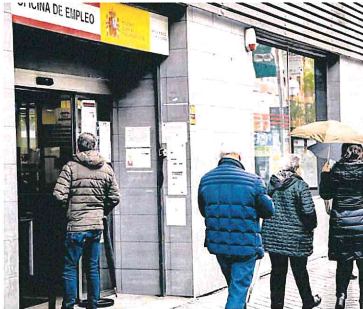
Varias personas frente a una Oficina de Empleo.

El Gobierno ha ido y está desplegando un nuevo escudo social que mejore la protección de las personas que carecen de ingresos laborales y, a su vez, mejore sus posibilidades de encontrar un nuevo empleo. Con la idea de que puedan transitar de un estado al otro, tanto el Ministerio de Trabajo como el de Se-