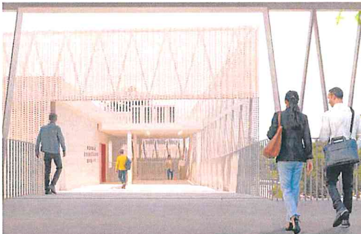
Recreación del acceso principal a los nuevos módulos del Parque Científico.

El procedimiento de admisión de alumnos culmina con la matriculación en el centro adjudicado, que será del 8 al 16 de junio para primer ciclo de Infantil (0-3 años), del 15 al 22 de junio para segundo ciclo de Infantil y Primaria, y del 4 al 10 de julio para Secundaria y Bachillerato.