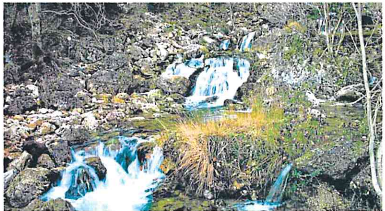
El calar del río Mundo, donde está la reserva hidrológica subterránea declarada por el Ministerio en la cuenca.