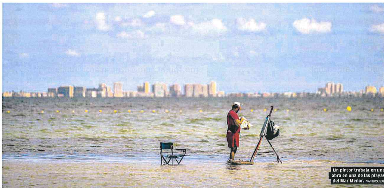
Un pintor trabaja en una obra en una de las playas del Mar Menor. IAN LUPULZAR