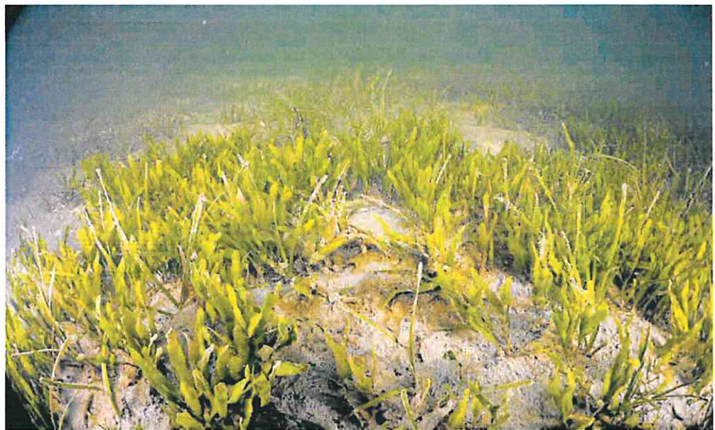
Praderas marinas de caulerpa proliferan en aguas del Mar Menor.

La investigación también determina que cuando las condiciones ambientales de la laguna mejoran, favorece la recolonización de estas plantas a lo largo y ancho de la laguna y, a su vez, «permite que el ecosistema recupere rápidamente parte de la función de estas praderas como sumidero de nitrógeno».