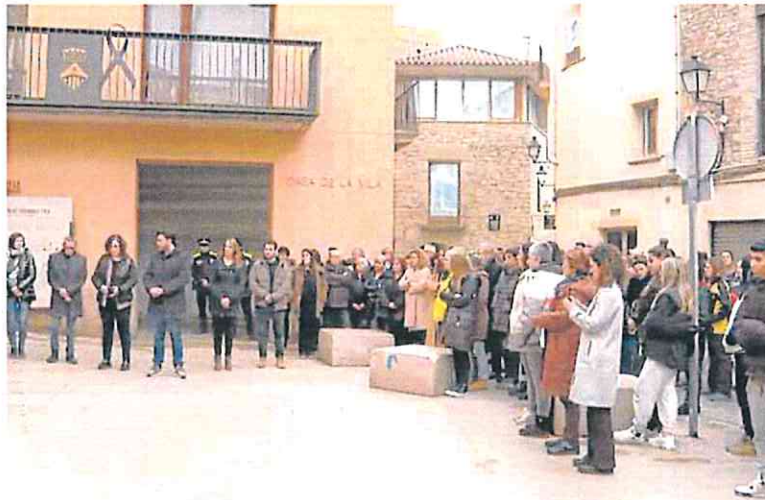
Concentración de los vecinos de Sallent (Barcelona) en recuerdo de la gemela fallecida.