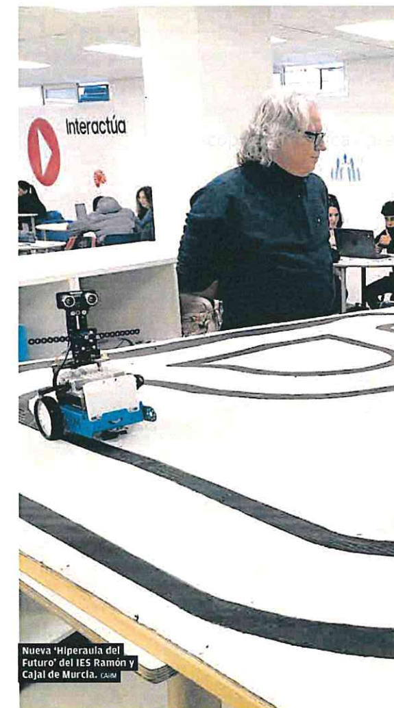
Nueva 'Hiperaula del Futuro' del IES Ramón y Cajal de Murcia. CAIM

Educación prevé durante el proceso de admisión que los colegios y escuelas infantiles registren hasta 14.000 solicitudes de los padres para conseguir plaza el próximo curso. En total, se estima una matricula-