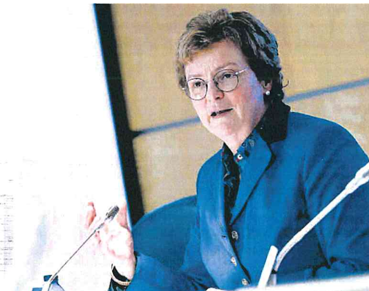
La eurodiputada alemana Monika Hohlmeier, ayer durante una rueda de prensa en Madrid.

También se solicitó al Gobierno una mayor flexibilidad en la gestión de los fondos — eliminando burocracias —, así como una mayor participación de las autonomías en el diseño de los programas de gasto.