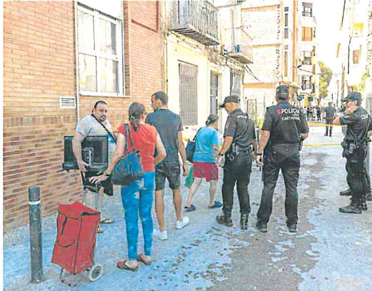
Residentes del edificio sacan sus pertenencias vigilados por agentes locales y nacionales.

ne que ver meterse de todo a diario», dijo un residente de la zona, que afirmó estar harto de la situación de abandono que sufren a cien metros de la basílica de la Caridad y de la oficina de la Seguridad Social.