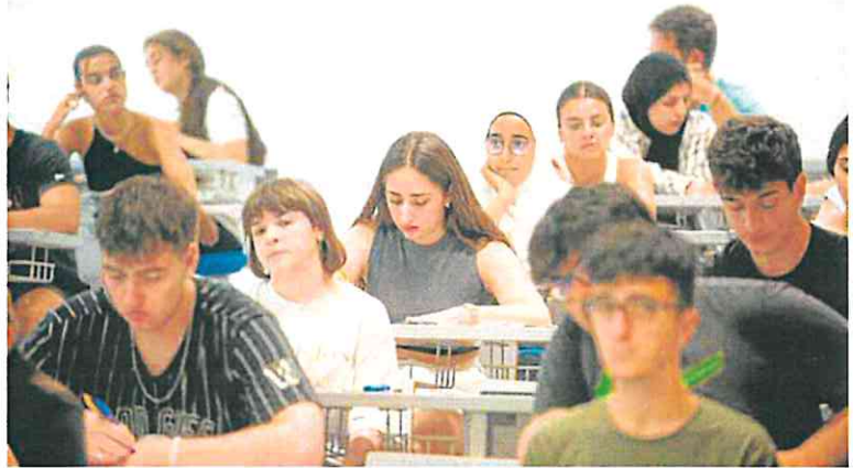
Un grupo de estudiantes en el Aulario Norte de Espinardo, ayer, antes del examen.

La nota de admisión a la universidad se calcula a partir de la nota media del bachillerato (que pesa un 60%) y la nota de la Ebau. Los grados más demandados suelen agotarse en la convocatoria ordinaria, por lo que es posible que al realizar la extraordinaria el número de plazas disponibles sean inferiores.