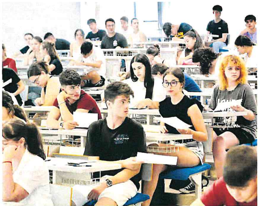
Estudiantes de 2º de Bachillerato, ayer, durante las pruebas de la EBAU en el Aulario Norte de Espinardo (Murcia).

A partir de este martes comenzarán los exámenes de modalidad y las específicas para subir nota. A estos exámenes también pueden presentarse los estudiantes que no han conseguido los resultados esperados previamente en la convocatoria de junio, y necesitan subir nota para poder cursar la carrera que elijan, cuya nota de corte necesaria es determinante. Las notas podrán conocerse el día