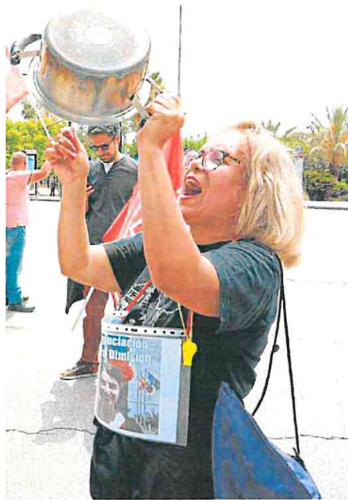
Protesta de funcionarios de Justicia el pasado sábado en Murcia.

El informe del CGPJ explica que la jurisdicción social fue la más golpeada por las movilizaciones de los LAJ y que ese perjuicio guarda gran relación con el hecho de que en ese período no se celebraran conciliaciones