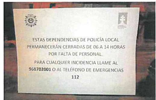
Cartel colocado a primera hora de ayer en la sede de la Policía Local.

La plantilla de la Policía Local mantiene un conflicto abierto con el equipo de gobierno y, en los últimos meses, se han producido varias concentraciones para solicitar unas condiciones laborales similares a las de otros municipios. En redes sociales, algunos agentes comentaron que «la falta de voluntad política, de coordinación y previsión por parte de las autoridades de la corporación obligan a cerrar las dependencias de la Policía Local y lleva la Seguridad Ciudadana de Caravaca de la Cruz a tiempos pretéritos».