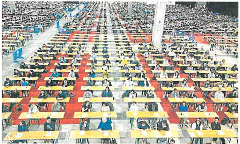
Cientos de opositores en las últimas pruebas de acceso a Correos.

Opportunidad más ventajosa Se da la circunstancia de que cuando la ley de estabilización del empleo público se encontraba en trámite parlamentario, muchos gobiernos autonómicos ya tenían convocados procesos de estabilización y, por lo tanto, estos aspirantes no se beneficiaron de los supuestos contemplados en esta norma. Ahora, el Gobierno accede a que esos interinos que habían suspendido o los que ni siquiera lo intentaron puedan presentarse a otro concurso que previsiblemente será más ventajoso para ellos ya que no necesitan aprobar una oposición. La nueva ley, que pretende reducir la temporalidad en la Administración del 30% al 8% a finales de 2024, establece que las plazas ocupadas ininterrumpidamente por interinos con anterioridad a 1 de enero de 2016 podrán ser convocadas por el sistema de concurso; es decir, sin oposición. Por esta razón no será necesario superar un examen y solo se valorarán los méritos de los candidatos. Desde Hacienda no saben cuántos interinos podrían beneficiarse de este cambio, aunque en Andalucía son ya 1.000.