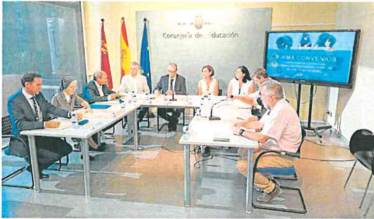
Representantes de la patronal de la concertada, de los sindicatos y el consejero y otros cargos de Educación. CAM