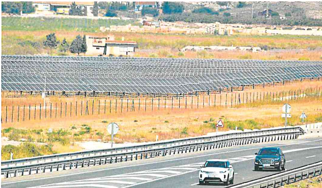
Parque fotovoltaico Alglbcos, ubicado en la pedanía murciana de Baños y Mendigo.