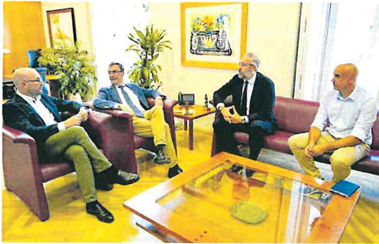
Encuentro de los alcaldes de Murcia y Santomera ayer en la Glorieta.