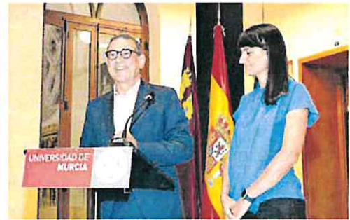
El rector, ayer, junto a la secretaria de Telecomunicaciones.

Por ello, ha insistido en la necesidad de que el plan «mejore bastante y contemple la situación de las universidades públicas de la Región, que tenga en cuenta algo que es capital en un plan de financiación de universidades públicas, que dé respuesta a la pregunta de qué