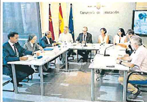
Reunión de los representantes de la concertada, ayer.

en un gran contrato programa donde el Gobierno regional le exija a sus universidades lo que Murcia necesita para tener futuro y progreso, ha finalizado.