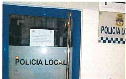
Puerta de las dependencias policiales, cerradas.

Desde el Ayuntamiento de Caravaca de la Cruz, por otro lado, explican que lo sucedido es algo puntual que «ha sido como consecuencia de una baja». Este mismo lunes por la mañana, aseguraron, «se ha pedido un informe a la Jefatura, para que se vuelvan a estructurar los turnos y se resuelva el problema».