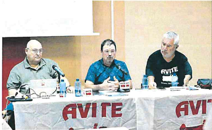
Un momento de la rueda de prensa de los responsables de Avite, ayer en Murcia.

También que para las ayudas se reconozca a todos los afectados que en su expediente de discapacidad tengan el código 'talidomida' que acredita que este medicamento fue la causa del daño, de manera que la evaluación no dependa solo del ministerial Instituto Carlos III, de Madrid, que fue el encargado de hacerla junto con el censo y el protocolo para los subsidios. Por último, ha reclamado al Ejecutivo español que los apo-