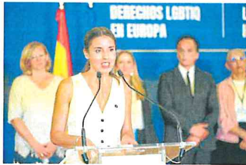
La ministra Irene Montero, ayer, en Madrid.

En cuestiones específicas, los firmantes piden que «ahí donde sea necesario» se impulse «la filiación de los niños y niñas», in-cremente la financiación de «or-