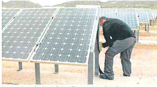
Un operario en la planta de Jumilla, en imagen de archivo. GUSTAVO LÓPEZ

mentado su capacidad de generación de energía renovable en sus centros de producción. Las bodegas de Jaume Serra, Los Llanos, Marqués de Carrión y Viña Arnáiz, así como sus plantas en Huelva, Daimiel, Almería, Jumilla y Segorbe, desde donde se producen zumos, gazpachos, cremas y caldos de la marca Don Simón, son, entre otras, los centros de producción con fotovoltaicas.