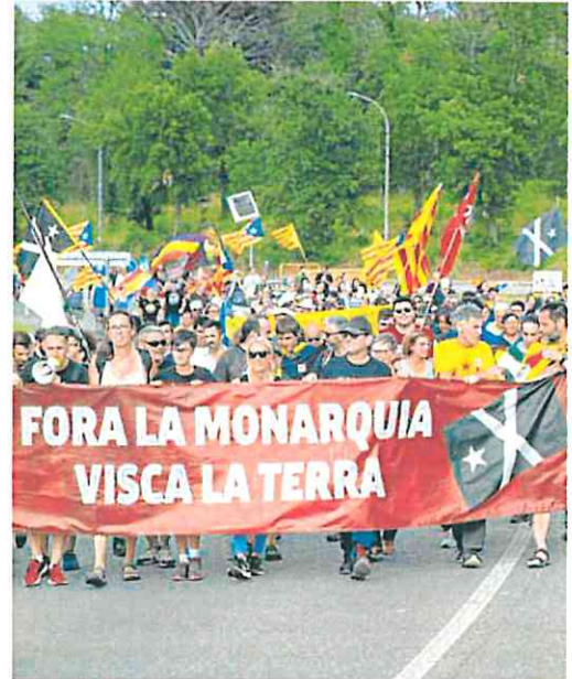
Penas medio centenar de personas protestaron contra la Corona.

En su discurso, el Rey apeló a la «estabilidad» como «garantía de futuro». Los Reyes llegaron a Gi-