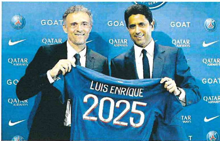
Luis Enrique, junto a Nasser Al-Khelaifi, ayer en su presentación en París.