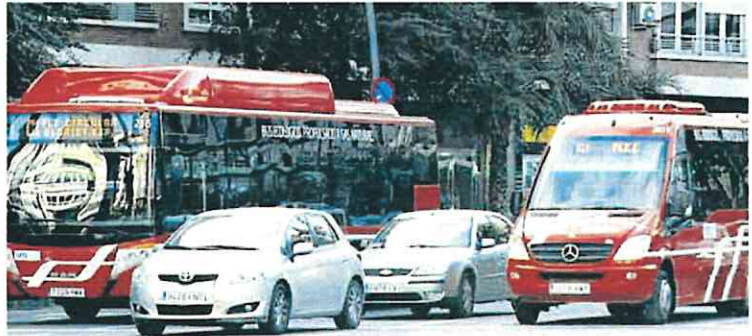
Los conductores de los 'coloraos' llevan más de un año de protestas.

Tras asegurar que se ha revisado el acuerdo, el edil popular no quiso detallar en qué sentido se ha modificado o en cuánto se aumenta la aportación municipal a la UTE para sufragar los sobrecostos del servicio. Fue ese desequilibrio entre gastos e ingresos lo que mo-