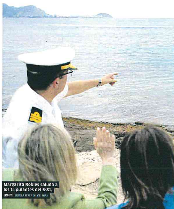
Margarita Robles saluda a los tripulantes del S-81, ayer.

En cuanto a las pruebas, la ministra asegura que se está avanzando «bien» en el programa de