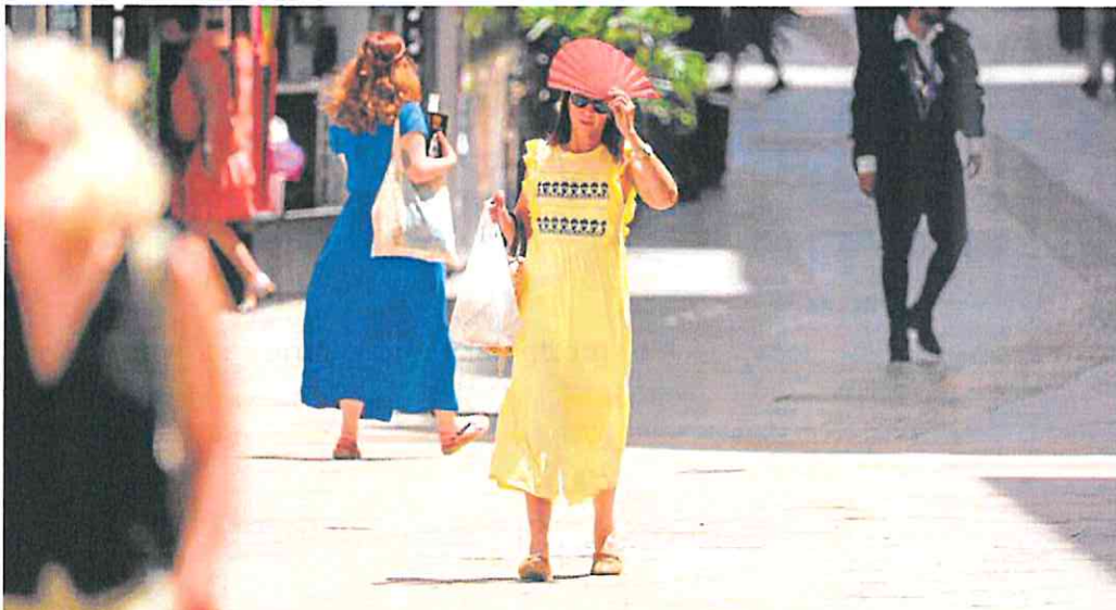
Una mujer trata de protegerse del sol con un abanico, ayer, en el centro de Murcia.