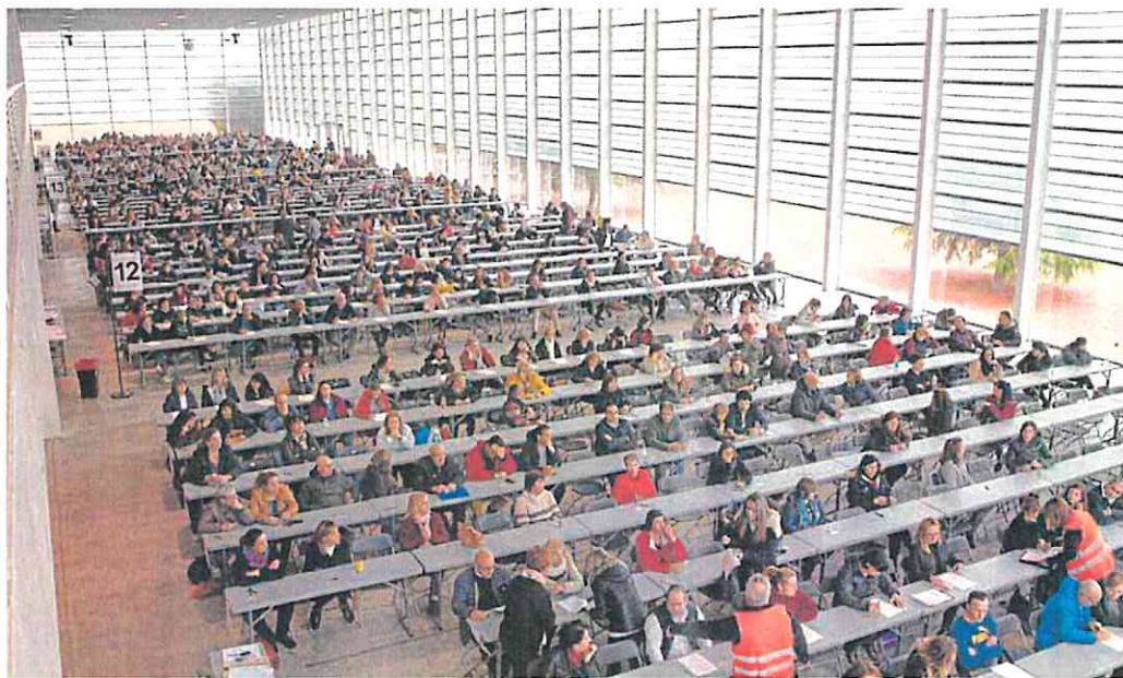
Centenas de opositores se examinan para una de las plazas de funcionario que se ofrecieron en una de las últimas convocatorias.

Es más, el Ministerio de Hacienda tenía previsto llevar al Consejo de Ministros de hace un mes esta