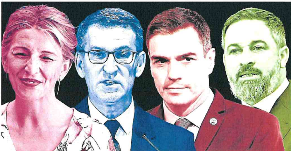
Yolanda Díaz, Alberto Núñez Feijóo, Pedro Sánchez y Santiago Abascal.

Según los datos más recientes, a medida que nos acercamos a la jornada electoral se está registran-