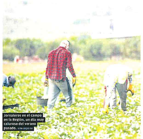
Jornaleros en el campo en la Región, un día muy caluroso del verano pasado.

El grupo anuncia en su comunicado que «ha revisado las reco-