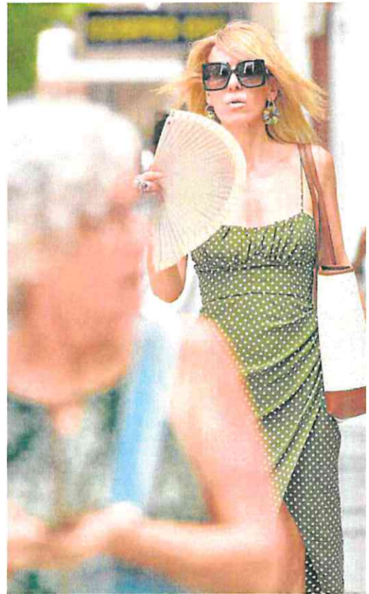
Una mujer se abanica, ayer, en una calle de Murcia

«Lo que intentamos al compartir experiencias es anticiparnos a posibles situaciones de riesgo por altas temperaturas en trabajos desarrollados en el campo al aire libre, en invernaderos o bien en centros de manipulación», indica la patronal. «Si bien traba-