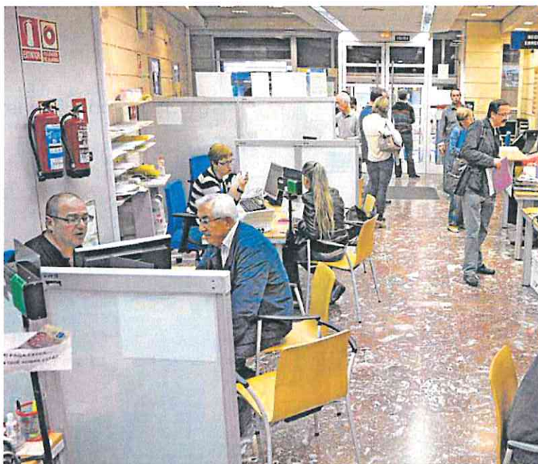
Hacienda destina 2.500 plazas a reforzar la Seguridad Social. Iosu ONANDIA

A esta cifra, además, hay que añadir las miles de plazas que se convocan cada año para la Policía Nacional y Guardia Civil (casi 5.000 en 2022), para las Fuerzas Armadas (otras cerca de 2.000 más el año pasado), así como las destinadas a la Administración