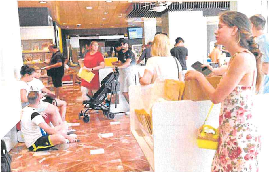
Ayer, último día para solicitar el voto por correo, se registraron largas colas en la oficina de la plaza Circular.