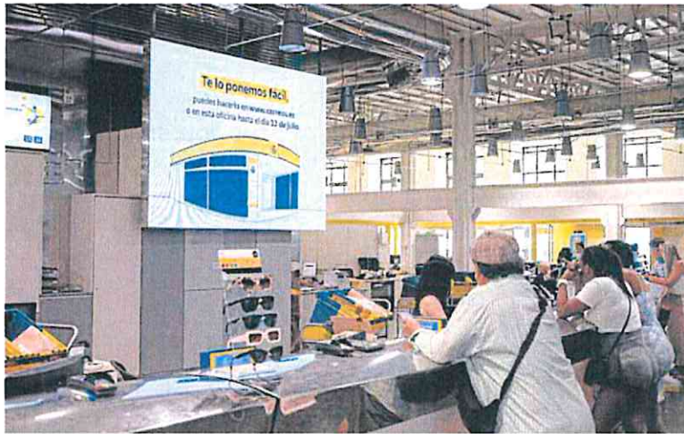
Varias personas hacen cola ayer en una oficina de Correos de Madrid para tramitar su voto postal.

UGT y CC OO insisten en alejar el fantasma de un supuesto «fraude electoral» y defienden «la acreditada solvencia de Correos desde la Transición» en