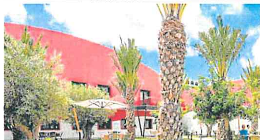
El jardín creado por la empresa dentro de sus políticas ambientales. FINI