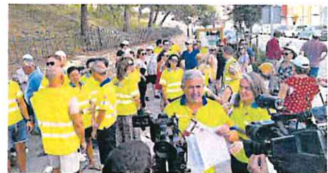
Protesta ayer en el SUAP de Cieza.

Desde el sindicato SPS aseguran que «la única respuesta ha sido por parte de la jefa de Enfermería del 061, quien ha facilitado unas máquinas portátiles