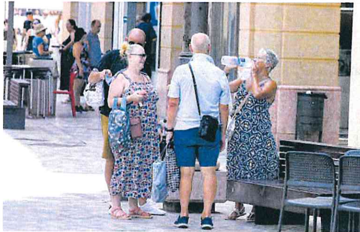
Vecinos de Cartagena se resguardan del sol en una calle de la ciudad para hidratarse.

Este mes de julio se está caracterizando por «episodios de calor cortos pero muy intensos», en los