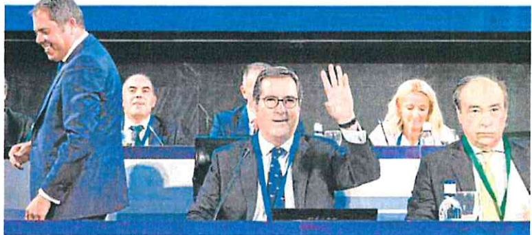
El presidente de la CEOE, Antonio Garamendi (centro), durante la asamblea general de la patronal.