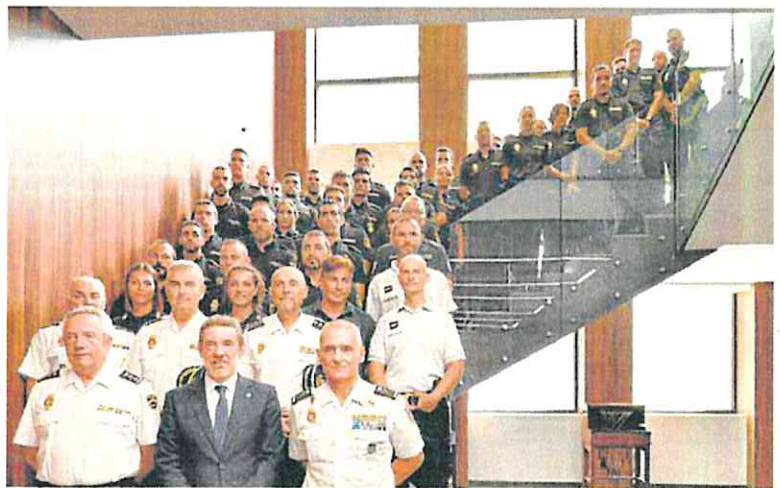
El delegado del Gobierno (c) y el jefe superior (d), junto a los nuevos agentes.

El acto también sirvió como presentación oficial ante el delegado del Gobierno de once policías (un subinspector, tres oficiales y siete policías) que vienen destinados a la Región de Murcia. Del Olmo explicó que, durante el verano, la mayoría de ellos