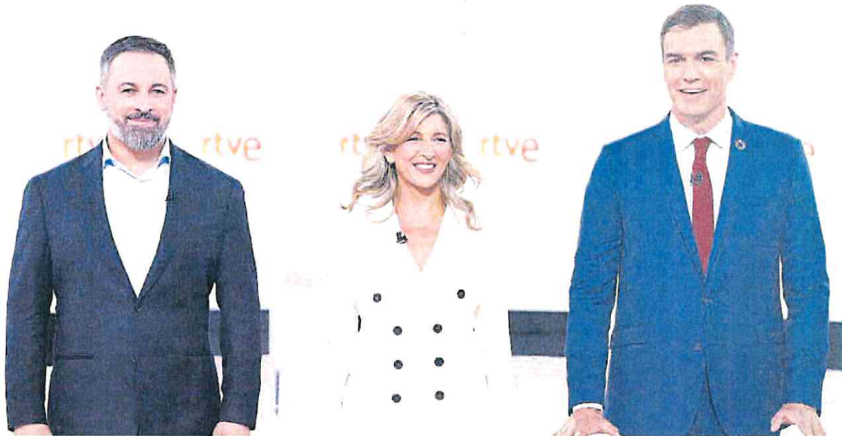
Santiago Abascal (Vox), Yolanda Díaz (Sumar) y Pedro Sánchez (PSOE), en el plató de RTVE antes de comenzar el debate.