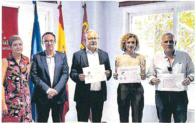
Rueda de prensa del Colegio de Graduados Sociales, ayer, en Murcia.

El máximo representante del Colegio explicó que las pérdidas millonarias se calculan en base a que «el 25% de la jornada laboral diaria se dedica a realizar tareas que debería hacer la Administración. Cada despacho destina una media de 1,5 personas