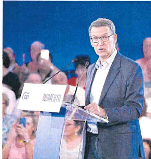
Alberto Núñez Feijóo, el martes en Palma.

Feijóo y los suyos argumentaron durante días que no consideraban necesario participar en un debate así, en el que no estaban convocados los representantes de ERC, PNV y EH Bildu, socios habituales del Gobierno de coalición durante