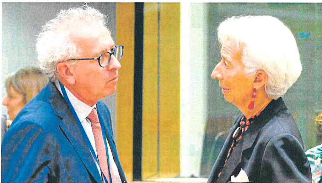
La presidenta del BCE, Christine Lagarde, junto al responsable del Mecanismo Europeo de Estabilidad, Pierre Gramegna, en Bruselas.

El incremento anual del coste de la vida sigue muy lejos del 2%, el objetivo del banco central para una política monetaria estable