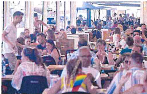
Un chiringuito en La Manga, este verano.

La época estival es uno de los momentos de mayor actividad en la hostelería de la Región de Murcia y, a juicio del sindicato Comisiones Obreras, también de mayor inseguridad jurídica. Según la secretaria general de la Federación de Servicios de CC OO Región de Murcia, Teresa Fuentes «junto al aumento de demanda de mano de obra también ha habido un aumento de las denuncias por los contratos en fraude de ley. Nos estamos encontrando con casos altas por