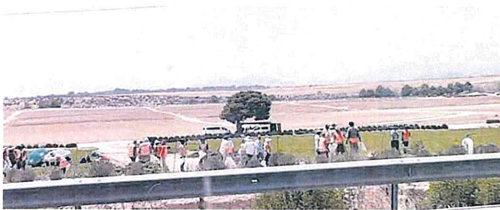
Jornaleros trabajando el miércoles 19 de julio sobre las 15.00 horas, con más de 40 grados de temperatura en ese momento.

Se da la circunstancia de que el martes fue el primer día que la Comunidad murciana fue golpeada por el anticiclón Caronte, que disparó el mercurio en los termómetros y dejó una sensación asfixiante, de no poder respirar.