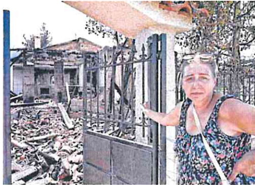
Una mujer griega observa los restos de su casa, devorada por el fuego.

No sólo Grecia, también Rumanía, Turquía, Francia e Italia su-