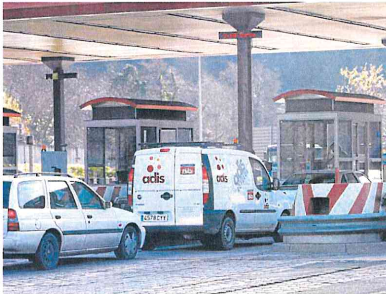
Puestos de peaje en una autopista asturiana. JOAQUÍN BILBAO

En realidad, la polémica medida figura en el plan que fue aprobado tanto por Bruselas como por los Estados miembros. Dicho compromiso está ligado, en concreto, al desembolso del quinto tramo de los fondos, que asciende a más de 8.000 millones de euros. El texto establece que «es preciso desarrollar un sistema de pago por uso de la red de vías de alta capacidad que permita cubrir los costes de mantenimiento e integrar las externa-