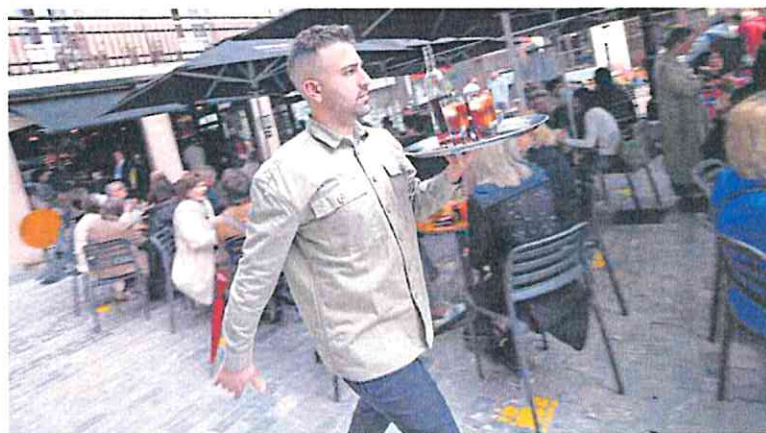
Un camarero porta un pedido de vermouth en una terraza de Oviedo.

En este caso, también la mayor caída se produce en el suministro de energía eléctrica y agua (-25,3%), seguido por la industria (-3,6%) y el comercio (-1,3%). A su vez, los servicios incrementaron su facturación un 5,5%. Fueron la excepción.