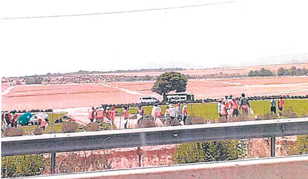
Jornaleros trabajan en el campo el pasado miércoles en pleno aviso rojo por calor.