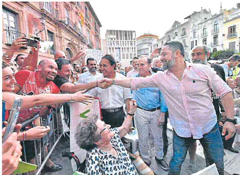
Simpatizantes se arremolinan para saludar al líder nacional de Vox.

Al hilo de estas declaraciones, Abascal, interrumpido constantemente por aplausos, dijo que su partido «no se va a poner de perfil» en esta negociación y que tras las elecciones del próximo domingo serán otros, en referencia al PP, quienes tendrán que moverse de sus posiciones. Además, con sorna envió un mensa-