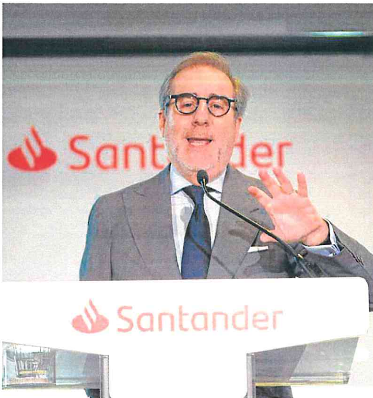
El consejero delegado de Banco Santander, Héctor Grisi, ayer en la presentación de resultados. »

Todas estas magnitudes incorporan el impacto que ha tenido el abono del impuesto extraordinario español al sector, que en el caso del Santander ha supuesto el desembolso de 224 millones de euros para este ejercicio, cargados en el primer trimestre. Sin este gravamen, el beneficio del banco habría aumentado un 12%, cinco puntos porcentuales más del registrado. De hecho, las acciones de la entidad repuntaron ayer más de un 3% en la Bolsa.