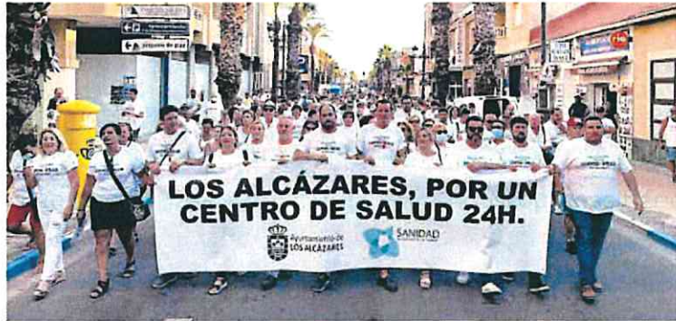
Protesta para pedir un servicio de Urgencias 24 horas en Los Alcázares.

Mientras tanto, lamenta el Sindicato de Enfermería, que «muchos servicios no están funcionando a pleno rendimiento o están suspendiendo permisos y vacaciones de su personal, esperando la contratación de estos especialistas». Por ello insisten en que los enfermeros especialistas «merecen un trato más justo» por parte de la Administración y piden que se adecue el mapa de recursos humanos a las necesidades.