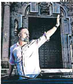
Santiago Abascal, en Murcia.