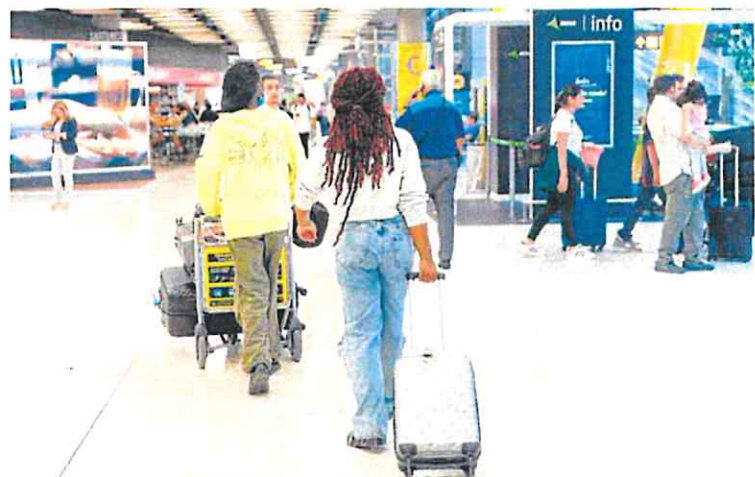
Varios viajeros en la terminal 4 del aeropuerto de Madrid-Barajas. E. P.

El acceso a estas plazas se hará con carácter general por un proceso de concurso-oposición. La fase de concurso ponderará un 40% y la experiencia será el elemento determinante en la valoración, lo que da prioridad para acceder a estos puestos a los interinos, que además, serán indemnizados con 20 días por año trabajado si no superan las pruebas.