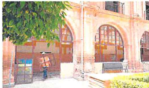
Un operario trabaja en la restauración del claustro.

MURCIA. Si la Diócesis de Cartagena iniciará en menos de dos semanas la restauración de la fachada de la Catedral, principal joya arquitectónica e histórico-artística del municipio, la Universidad Católica San Antonio (UCAM) ha puesto en marcha ya una intervención monumental sobre el claustro del Monasterio de los Jerónimos, edificio declarado bien de interés cultural (BIC) -conocido como 'el Escorial murciano'- en el que se encuentra la sede central del campus de la ins-