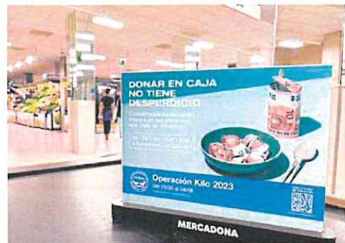
Cartel anunciando la Operación Kilo en una tienda de Mercadona.

Junto a la donación de alimentos, Mercadona colabora con 27 fundaciones y centros ocupacionales en la decoración de sus tiendas con murales de trencadís, elaborados por más de 800 perso-