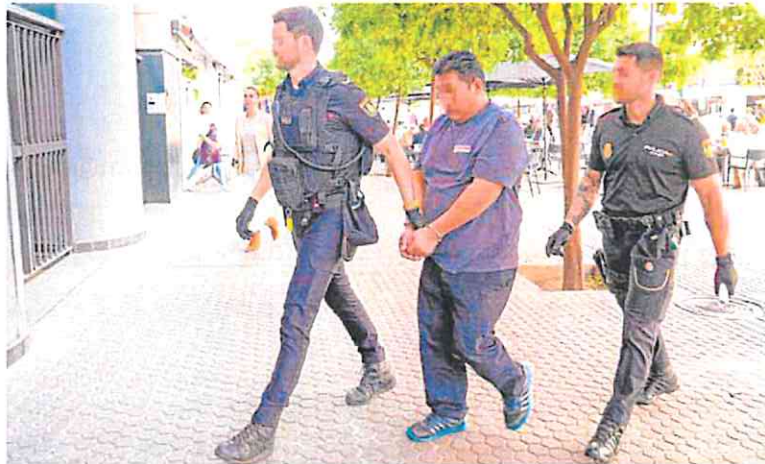
El acusado de asesinar a su expareja en Sevilla, detenido en junio de 2022, antes de declarar ante el juez. ✎

En términos relativos, las mayores tasas por cada 1.000 mujeres se dieron en la ciudad autónoma de Melilla (3,7), La Rioja (2,6) y Baleares (2,3). Por el contrario, País Vasco y Cataluña (0,8)