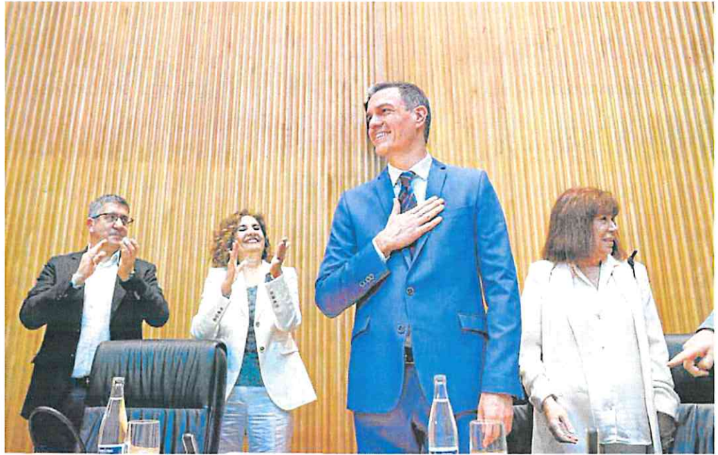
Sánchez, al dirigirse al grupo parlamentario socialista tras anunciar el lunes el adelanto de las generales.

De un modo más sutil, el moderado Ximo Puig, también reconocido ayer en Onda Cero que seguramente le habría ido mejor si hubiera adelantado las elecciones en la Comunidad Valen-