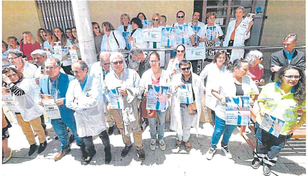
Profesionales concentrados ayer frente al centro de salud de San Andrés, en Murcia, en protesta por el aumento de agresiones.

LA VERDAD. El Colegio de Médicos ha otorgado a la asociación Pediatría Solidaria uno de sus premios Solidario SOS 2023. En concreto, se reconoce el proyecto que esta ONG desarrolla en Gambia. Tres pediatras de esta organización estuvieron el año pasado en una barriada de Faji Kunda, en Gambia, prestando asistencia y formando a personal sanitario. Los voluntarios volverán este verano a la zona.