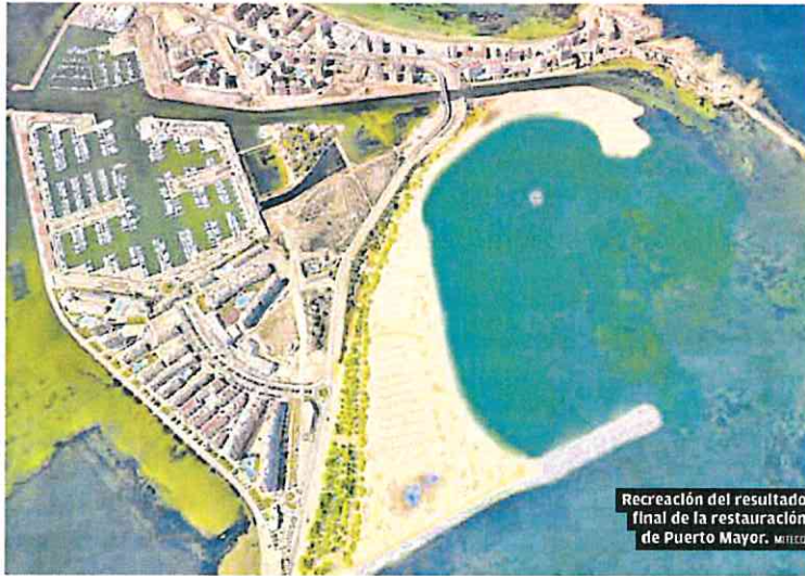
Recreación del resultado final de la restauración de Puerto Mayor. MITED