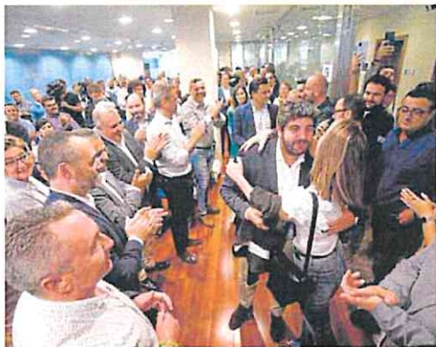
López Miras recibe aplausos y abrazos de los afiliados.