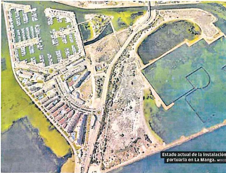
Estado actual de la Instalación portuaria en La Manga. MITED