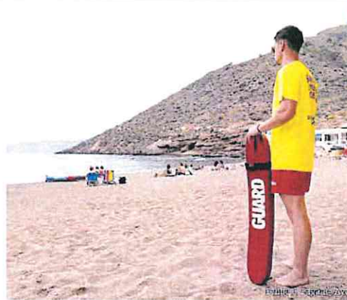
Un socorrista, en una playa de Cartagena.

El dispositivo concluirá el 30 de septiembre.