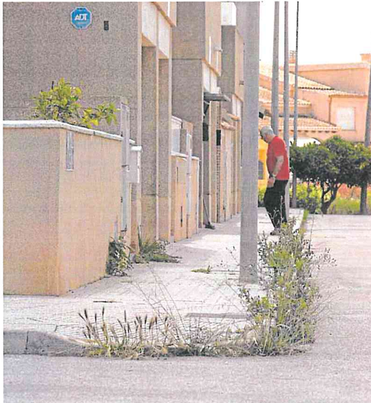
Calle Tucumán de Pozo Estrecho llena de matorrales y, al fondo, un solar sin adecentar.

La recuperación del Mar Menor, la creación de una red de viviendas sociales, una mayor inversión en calles del centro histórico, como San Diego, Duque, Serreta, San Vicente, Saura, Gloria y Gisbert, entre otras, y un aumento de las dotaciones de la Policía Local y de los bomberos son otras de sus reclamaciones, «que debe hacer posible el nue-