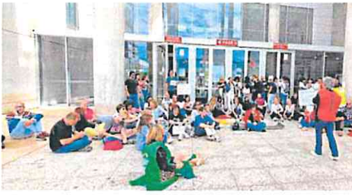
Funcionarios en la sentada en la Ciudad de la Justicia de Murcia. csif