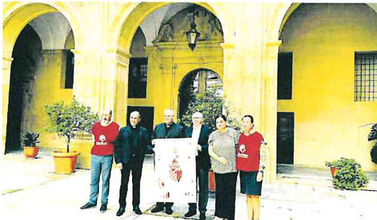
Un momento de la presentación de la memoria institucional de Cáritas, ayer en Murcia.