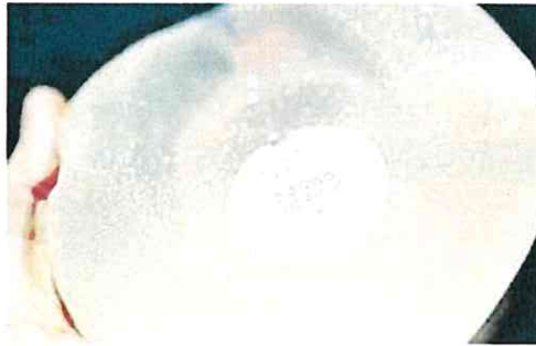
Implante mamario de PIP, la empresa bajo sospecha.

Hace once años, la entonces directora general de Asistencia Sanitaria de la Comunidad aseguró que el Servicio Murciano de Salud (SMS) no estaba usando los implantes PIP desde el año 2007 y reveló que habían detectado a medio centenar de afectadas, a cinco de las cuales hubo que ope-