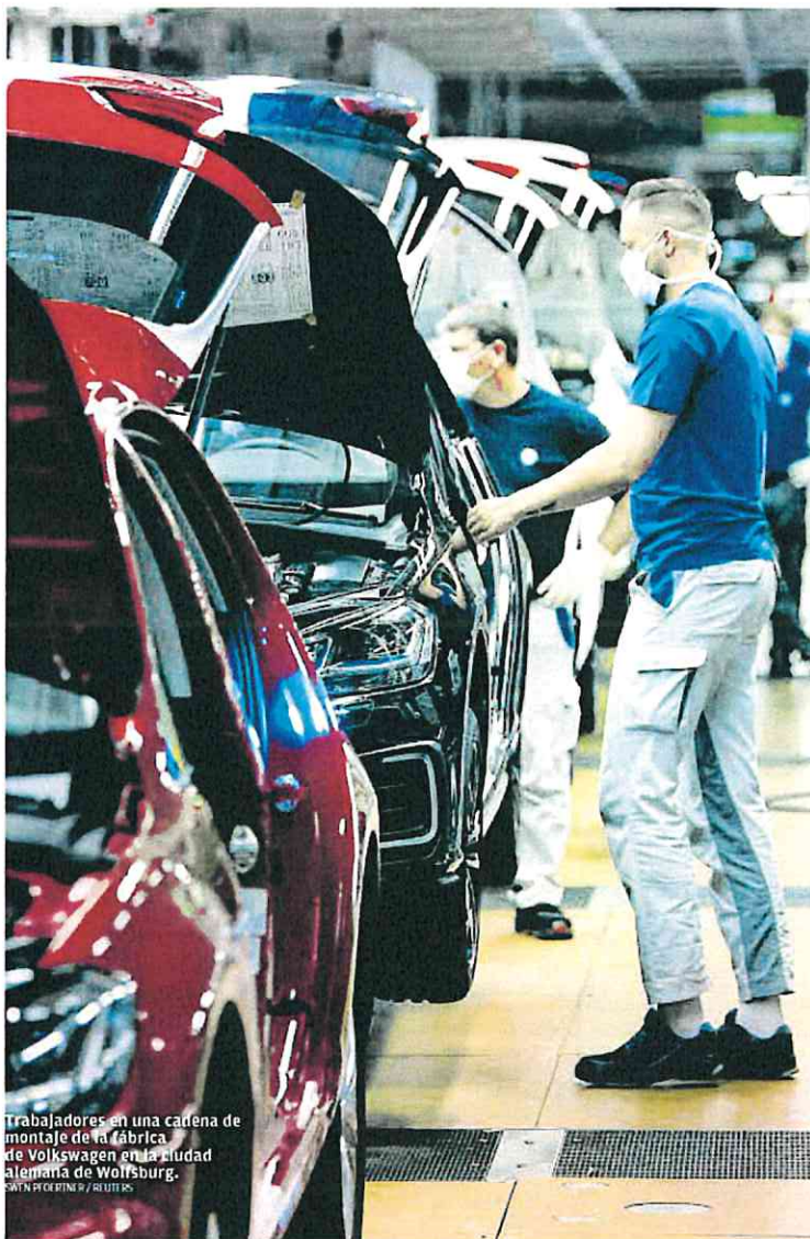
Trabajadores en una cadena de montaje de la fábrica de Volkswagen en la ciudad alemana de Wolfsburg.

Con recesión técnica o sin ella, lo cierto es que en 2023 se ha producido una desaceleración generalizada de todas las economías: la mundial, la de la zona euro, la de los principales países y también en España. La razón de ello tiene que ver con las consecuencias derivadas de la guerra en Ucrania -crisis energética e inflación- ahora que, en 2023, se ha producido a la retirada de los estímulos que se aplicaron en 2022. El endurecimiento de la política monetaria -con subidas de tipos de interés- en las principales economías del mundo ha contribuido a enfriar la demanda de familias y empresas, al tiempo que empieza a restar margen de gasto a los Gobiernos. Para España, la OCDE proyecta