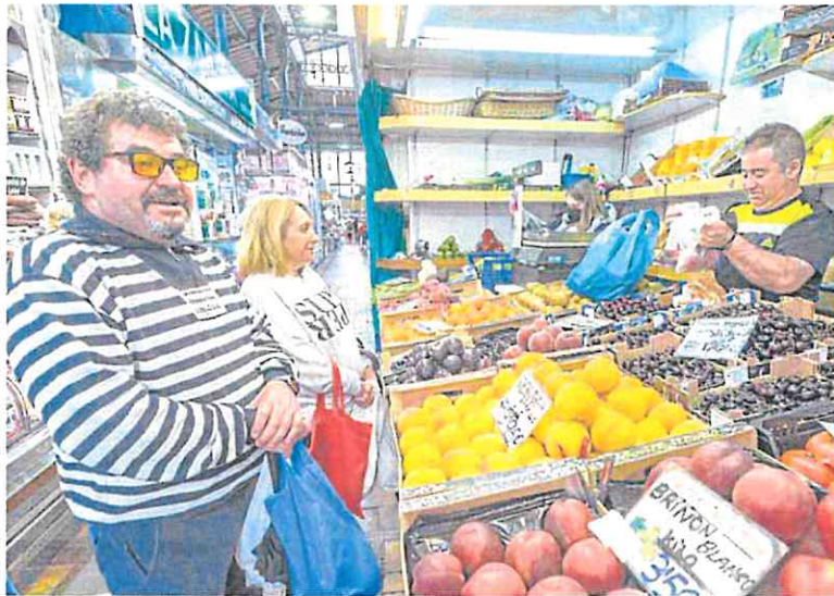
Dos clientes compran en una frutería de un mercado de abastos. ROBERTO RUIZ

El coste de los alimentos se ha convertido en los últimos meses en el talón de Aquiles de la inflación en España, después de subidas históricas que han llegado a superar el 16% interanual en los últimos meses de 2022 y el primer