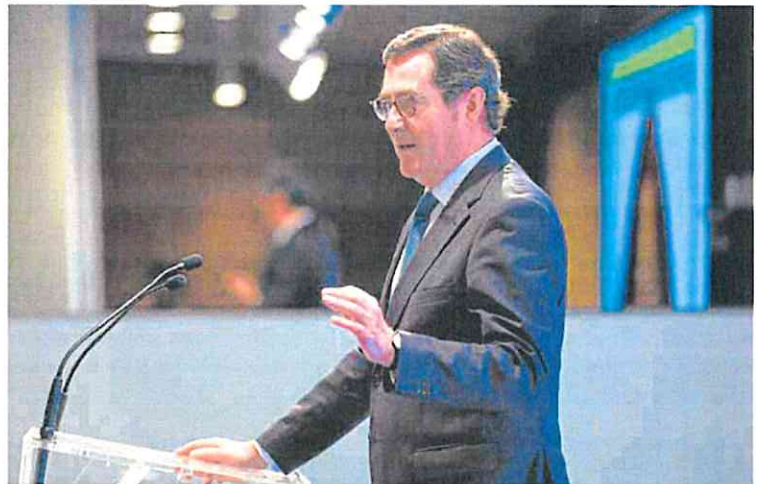
El presidente de la CEOE, Antonio Garamendi, en una intervención pública.

Sin embargo, desde el sector VTC celebraron la sentencia, al considerar que «pondrá en cuestión» las restricciones impuestas al sector en otras regiones como Aragón, Baleares o Comunidad Valenciana. Las patronales Feneval VTC y Unauto-VTC creen que estas limitaciones provocan una «gran escasez de alternativas de transporte» frente a otros países europeos, donde no existen y en los que la oferta de movilidad por cada 1.000 habitantes es superior.