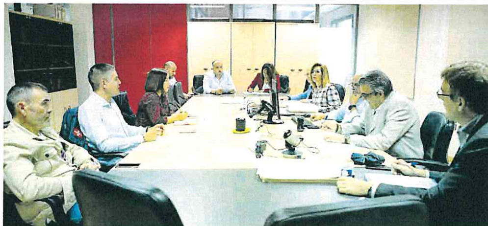
Reunión de la Sociedad Casco Antiguo celebrada ayer.