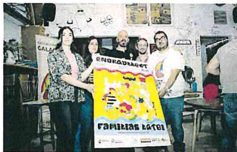
Presentación del programa de EnorgulleCT, ayer.

Llegado el día principal del Orgullo, la reivindicación y la fiesta irán