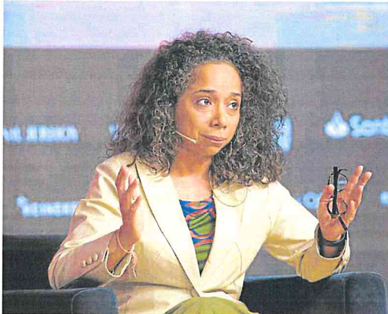
Julissa Reynoso, durante su intervención de ayer en Santander WomenNOW.

Reynoso se muestra agradecida a las «mujeres en particular que me han abierto puertas en el sector privado y el Gobierno. No es casual que la oportunidad me la diera otra mujer. La igualdad entre