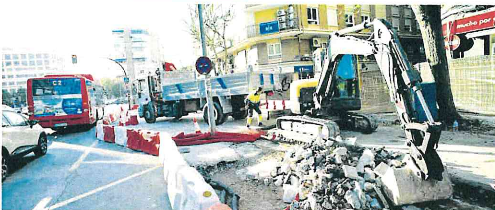
Obras del plan de movilidad en la avenida Primo de Rivera de Murcia, en la que se han suprimido aparcamientos.

Además, limita al 2% la subida del alquiler para este año en las zonas más tensionadas de las grandes ciudades, entre las que no se encuentra Murcia, y establece un incremento del 3% para 2024. Añade además, dificultades para el desahucio de familias con hijos y personas vulnerables.