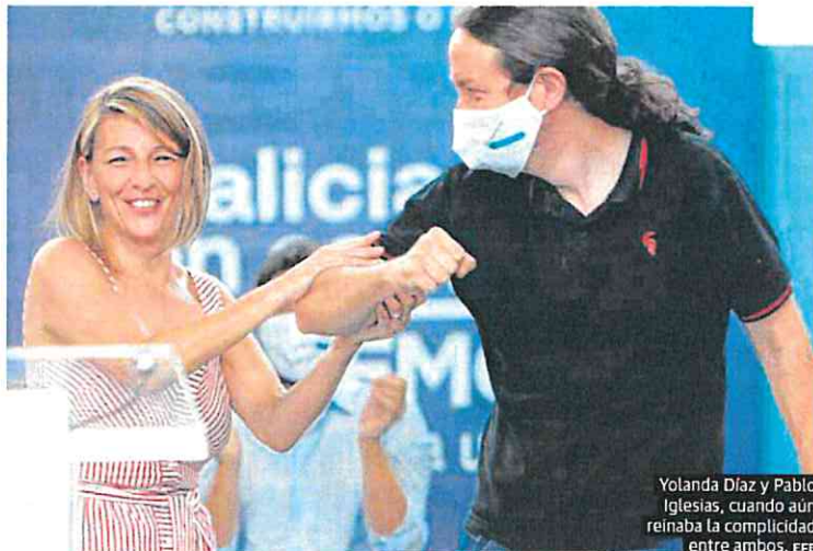
Yolanda Díaz y Pablo Iglesias, cuando aún reinaba la complicidad entre ambos.

Además de los 18.000 euros de indemnización a Marcos, Montero ha sido condenada a publicar en su cuenta de Twitter el encabezamiento y fallo de la sentencia, a la eliminación del tuit publicado el mencionado 25 de mayo de 2022 compartiendo el video del discurso en el que realizó las declaraciones, y a publicar el encabezamiento y la parte dispositiva de la sentencia en un periódico de ámbito nacional.