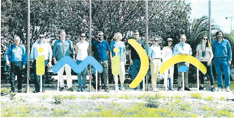
Comitiva noruega en su visita al Instituto Murciano de Investigación y Desarrollo Agrario y Medioambiental.