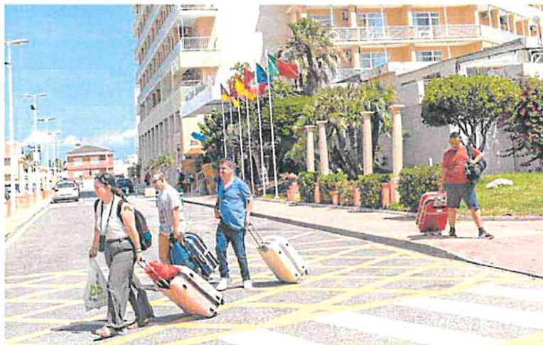
Turistas con maletas, frente al Hotel Entremares, ubicado en la entrada de La Manga.

Tanto es así que estos días están siendo considerados ya por los hoteleros y hosteleros de la costa como el pistoletazo de salida a la temporada alta de turismo, donde las expectativas de este año pasan por rozar el completo, al menos, durante la segunda quincena de julio y la primera de agosto, y llegar al 90%, el resto de días de los meses centrales del verano.