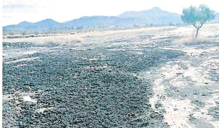
Terreno abonado con lodos. L.O.

Esta acción está llevándose a cabo durante los últimos años en distintas parcelas del término municipal de Jumilla debido a que las depuradoras produ-