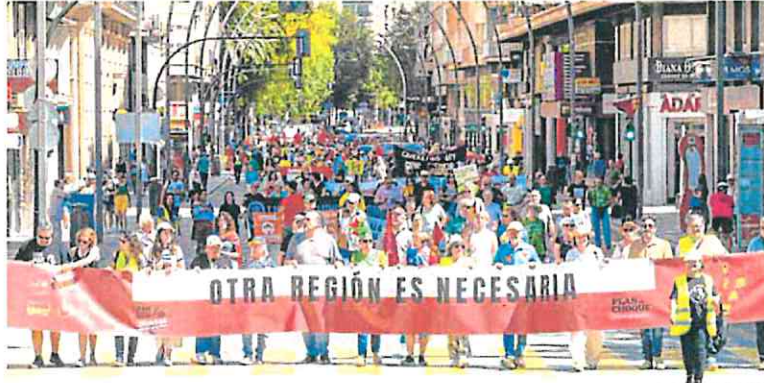
La cabeza de la manifestación recorre la Gran Vía de Murcia, tras confluír las cuatro columnas.