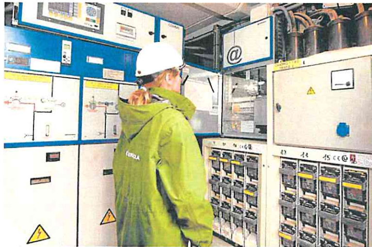
Cuadro de contadores de una comunidad de vecinos.

Aunque la renovada modalidad del PVPC saldrá de La Moncloa la próxima semana y previsiblemente será validada por la Diputación Permanente del Congreso (el órgano que sigue en vigor en medio de la convocatoria electoral para