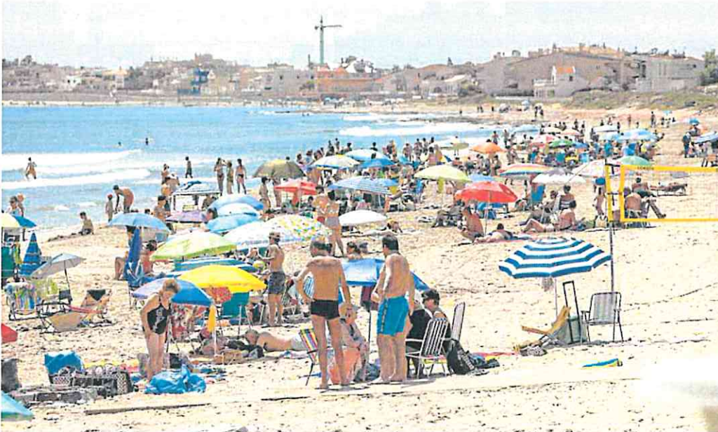
Bañistas tomando el sol en la playa de Galúa y, al fondo, la playa de Levante de Cabo de Palos.