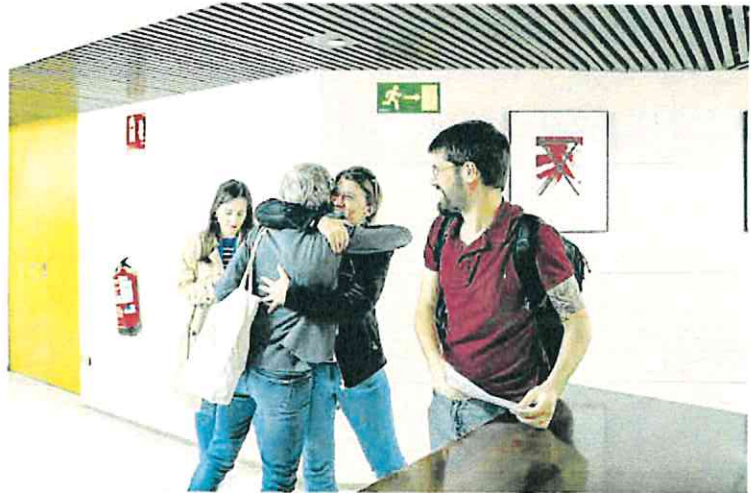
Miembros de Sumar y Podemos se abrazan tras registrar la coalición en la Junta Electoral Central.

Yolanda Díaz tampoco se pronunció públicamente sobre el pacto, y se limitó a enviar un comunicado desde Sumar reivindicando la pluralidad como «signo