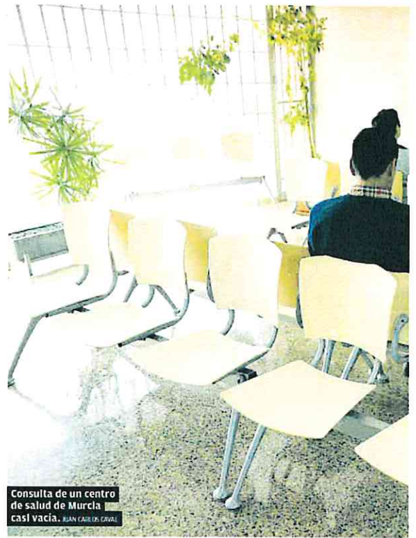
Consulta de un centro de salud de Murcia casi vacía. JUAN CARLOS CAVAL

La representante de UGT también recuerda que, después de la pandemia, con el aumento de la actividad, se ha producido «una relajación» en la aplicación de las normas de prevención en las empresas. «Cuando se incorporan los trabajadores hay una falta de atención y de evaluación de los puestos de trabajo» para detectar los posibles riesgos.