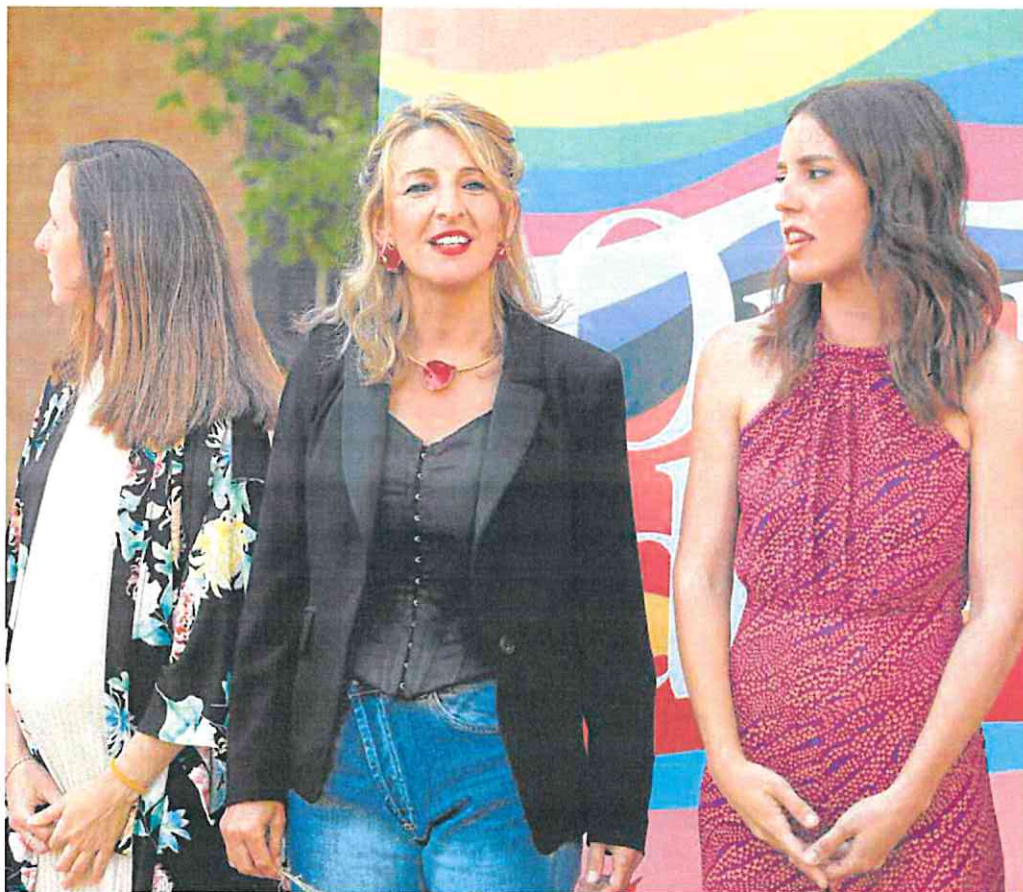
Belarra, Díaz y Montero, en un acto en favor del colectivo LGBTI en junio de 2022. Las fotos de las tres juntas comenzaron a escasear.

El malestar es palpable en las filas de los morados ante la formulación de una propuesta de acuerdo de la que disienten —Sumar sostiene que sí se respeta la representatividad del partido fun-