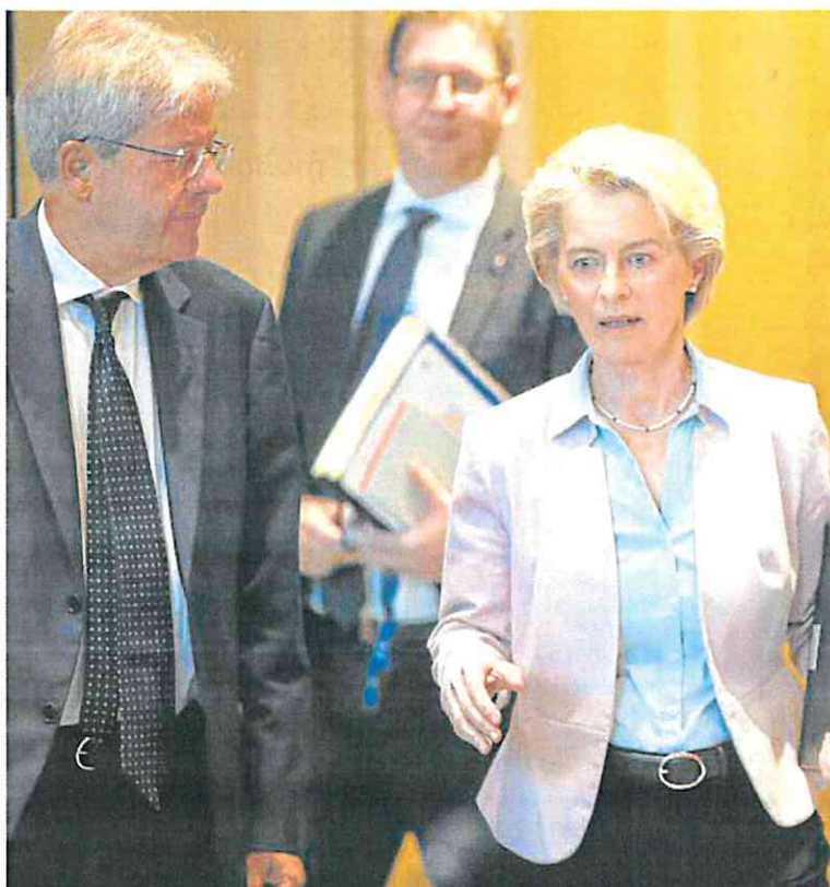
La presidenta de la Comisión Europea, Ursula von der Leyen.

Por ello, ha acordado una propuesta que amplía la protección a saldos temporalmente elevados en las cuentas bancarias vinculadas a acontecimientos concre-