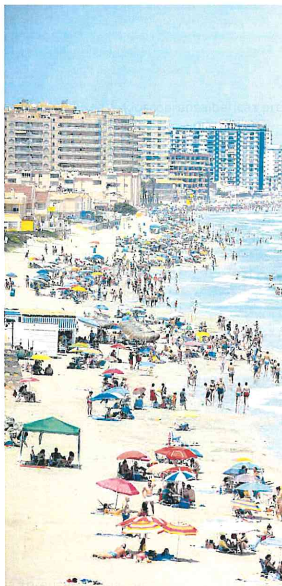
Sol y playa, atractivos turísticos para los visitantes de La Manga del Mar Menor.

En la Región y la provincia alicantina, «el suelo agrícola se caracteriza principalmente por patrones de cultivo complejos, incorporando árboles frutales y tierras de cultivo de regadío, que en muchos casos se encuentran muy cerca de la costa». Las áreas industriales, comerciales o deportivas, las dos últimas vinculadas al ocio y al turismo, también han favorecido la expansión del tejido urbano en la costa regional.