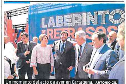
Un momento del acto de ayer en Cartagena. ANTONIO GIL

La Comunidad mejora el proyecto, que tendrá filtros verdes, y sacará un nuevo contrato P18