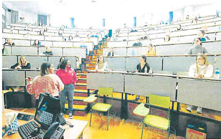
Aspirantes a una plaza de formación sanitaria especializada, el pasado enero en el campus de La Merced. J. C.

A mediodía, Campillo mantuvo una reunión con el consejero de Salud, Juan José Pedreño, en la que se solventó el conflicto. «Los MIR y EIR (enfermeros internos residentes) no tendrán que devolver la cuantía extra tras el aumento ya percibido en sus retribuciones», señalaron fuentes de Salud. Desde este departamento se recordó que «la subida está sujeta a la realización de una de las actividades recogidas en el acuerdo».