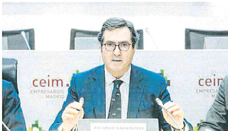
El presidente de la CEOE, Antonio Garamendi, comparece ante la prensa.

Otro de los departamentos más tensionados es la Seguridad Social. En este caso, la plantilla se mantiene en el entorno de las 30.000 personas, aunque gran parte se jubilará en los próximos años.