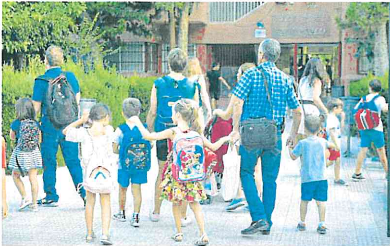
Alumnos de 3 años inician sus clases en el colegio San Pablo de Murcia.