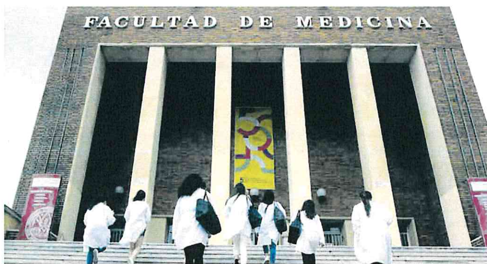
Médicos acceden con sus batas a la antigua Facultad de Medicina de la UMU en el Campus de Espinardo.