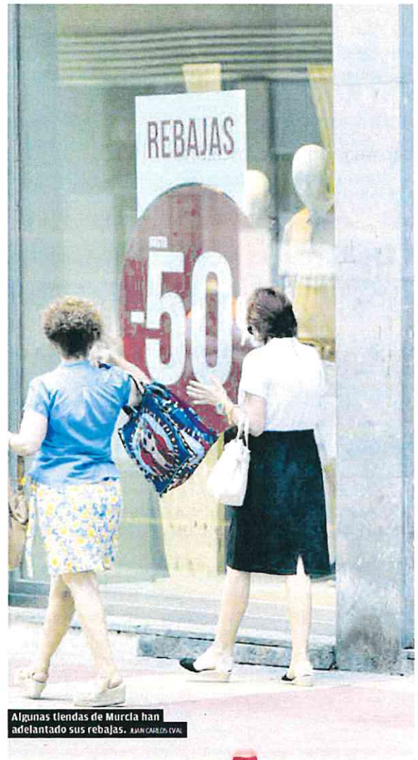
Algunas tiendas de Murcia han adelantado sus rebajas.

La OCU apunta que «tres de cada cuatro familias viven al día, es decir, sin capacidad de ahorro. Una dificultad que también se traslada a la compra de ropa, un gasto difícil de afrontar para el 42% de los hogares, aunque el precio del vestido y el calzado ha bajado un 0,8% en lo que va de año».