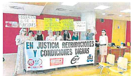
Huelguistas reunidos ayer en la Ciudad de la Justicia de Murcia. cc 00

Estas organizaciones convocaron ayer asambleas a lo largo de la geografía nacional para explicar las nuevas movilizaciones con las que pretenden arrancar un acuerdo a Justicia. El próximo martes 27 el colectivo tiene prevista una gran manifestación