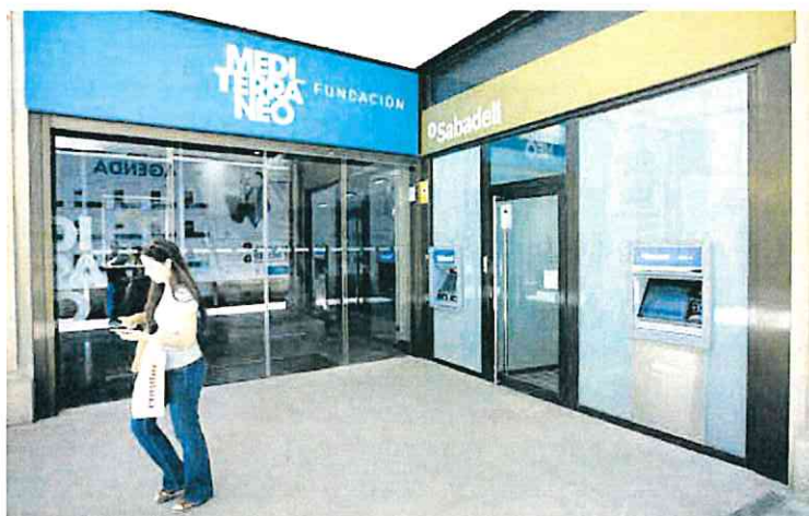
Oficina principal del Banco Sabadell en Murcia.