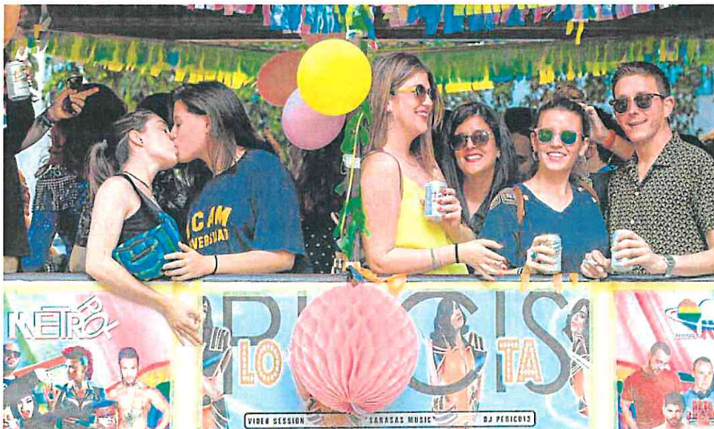
Dos chicas se besan en una manifestación con el lema 'Contra la transfobia social, más educación en diversidad afectivo sexual'.