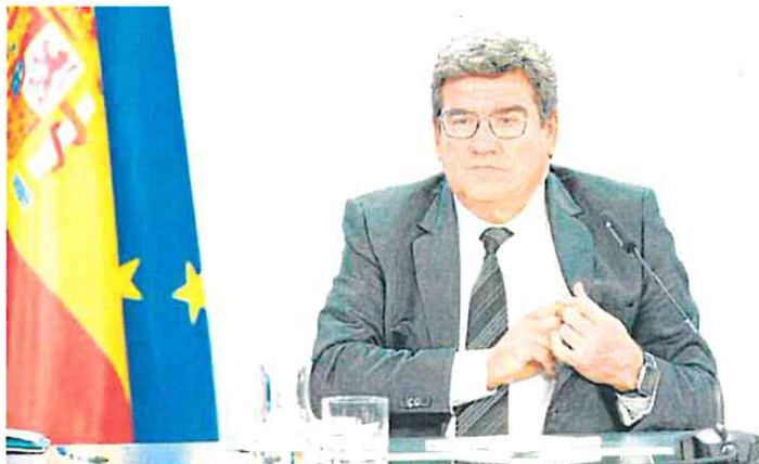
El ministro de Inclusión, Seguridad Social y Migraciones, José Luis Escrivá.