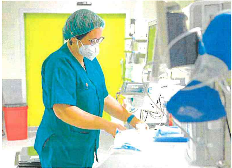
Una sanitaria revisa equipos en un quirófano del Rafael Méndez.

«Los profesionales no quieren venir al Rafael Méndez, no les resulta un hospital atractivo: está lejos de Murcia o Cartagena, no hay