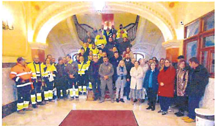
Los trabajadores municipales iniciaron ayer sus protestas en la escalinata del Ayuntamiento.

La asamblea de trabajadores, reunida el martes 28 de febrero, acordó llevar a cabo estas protestas para la convocatoria de la mesa general de negociación para modificar o adecuar varios artículos del convenio colectivo y el acuerdo marco de forma urgente para evitar que en Semana Santa no se cubran los servicios; además, solicitan la adscripción de un técnico de administración general de plantilla al departamento de personal que ostente la jefatura de servicio mientras no se cubren las vacantes «para evitar arbitrariedades que se están produ-