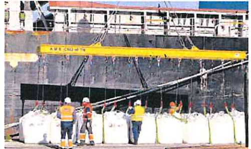
Labores de descarga de azúcar en el Puerto de Cartagena.

La Autoridad Portuaria junto a Agencia Marítima Blázquez y el operador J.J. Forwarder «trabajan para afianzar al Puerto de Cartagena como la puerta de entrada a Europa de azúcar refinado gracias a la