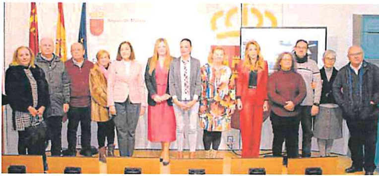
La consejera de Empresa -en el centro- posa, ayer, con los Inspectores de Consumo de la Comunidad. CARMI

La media nacional de suspensiones diarias debido a la huelga durante este periodo ha sido del 33% del total de los señalamientos y vistas programados.