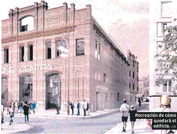
Recreación de cómo quedará el edificio.

Por mi Región se define como «un proyecto político regenerador, social y reformista al servicio de los intereses generales de los ciudadanos de nuestra Región de Murcia, como consecuencia necesaria, de todos los españoles».