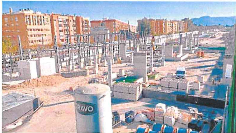
Cimentación y montaje del edificio definitivo de la estación en superficie de 4.400 metros cuadrados.