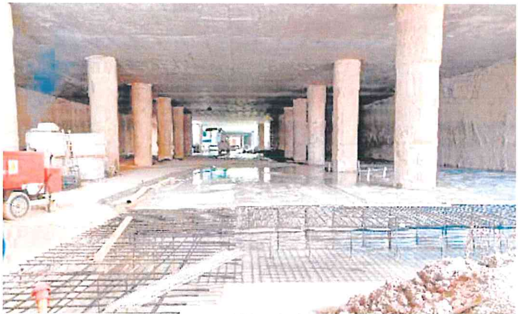
Encofrado de la losa de fondo del vaso central, en la parte soterrada de la estación del Carmen.

El corte por Cieza frena el 'triángulo ferroviario' de Alicante y Elche, por el paso de los mercancías de Escombreras