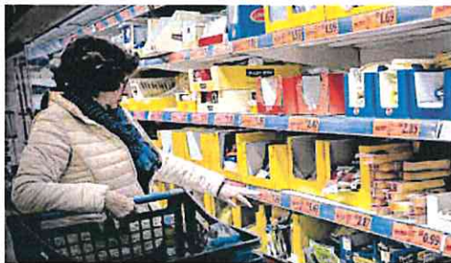
Una cliente observa los precios en un supermercado.

En ese apunte, el INE explica que esta evolución de los datos se debe a la subida de precios de la electricidad respecto al mismo mes de 2022, y a que los alimentos y bebidas no alcohólicas han subido más que entonces.