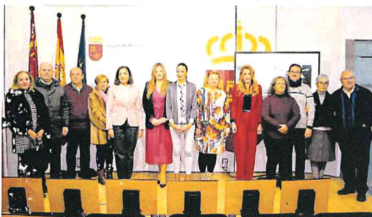
La consejera presentó ayer el plan junto a la directora de Consumo y personal del servicio.