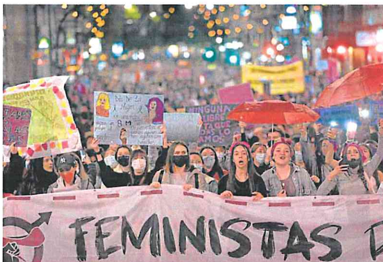
Un momento de la manifestación del 8M en Murcia, el año pasado.