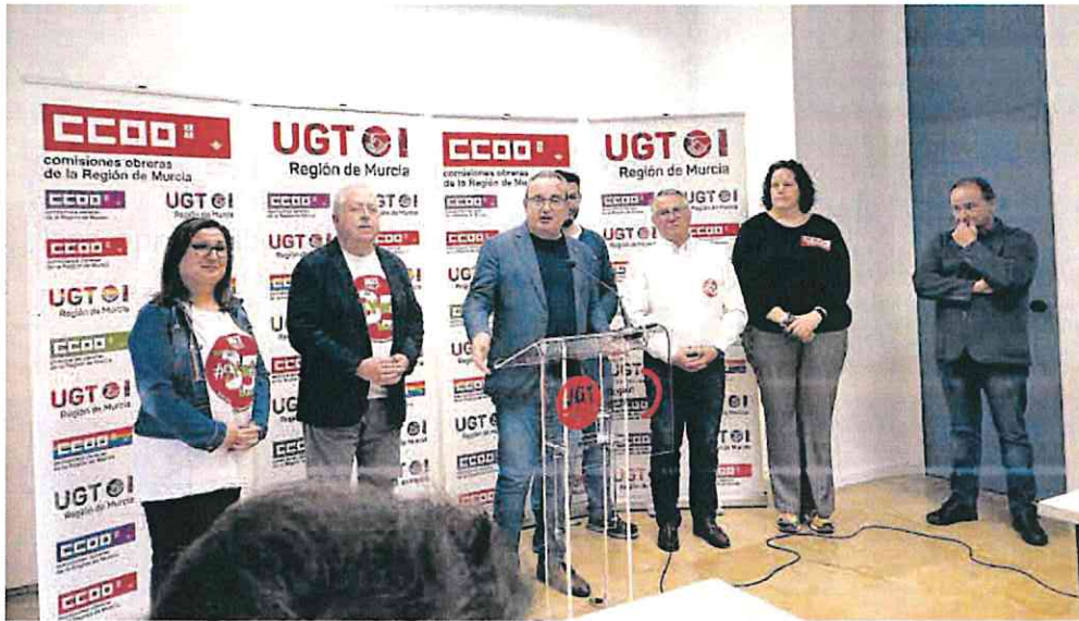
Los secretarios generales de CC OO y de UGT anuncian el preacuerdo alcanzado con el Gobierno para reducir la jornada.