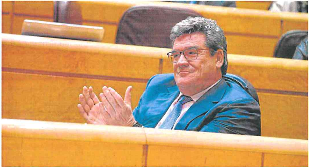
El ministro de Inclusión, Seguridad Social y Migraciones, José Luis Escrivá, durante un pleno del Senado.

Sin embargo, el férreo rechazo de la mayoría de grupos parlamentarios —especialmente de sus