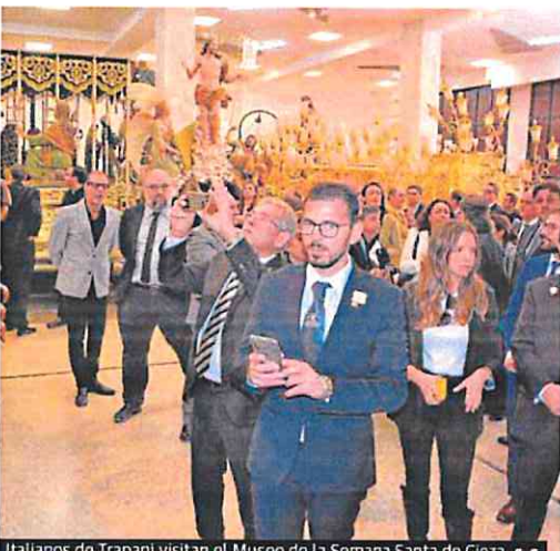
Italianos de Trapani visitan el Museo de la Semana Santa de Cieza. c. c.

A 15 kilómetros, en Los Alcázares, pueden adentrarse en uno de los mayores mercados medievales de España y todo el programa de juglares, piratas desembarcando en la playa y desfiles de moros y cristianos que incluyen las Incursiones Berberiscas del Mar Menor en su 22 edición.