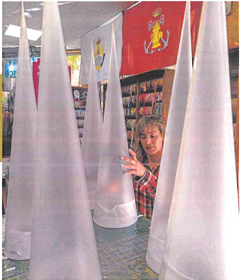
▲ Preparativos. Una dependienta de la tienda Bazar X, ubicada en la calle San Vicente prepara los capuces para su venta. P. SÁNCHEZ

Los talleres de costura que confeccionan y arreglan túnicas, así como las mercaderías que venden