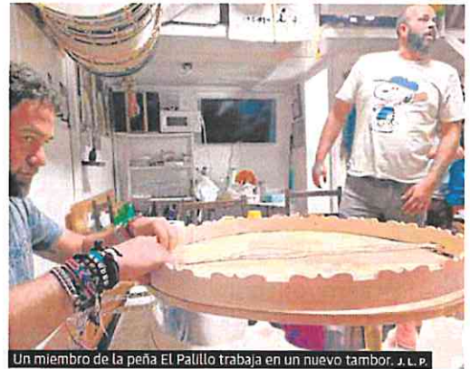
Un miembro de la peña El Pallillo trabaja en un nuevo tambor. J. L. P.

La tamborada, declarada Patrimonio Inmaterial de la Humanidad por la Unesco, es un acto ancestral, una ceremonia colectiva que no solo protagoniza, sino que también define los días de la Semana Santa en Moratalla. En cuanto a procesiones, cabe destacar las de Miércoles Santo, con el Cristo de la Sangre; el Jueves Santo, con el cortejo del Prendimiento, así como las del Silencio y el Encuentro de Nuestro Padre Jesús Nazareno y La Dolorosa; y el Viernes Santo, con el cortejo del Santo Entierro.