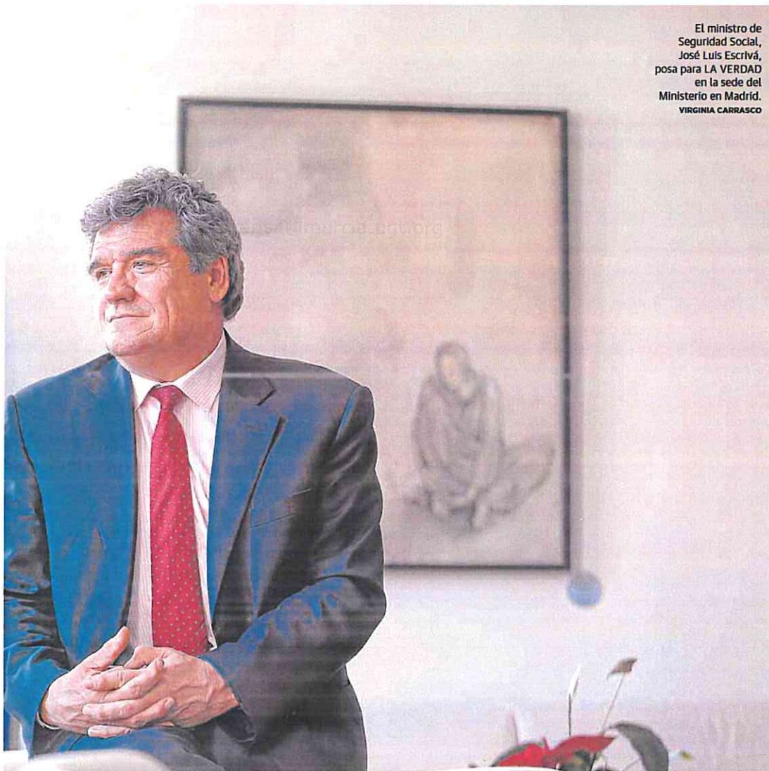
El ministro de Seguridad Social, José Luis Escrivá, posa para LA VERDAD en la sede del Ministerio en Madrid.

«Quien tenga una urgencia en la Seguridad Social, que acuda sin cita»