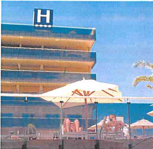
Dos turistas toman el sol en la terraza del hotel Thalasia.

la mayor parte de los turistas llegan atraídos por las playas, pero propone «ampliar las procesiones de Semana Santa con un desfile entre San Pedro y Lo Pagán para atraer visitantes».