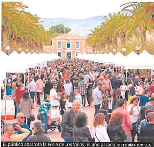
El público abarrotó la Feria de los Vinos, el año pasado, SIETE DÍAS JUMILLA