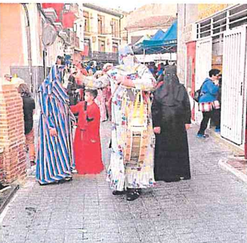
Tamboristas con las singulares túnicas, por el centro de Moratalla.