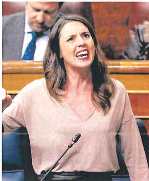
La ministra de Igualdad, Irene Montero, en el Congreso.

Pese a la Circular aprobada por la Fiscalía General del Estado para tratar de frenar las rebajas y excarcelaciones, los magistrados madrileños rechazan someterse a matización alguna al carecer la ley