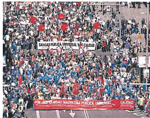
Manifestación en favor de la sanidad pública, ayer en Madrid.