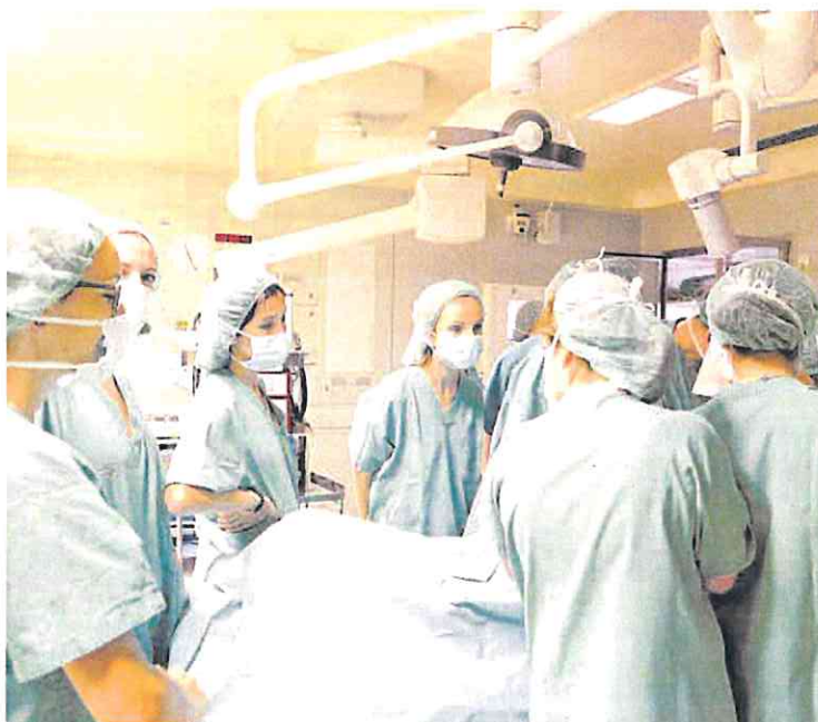
Alumnas en prácticas asisten a una intervención en el hospital Reina Sofía.

La sanidad pública tendrá que costear las cotizaciones de los alumnos que realizan prácticas obligatorias incluidas dentro de los programas formativos de las diferentes carreras que imparten las universidades, salvo que «en el convenio o acuerdo de cooperación que, en su caso, se suscriba para su realización se disponga que tales obligaciones correspondan al centro de formación responsable de la oferta formativa». En este caso, serían las instituciones académicas quienes asumirían las cuotas a pagar. La Consejería de Salud no se ha