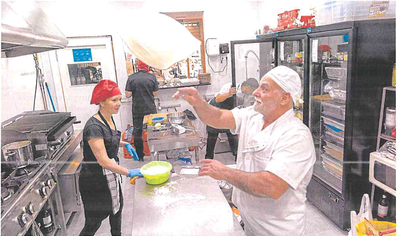
Trabajadores del restaurante Italiano Camorra, de reciente apertura en la plaza de San Francisco, en el centro de Cartagena.