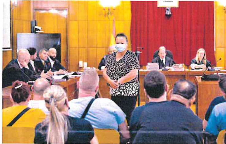
La matriarca del clan interviene en el juicio celebrado ayer en la Audiencia Provincial de Murcia.