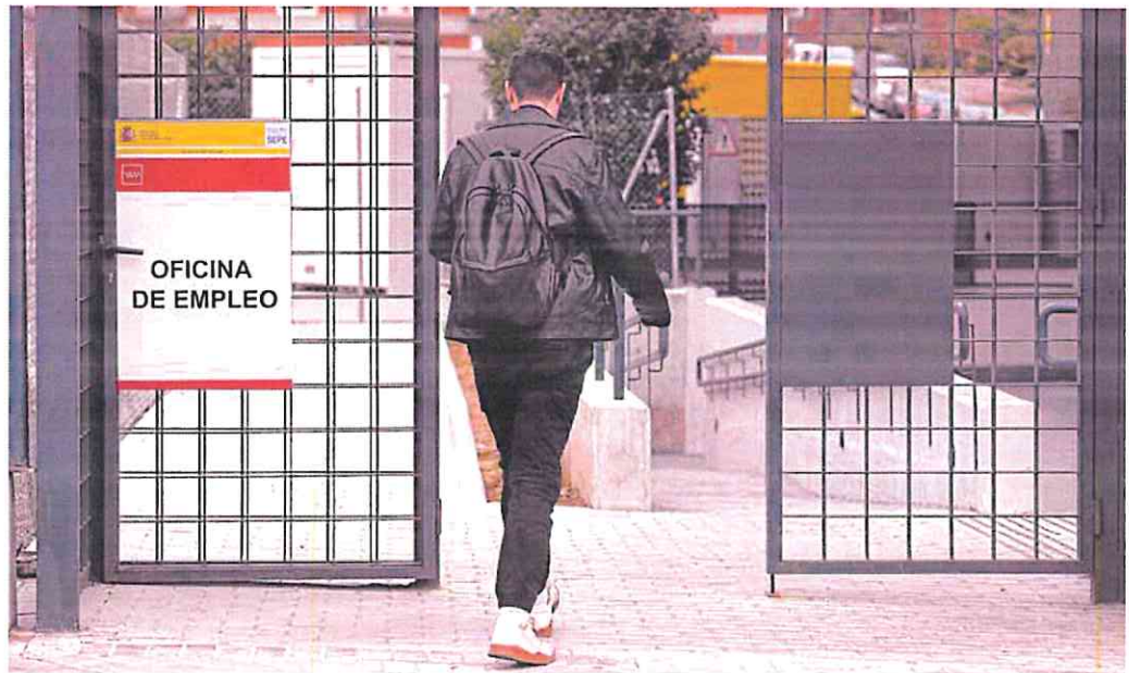
Un hombre entrando a una oficina de empleo. J. R. LADRA

Desde CC OO instaron al Gobierno a aprobar esa reforma que habían prometido para ampliar la cobertura y simplificar los subsidios. Sin embargo, el sindicato se lamentó de que no han convocado a los agentes sociales y que va a ser poco ambiciosa.