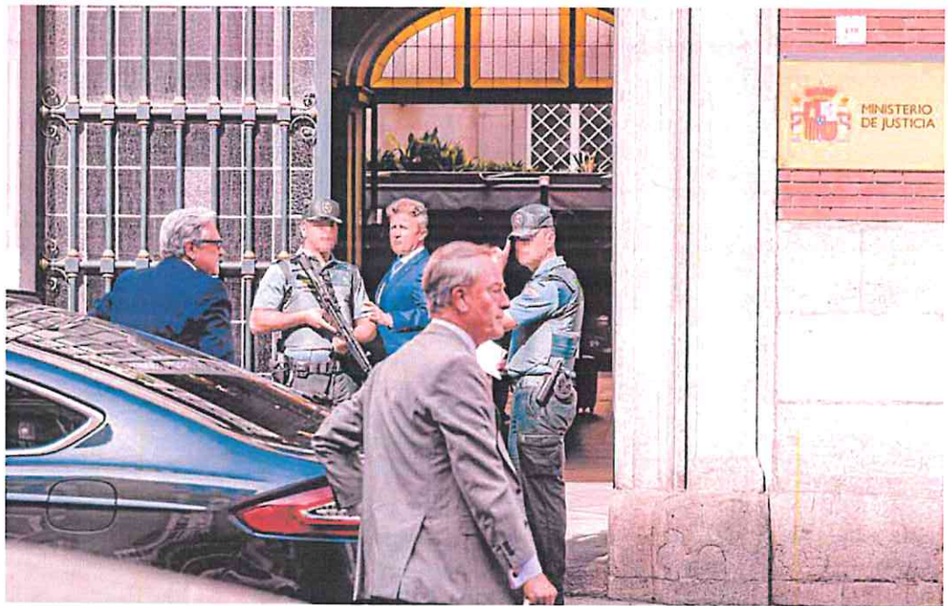
Representantes de las asociaciones de jueces y de fiscales y vocales del CGPJ, ayer, entrando al Ministerio de Justicia.

Muchos son los motivos que llevan a cuatro asociaciones de jueces y tres de fiscales a colgar las togas, pero el principal es el incumplimiento de la ley de retribuciones de 2003. Esta norma se aprobó para regular el sistema retributivo de sus profesionales, que no pueden por ley estar sindicados, y estableció que cada cinco años se reuniría. En 2008 hubo un amago de acuerdo que saltó por los aires por la crisis financiera y que, además, vino acompañado de una reducción de sus sueldos del 9,5%. La llegada del Gobierno de Mariano Rajoy tampoco propició cambio alguno y bajo el mandato de Pedro Sánchez las cosas no han mejorado.