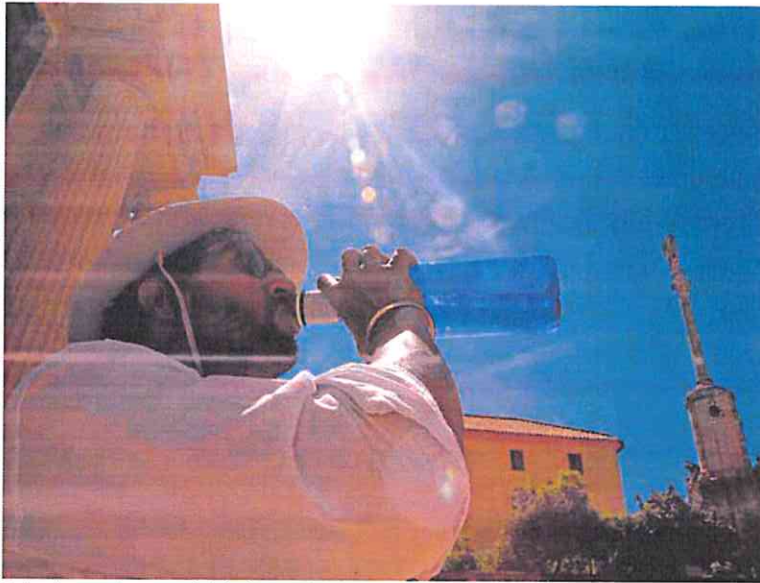
Un hombre se refresca en Córdoba durante el episodio de altas temperaturas de abril.

Aunque los últimos años ya han sido los más calurosos de la historia en todo el planeta, la probable irrupción de El Niño, que sustituirá a La Niña, elevará todavía más los termómetros. «Acabamos de tener los ocho años más cálidos de los que se tiene constancia, a pesar de que en los últimos tres hemos tenido un enfriamiento provocado por La Niña que ha actuado como freno temporal al aumento de la temperatura global», recordó ayer el secretario general de la OMM, Petteri Taalas. El mundo se encuentra ahora en un periodo neutro, de transición, entre La Niña y El Niño y «lo más probable es que el desarrollo de El Niño provoque un nuevo repunte del calentamiento global y au-