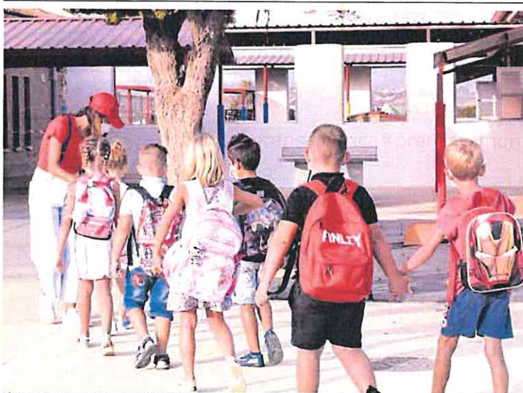
El acuerdo entre padres y pediatras busca lograr entornos escolares más seguros.

Además, trabajarán para crear entornos escolares con mejor calidad del aire y planificarán un curso universitario de Salud Ambiental Escolar.