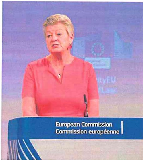
La comisaria de Interior, Ylva Johansson, ayer.

Dicha modificación, que entró en vigor el pasado 12 de enero, mantuvo el tipo tradicional de malversación en el artículo 432 con las mismas penas (de dos a doce de cárcel y de seis a 20 años de inhabilitación), pero precisando que debe haber «ánimo de lucro» cuando la autoridad o funcionario público «se apropiare o