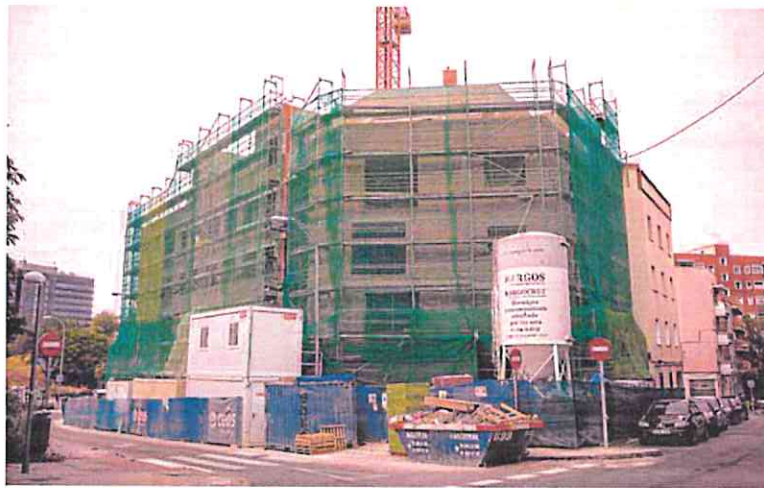
Un edificio de viviendas en construcción.

Y aunque Powell defendió ante los medios que «el sistema es sólido y las condiciones financieras han mejorado desde marzo», la reciente caída de First Republic Bank hace dudar de sus palabras. Hay quien piensa, incluso, que el organismo tendrá que bajar tipos antes de que termine el año para evitar una recesión.