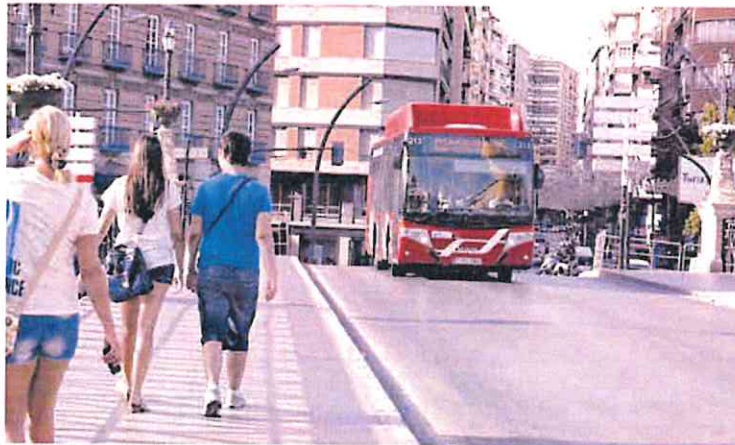
Un autobús 'colorao' circula por el puente de los Peligros de Murcia.

El Ayuntamiento trabaja para reestructurar el contrato, pero el trámite sigue pendiente del informe de Intervención