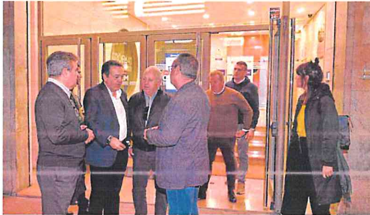
El presidente de Croem y los secretarios de UGT y CC OO, el 16 de marzo, tras el acuerdo.