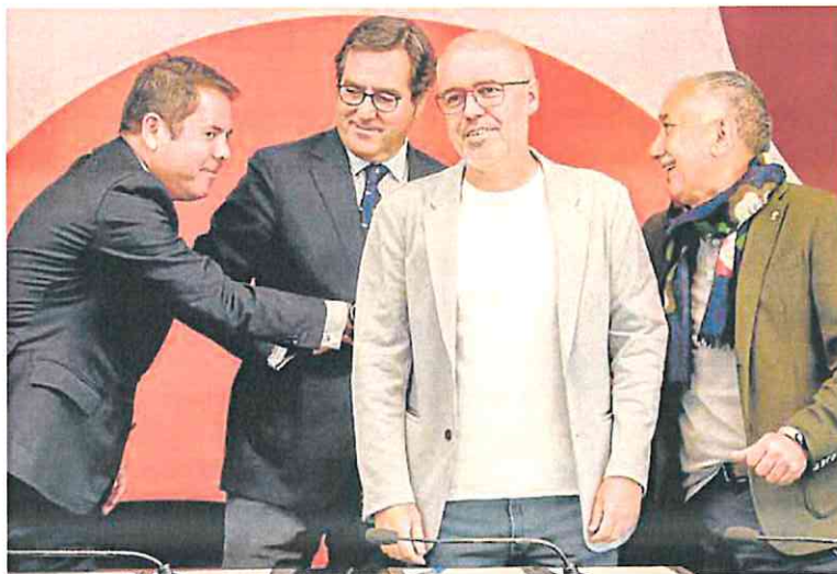
De Izq. a dcha., los dirigentes de Cepyme, CEOE, CC OO y UGT, en la firma del acuerdo salarial, el pasado martes. »

do para el Empleo y la Negociación Colectiva recoge una subida salarial de un 10% en tres años, entre 2023 y 2025. Para este año la subida será de un 4%, mientras que será del 3% para 2024 y 2025, a las que se podría añadir un 1% adicional en caso de que el IPC interanual de diciembre sobrepase esas subidas.