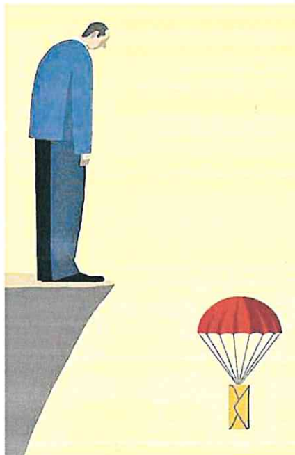
ILUSTRACIÓN DE Leonard Beard

Retomando los aspectos más visibles, su salario estaba a finales de 2022 15 puntos por debajo del IPC y CCOO ha negociado una subida entre 2022 y 2024 de hasta un 9,5% después de años de 0 o 0,5% de subida. En segundo lugar, respecto a la recuperación de la jornada de 35 horas semanales, conviene recordar que este derecho ya se tenía hace