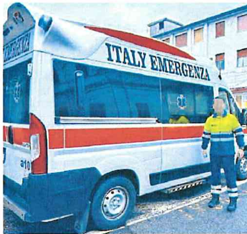
Uno de los sanitarios del 061 posa en Italia.

Según los datos a los que ha tenido acceso La Opinión, el aviso se activó en la Gerencia del 061 el pasado 10 de abril y fue tipificado como un traslado interhospitala-