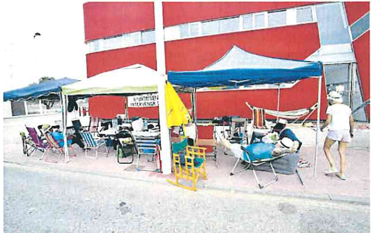
Los conductores de los 'coloraos' han estado acampados en el exterior de las cocheras seis días.

Los conductores de los autobuses conocidos como los 'coloraos' iban a ver recortado su sueldo en un 42%, y, tras numerosas protes-