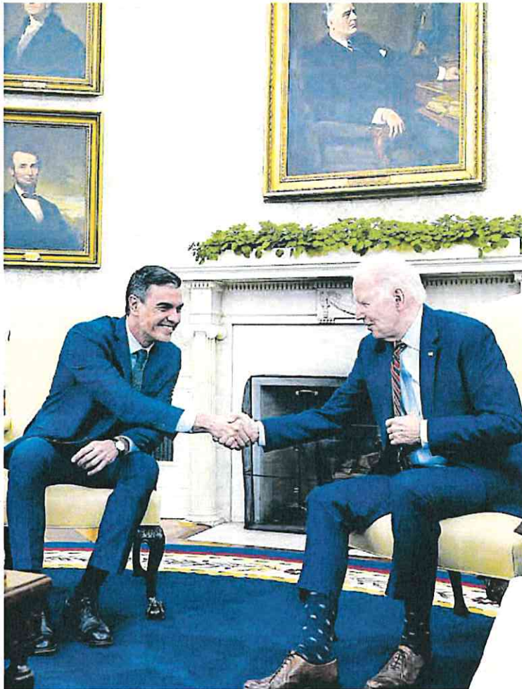
Sánchez y Biden se dan la mano en el Despacho Oval de la Casa Blanca, ayer.

Sánchez quiso subrayar también los «valores comunes y las excelentes relaciones bilaterales». «Somos aliados, amigos y socios», dijo antes de destacar