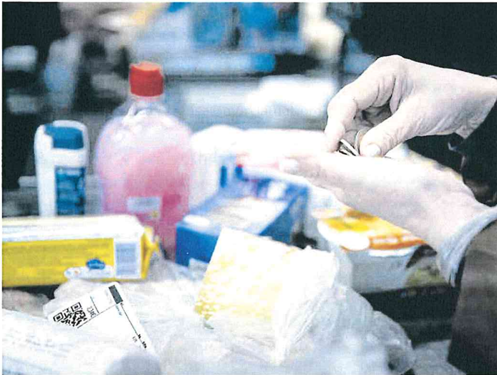
Una mujer paga la compra en un supermercado.