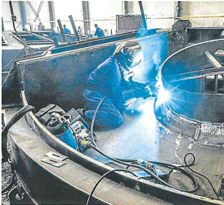
Trabajos de soldadura en un astillero santanderino.

España no ha hecho un gran uso de este fondo para trabajadores despedidos a tenor de las cifras. El fondo ha proporcionado ayudas a empleados del sector de la automoción, la cerámica, el textil, la metalurgia, la construcción,