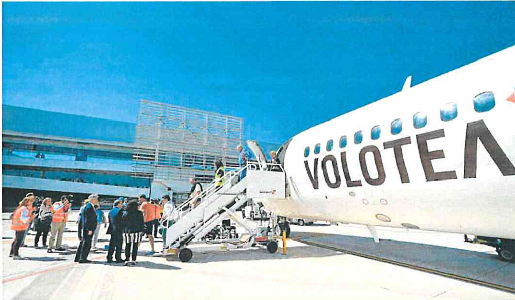
Primer vuelo de Volotea en el aeropuerto Internacional de la Región de Murcia en 2019, cuando abrió la ruta con Asturias.