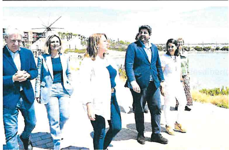
Fernando López Miras estuvo ayer en San Pedro del Pinatar junto a otros miembros del PP.