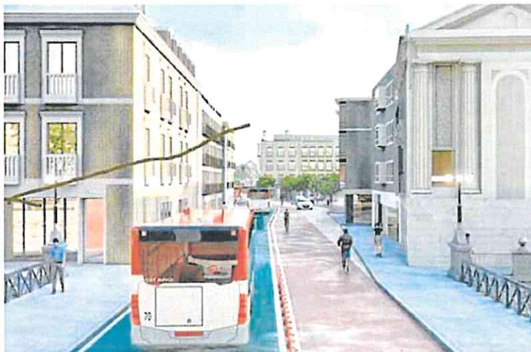
Recreación de cómo quedará el Puente Viejo tras las obras que empiezan esta semana. APTO.

formarán el carril de circulación para el tráfico en un carril bici bidireccional, modificando la ubicación actual del carril bus. Además, se ampliarán las aceras y se incluye un tramo de calzada de uso compartido para peatones y vehículos de acceso a los garajes.