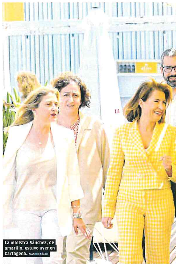
La ministra Sánchez, de amarillo, estuvo ayer en Cartagena.