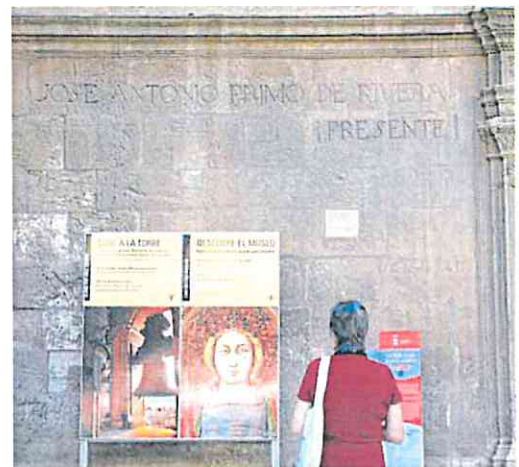
Inscripción en honor a Primo de Rivera en la Catedral.

La Federación de Asociaciones de Memoria Histórica reclama al Ministerio de Félix Bolaños que inste al Obispado de Car-