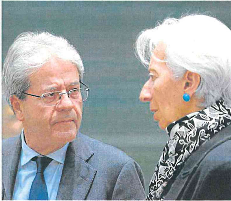
El comisario de Economía, Paolo Gentiloni, ayer junto a la presidenta del BCE, Christine Lagarde.

La vicepresidenta primera y ministra de Asuntos Económicos, Nadia Calviño, avanzó a finales de abril que el Plan de Es-