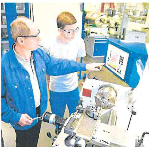
Un joven realiza prácticas laborales en una empresa.

No obstante, quedan excluidos de estos límites los empleados con discapacidad. «Para determinar la plantilla de trabajadores no se computarán las personas vinculadas con un contrato formativo», aunque «cada persona con