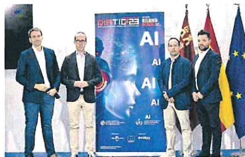
Presentación de las jornadas del DíaTIC23.

«La Inteligencia Artificial es una de las tecnologías más transformadoras e impactantes de nuestro tiempo. Desde su invención, la IA ha evolucionado rápidamente y ha tenido un impacto significativo en