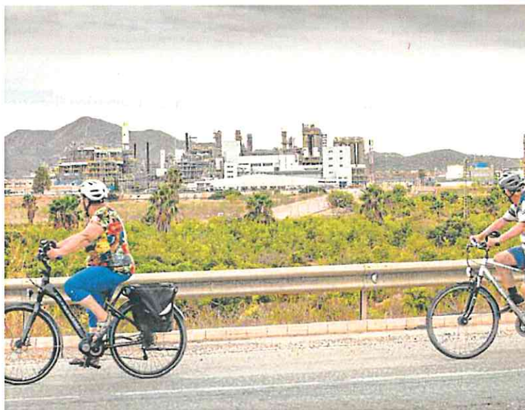
Dos ciclistas pasan ante el complejo Industrial de Sabic en La Aljorra, en 2022.

La carga química superó el Nivel Genérico de Intervención del borrador de Directrices de con-