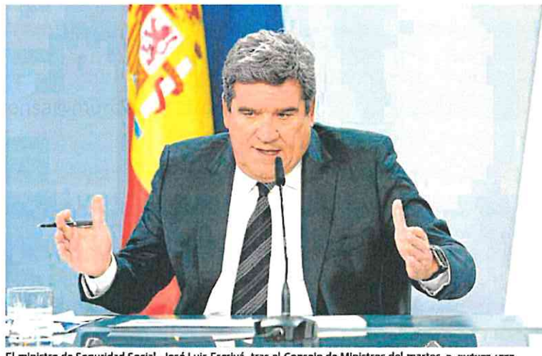
El ministro de Seguridad Social, José Luis Escrivá, tras el Consejo de Ministros del martes.

El ministro, pocos días después de negar en el Congreso el mal funcionamiento de la Seguridad Social y decir que eran «bulos» del PP que sea necesario acudir con cita previa, reconoce ahora que sí tienen «dificultades para ofrecer un servicio óptimo a la ciudadanía». En este sentido admite la «carga de trabajo pendiente» que «soportan» los funcionarios de este organismo público, según recoge el texto que este martes se aprobó por unanimidad en la mesa de negociación.