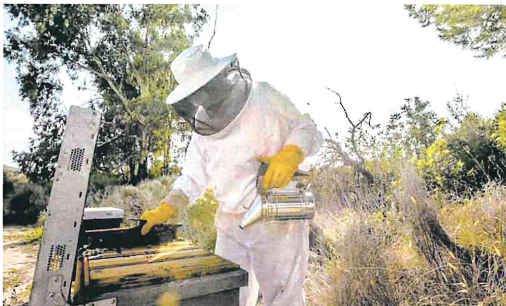
La cuantía de la ayuda será de 58,95 euros por colmena.

La cuantía de la ayuda será de 58,95 euros por colmena elegible, por lo que el máximo para un asentamiento de 40 colmenas elegibles será de 2.358 euros. La ayuda está prevista para un período de tres años, con un presupuesto total para todo el período de 1.309.912 euros.