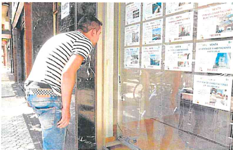
Un joven mira la oferta de viviendas en el escaparate de una inmobiliaria. p. v.

Y el mismo escenario presentan los datos del conjunto del primer trimestre. Entre enero y marzo, el número de hipotecas bajó