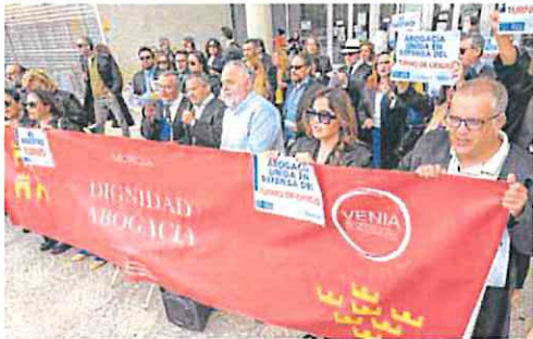
Letrados protestando a las puertas del juzgado en Murcia.

Este colectivo exige, además, que se les reconozca la condición de autoridad, cuando ejercen sus funciones, para evitar «agresiones, acosos y ataques». Los letrados reclaman, asimismo, la formación gratuita para el acceso al turno de oficio y el derecho a la desconexión digital «para poder gozar de un mínimo de ocio y descanso en días normales y especialmente en fines de semana y vacaciones, para conciliar con la familia».