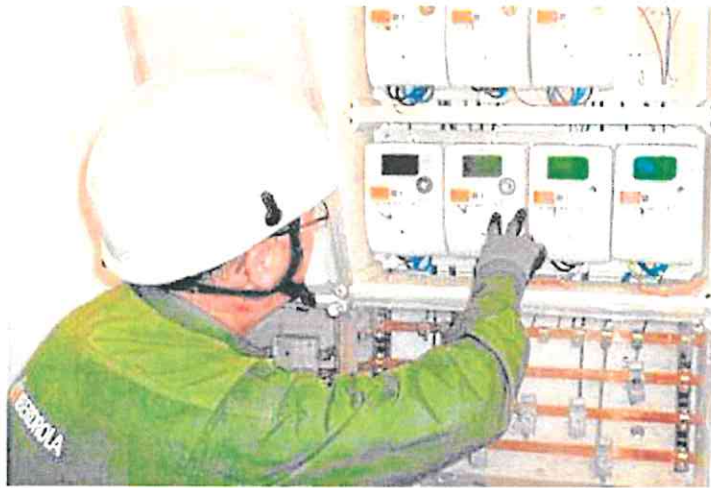
Un operario de Iberdrola revisa un panel de contadores eléctricos. p. v.

Los últimos datos (son de julio de 2022) revelan que la media de edad de la plantilla del Ministerio de Hacienda es de 52 años, lo que implica una tasa de jubilación muy elevada en los próximos años que será difícil de reponer con los aspirantes actuales. Por ello, estas becas buscan también incentivar la llegada de nuevos profesionales a esta administración con escasa rotación y cobertura de plazas. «Otro de los objetivos del plan es la atracción de talento», señalan desde Hacienda.